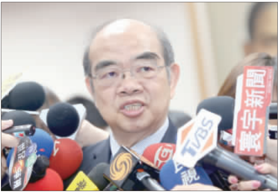
教育部長吳茂昆請辭獲准，是任期最短的教育部長。

【中央社記者許秩維台北29日電】教育部長吳茂昆於4月19日上任後，接連傳出赴美開公司、違法赴陸等爭議，行政院今天證實吳茂昆請辭獲准，任期至今天剛好41天，也是任期最短的教育部長。 前教育部長潘文忠因台大校長遴選案於4月中旬向行政院請辭，之後行政院宣布由中央研究院士吳茂昆接任教育部長。 吳茂昆是淡江大學物理系畢業，後取得美國休士頓大學物理學博士學位，曾任行政院國家科學委員會主任委員、東華大學校長等職，專長為超導物理與磁學，曾與中研院士朱經武發現世界第一個高於液態氮溫度超導體，被提名諾貝爾物理獎。 對於社會關注的台大校長遴選案，吳茂昆在上任後快速召開跨部會小組會議，經過2次小組會議後，於4月27日正式駁回台大