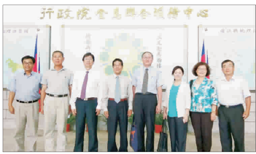
監委委員劉德勳、仇桂美、林雅鋒、蔡崇義、巡察福建省政府，並與省府秘書長翁明志及主管合照。

記者莊煥寧／綜合報導 福建省政府108年度不再編列預算，相關業務移轉中央或地方機關，監察委員劉德勳、仇桂美、林雅鋒、蔡崇義等四位昨日下午巡察省府時，他們關心省府明年預算及去任務化之後人員歸屬與業務轉型，省府秘書長翁明志指出，未來省府雖政策性不再編列預算，但人員移撥其他機關後，仍會視意願辦理行政院金馬聯合服務中心業務；且因省府為憲政機關，除非修憲，否則「零預算及去任務化」並不同義裁撤或廢省。 昨日福建省政府向監委簡報處規畫，原則上，台灣省政府、台灣省諮議會及福建省政府等三個「省級機關」，108年度金馬聯合服務現況等問題，分由省府相關人員