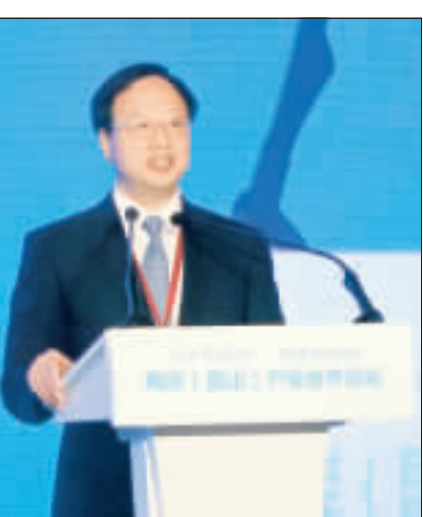
江宜樺兩岸產業論壇致詞

對於外傳大陸方面指示，7月1日前來台參訪團和商務團不再送件，中國大陸海峽兩岸關係協會會長張志軍說，「我本人沒有聽到這項消息。」 張志軍出席兩岸(昆山)產業合作論壇開幕式，會後接受媒體採訪，對於台官員等人士嚴審，他說，兩岸交流已經30週年，「台灣官方還阻礙兩岸交流，是走回頭路」，他認為這是有違民意，「不可能得逞」。 至於外傳大陸方面也提出反制措施，要限制當地參訪團、商務團來台，並不再送件，張志軍說，「我本人沒有聽到這項消息，有關情況你們去問大陸的旅遊等有關部門。」 開幕式中，由行政院長、長風文教基金會董事長江宜樺說，他來此參訪台企，理解他們奮鬥打拚的過程，他認為兩岸交流30餘年，只要秉持合作、互利、雙贏的精神，就可以打造出令世界刮目相看的奇蹟。 張志軍在開幕致詞中，重申大陸方面堅持「九二共識」、堅決反對任何台灣獨立活動。他說，2016年在內的多個兩岸聯繫溝通中斷，但兩岸社會各界群體持續交流合作，兩岸產業合作趨勢未變。 兩岸產業合作論壇自2012年起在江蘇省昆山市和台灣輪流舉辦，2016年台灣政黨輪替後曾經暫停，2017年又恢復舉行。 (中央社)