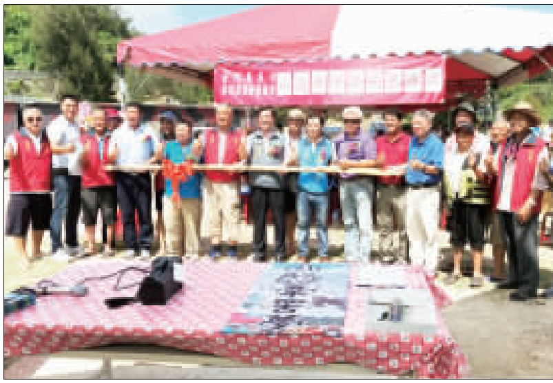
左、金門縣成功休閒漁業發展協會辦理「山海牽習夢活動」開幕，在與會貴賓授標下正式開跑；右、活動有牽罟、補網、划槳及搖櫓和美