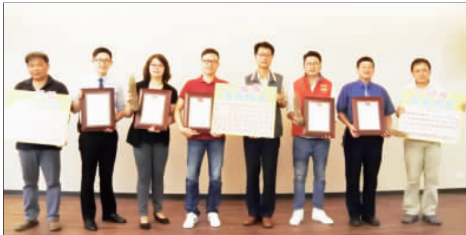
金門縣農業試驗所昨辦理「107年度一條根廠商收購證明頒發暨績優種植農友表揚」。