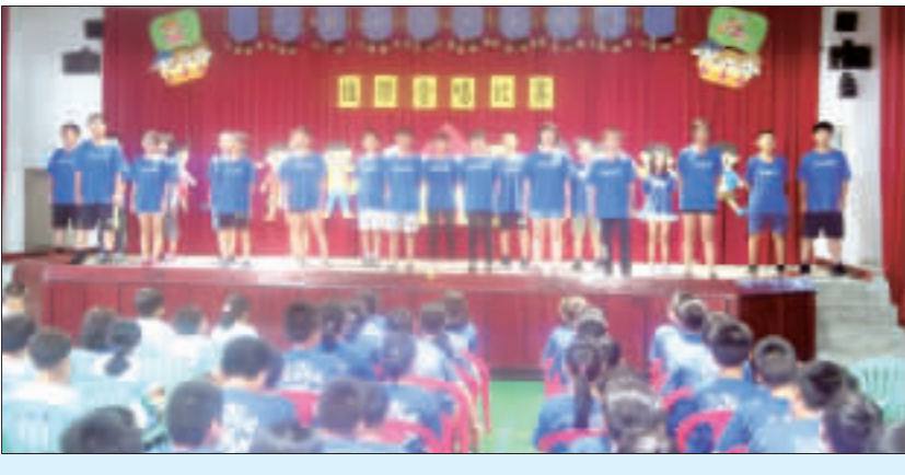
古城國小為配合應屆畢業典禮即將到來，日前在學校活動中心舉辦班際合唱比賽活動。

記者李增江／綜合報導 古城國小為配合應屆畢業典禮即將到來，加強學生對校歌及畢業歌之認識與學習，激發學生學習學校及畢業歌之興趣，培養學生愛校情懷與團隊精神及榮譽感，特於昨日在學校活動中心舉辦班際合唱比賽活動。 該項活動以班級為單位，三、四、五、六年級各班一律參加。比賽曲目為古城國小校歌及畢業歌，「破浪二首」，曲調清新，「日麗風和雲飄盪，流水細雨野花香，海山雄奇春無盡，地靈人傑美名揚，湖光山色傍古城，最是求學好地方，讀書遊戲樂融融，書聲笑語如瀾浪，德智體群美並重，精誠勤奮崇校綱，今為吾校好少年，明為中華作棟樑。」把古城國小優美的環境、美好的校園景觀都在歌詞中一一呈現。看見孩子們站上舞台，引吭高歌優美高亢的校歌，神采奕奕的模樣，真是令人感動。 本次班際合唱比賽評分的標準為以下三項：音樂表現及技巧佔60%、團體精神佔30%、其他佔10%。由教導處聘請校內具有音樂專長及素養之人員共三人擔任評審。該項比賽評審結果，成績如下：第一名601班、第二名301班、第三名401班、優勝501班。各獲獎班級將由該校頒發獎金及獎狀，以資鼓勵。