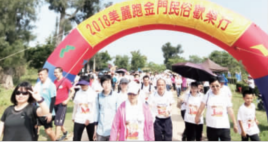
移民署今年1月份陸續放寬小三通便利措施，這項新措施使得辦證更加方便快捷，衝刺小三通人數與陸客人數持續攀升。

記者李增注／綜合報導 小三通人數近期持續成長，據移民署統計資料顯示，小三通入出境1-5月累計達714,000人次，較去年同期增加1,900人次，佔1.2%，其中台灣旅客計52,900人次，佔7.4%，大陸旅客計66,100人次，佔9.3%，外籍旅客計4,900人次，佔0.7%。而陸客之中，入境計46,500人次，較去年同期增加1,000人次，增加2.2%。其中，以落地簽入境計21,400人次，較去年同期增加1,000人次，增加4.7%。 近年，在陳縣長積極遊說與爭取之下，移民署今年1月份陸續放寬小三通便利措施，這項新措施使得辦理更加方便快捷。尤其自4月20日起，廈門兩門旅遊部門，共同啟動「金廈旅遊節」系列活動，如海峽旅遊博覽會、2016海峽兩岸及港澳地區名導論、金廈跨越海峽越野行走活動、金廈美麗跑之金門民俗歡樂跑等，再加上5月金門平安祈禱季與「滄島邑」古城慶慶治三百三十八週年一等，衝刺小三通人數與陸客人數持續攀升。 縣府觀光處表示，現在觀光旅遊已趨多樣化，不再只是走馬看花，更重要的是融入體驗與在地生活，尤其金門特有之區區、閩南、僑鄉、酒鄉、宗教、宗族與聚落優勢，在在都能吸引兩岸三地之觀光客。未來持續透過行銷包裝、在地活動與體驗旅遊，打造屬於金門之在地觀光。