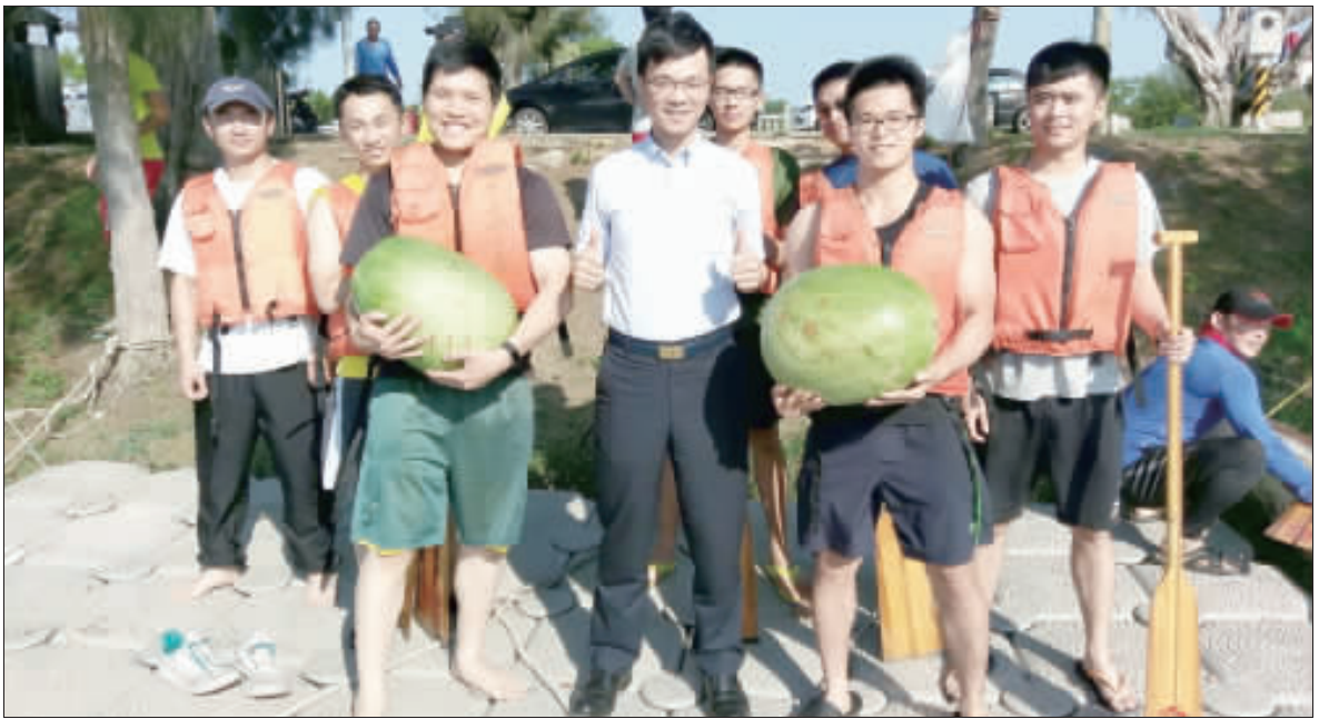
金門縣警察局局長劉耀欽率領警隊參加龍舟競賽，並歡迎各界人士踴躍參加。