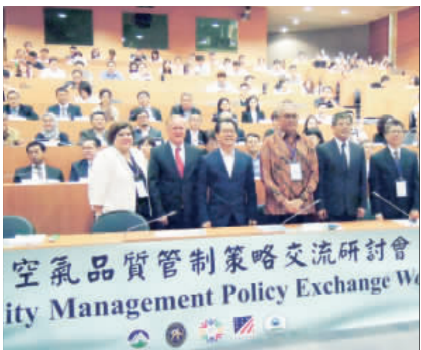
環保署與美國環保署4日起在台北合辦「空氣品質管制策略交流研討會」，共計10個國家代表來台。環保署長李應元(前左3)盼此次研討會能成為區域合作契機，進一步推動新南向空氣品質管理平台。

【中央社記者吳欣恬台北4日電】環保署與美國環保署合作舉辦「空氣品質管制策略交流研討會」，共計有10個國家代表來台。環保署表示，希望此次研討會能成為區域合作契機，未來進一步推動新南向空氣品質管理平台。