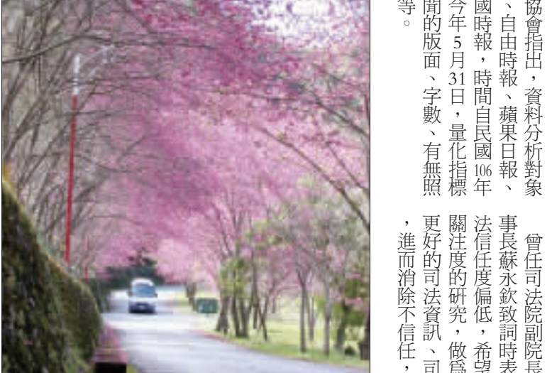
台電萬大水力發電廠座落南投縣仁愛鄉山區，結合原住民部落文化，造就融合自然與人文的生態環境，每當春天廠內櫻花盛開，更是內行人賞櫻秘境。