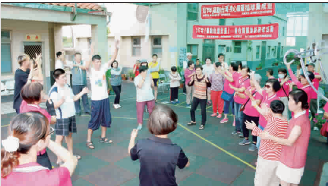
和晨光教養家園園民歡唱舞蹈同樂，場面溫馨。

的白米、沙拉油慰問物品，提前過一個愉快的端午節！ 目前，全縣有十二個目的事業主管機關推動志願服務，其中縣府社會處轄屬加入詳和計畫共計五十九個志願服務團隊，餘皆由各目的事業主管機關合計共籌組三十四隊，志工人數逾三千八百四十一人；縣府社會處也希望有更多的人加入志願行列，對金門地區社會祥和產