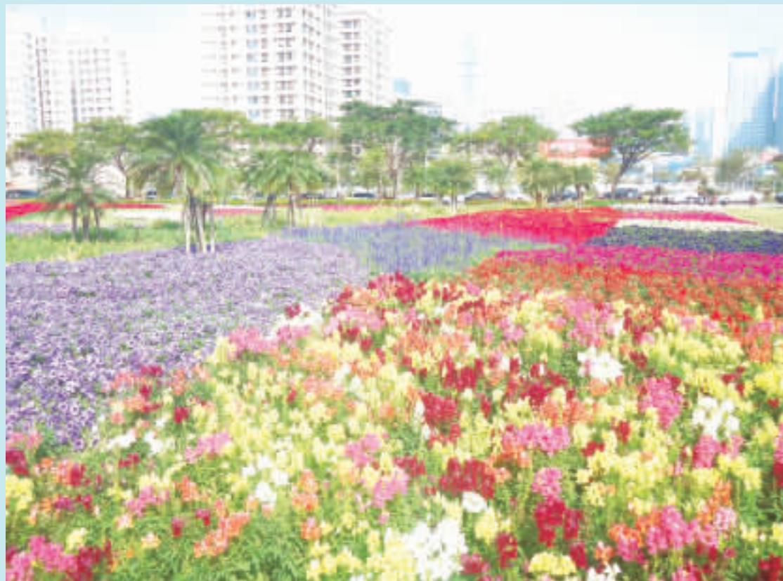
花漾城市，讓人在生活中，有了閒適自得的感觉。

凹子底的花況，在市區裡獨絕非凡；它們隨時序遞嬗而展現別樣的花情風采。春天，種種杜鵑、薰衣草；夏天，種植黃蝦花、非洲鳳仙；秋天種植朱瑾、魯冰花，冬天種植矮牽牛、聖誕紅。遙想起數年前，這一帶尚未開發，一片榛莽，盡是雜草，塵土飛揚，能一躍爲今日的繽紛彩象，也確實令人驚豔。晚霞時分，夕陽餘暉亮晃晃地映照在大樓的窗台上，好像這座城市就鑲上了金條一般；有時，陽光也綿綿地灑落在這整片的花園上，把色彩轉而更爲鮮明；照到的地方，花朵自爲嬌豔，照不到的地方，也隱約綻放著暖暖內含光的景象。