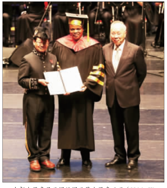
友邦史瓦帝尼王國的國王恩史瓦帝三世(H.M. King Mswati III)(中)9日出席實踐大學106學年度畢業典禮，獲頒名譽管理學博士學位。

林書豪勉勵畢業生7件事：1. 不要怕不進球，要堅信過去的練習，不斷投球。2. 要有「贏球」的態度。3. 不要怕不進球，要堅信過去的練習，不斷投球。4. 要有「贏球」的態度。5. 不要怕不進球，要堅信過去的練習，不斷投球。6. 要有「贏球」的態度。7. 不要怕不進球，要堅信過去的練習，不斷投球。