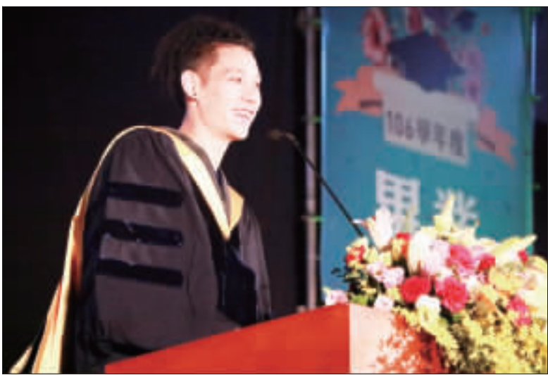
美國職籃(NBA)台裔球星林書豪(圖)9日上午出席國立政治大學畢業典禮，並結合人生經驗分享7件事，希望帶給社會新鮮人信心。(中央社)

【中央社記者黃瑞弘、陳建翎台北9日電】美國職籃(NBA)台裔球星林書豪今天在政治大學畢業典禮致詞，勉勵畢業生7件事，能有「贏球」的態度，不要怕不進球，要堅信過去的練習，不斷投球。