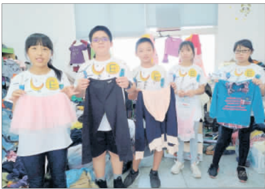
右、古城國小畢業生捐書包傳愛到非洲；左、古城國小學童捐出舊衣物，讓愛循環延續。