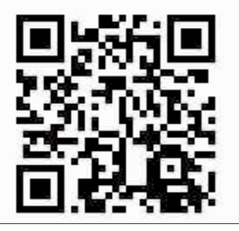
2018夏日國樂體驗營報名網址 QR Code。

金門國樂團今年夏天將於台中歌劇院演出，在此之前將辦理「2018夏日國樂體驗營」，金門國樂團成員將以輕鬆活潑的方式，帶領想一睹國樂神秘面紗的你，開心玩節奏、學習國樂知識、認識各種國樂器；也將由專業的老師指導學員親自接觸到樂器以及國樂演奏體驗等，愛樂的你請把握機會。