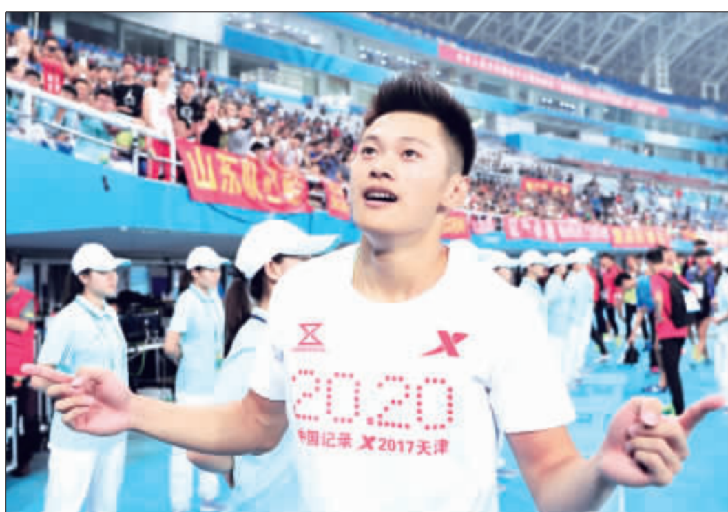
中國大陸短跑選手謝震業20日凌晨在法國一場男子100公尺賽事中，跑出9秒97的佳績，成為亞洲新飛人。圖為謝震業2017年9月5日在天津全運會連奪兩金後，接受觀眾歡呼。

中國大陸短跑選手謝震業在法國一場男子100公尺賽事中，跑出9秒97的佳績，成為亞洲新飛人。 謝震業在法國一場男子100公尺賽事中，跑出9秒97的佳績，成為亞洲新飛人。