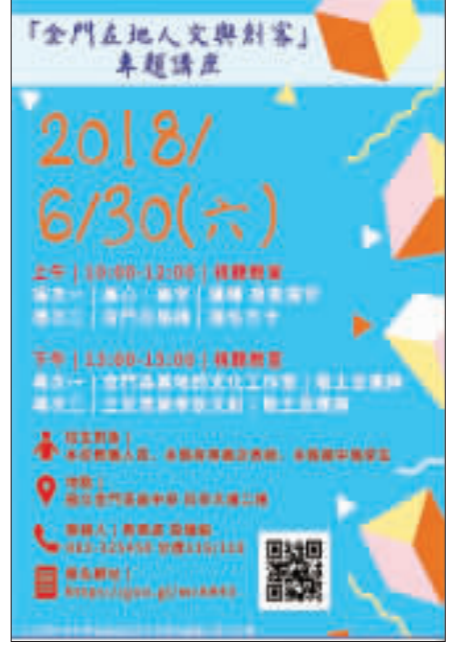
「金門在地人文與創客」專題講座即日起網路報名。

記者翁維智/縣府報導 配合823砲戰60周年紀念，為加強推廣，擴大老兵返金，縣府特別推出「2018戰地主題推廣活動-老兵召集令獎勵計畫」號召老兵返金旅遊。