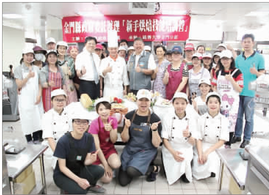
由金門縣政府社會處委託銘傳大學金門校區辦理之「新手烘焙技能培訓營」，兩梯次活動圓滿落幕，60位學員收穫滿滿。