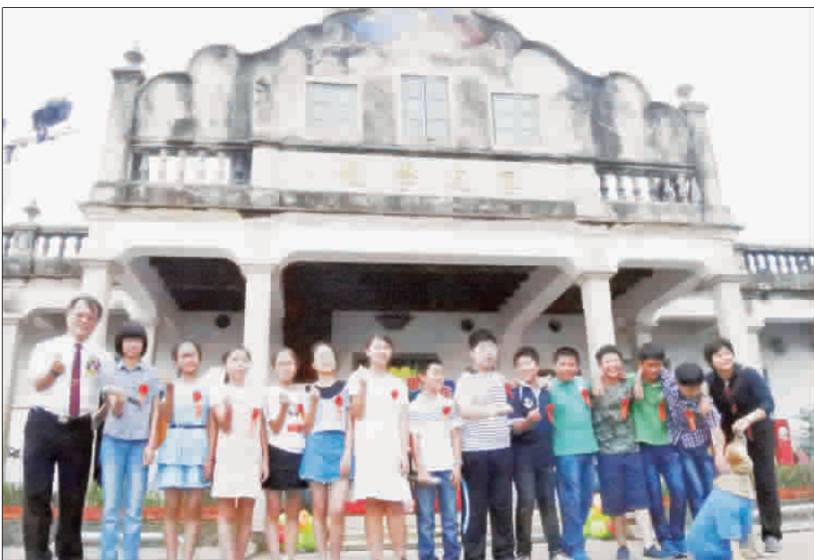
安瀾國小昨假睿友學校辦理畢業典禮，歡迎國小部13位及幼兒園12位畢業生。