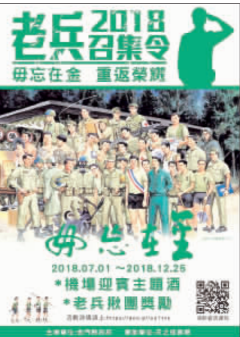
▲配合823砲戰60周年紀念，為加強推廣，擴大老兵返金，縣府特別推出「2018戰地主題推廣活動-老兵召集令獎勵計畫」號召老兵返金旅遊，活動並將以金門高粱酒之「樓重莒光」酒，搭配砲堡外盒、金防部三角標示掛飾，打造專屬之限量紀念酒款送給金門老兵。

另外，縣府也歡迎縣籍金門老兵返金旅遊，在金門服務達10人以上即可領取金門高粱紀念酒乙瓶。縣府表示，老兵在金門服役期間，同甘共苦，弟兄們每相見，情感濃厚，透過金門高粱酒共飲歡聚，一起懷想當年。相關活動資訊請上金門觀光旅遊網：https://金門travel/。