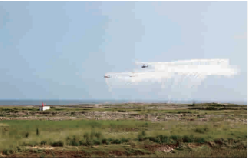
國軍反登陸作戰演練

國軍第五作戰區26日在台中番仔寮陣地實施「作戰區聯合反登陸作戰演練」任務，首先由民用無人機展開情蒐演練，接著經國號戰機兩架次火力支援，搭配海軍飛彈快艇2艘，對船塢登陸母艦攻擊演練，緊接著陸航8架次響尾蛇直升機發射地獄火飛彈，對戰車登陸艦攻擊，最後由陸軍155榴彈牽引砲猛烈轟炸完成任務。