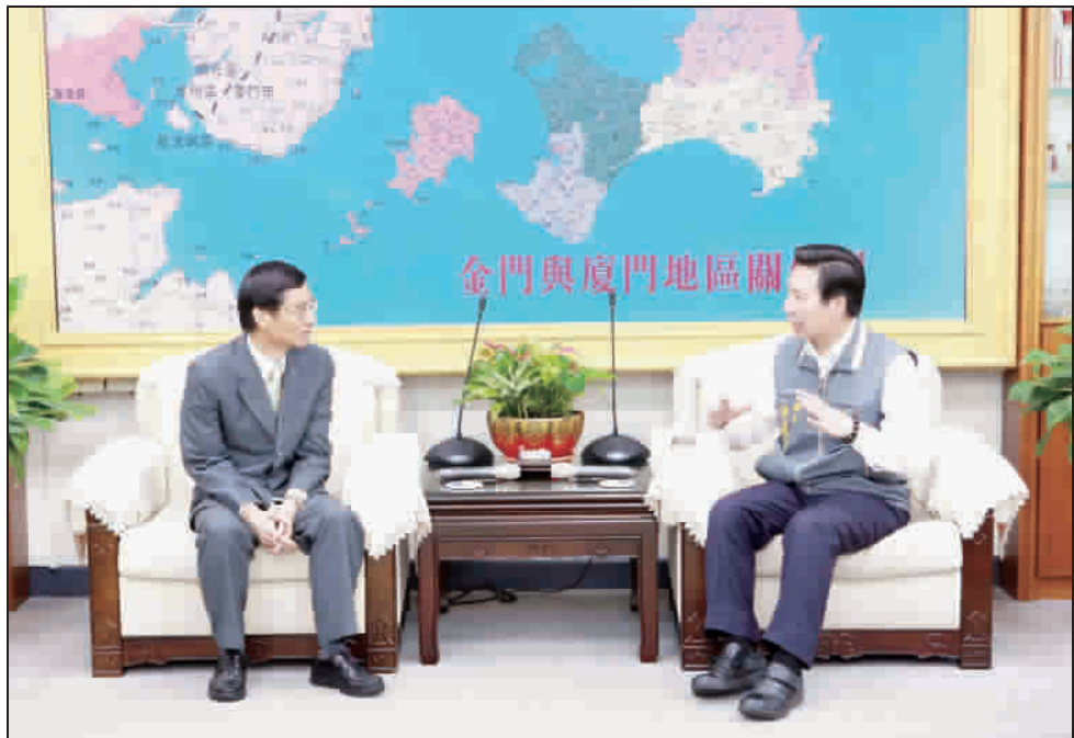
林萬億與陳福海在會中交換意見。

【本報記者楊水鈺、縣府報導】一項由衛生福利部主辦、金門縣政府辦理的「強化社會安全網地方溝通說明會」金門場，於昨日假縣府多媒體簡報室舉行，由行政院政務委員林萬億、縣府社會處長陳世保共同主持。在說明會前，林萬億與隨行的中央官員也拜會金門縣長陳福海，陳縣長把用心想為金門做的事向林萬億講，同時也請他向總統府、行政院來轉達與支持金門好的政策，雙方就金門議題交換意見；林萬億說，做一個地方官，都有這樣的期待！ 行政院政務委員林萬億帶領包括衛福部心理及口腔健康司司長蔣立中、教育部國民及學前教育署科長孫金門等，與金門縣長陳福海、就金門議題交換意見。