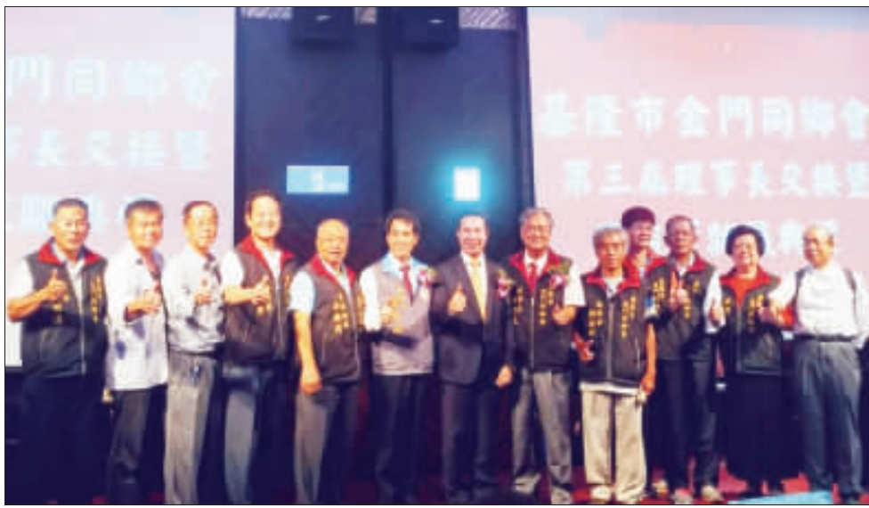
金門縣長陳福海與基隆市金門同鄉會理事監事和鄉親合影。

記者楊水詠／綜合報導 學校放暑假了，何處去呢？為豐富小朋友暑假生活，鼓勵孩子於暑假期間從事健康有益身心活動，金門太武山海印寺將於七月二十日至廿三日，假金湖綜合體育館舉辦「快樂行」兒童成長營活動，期透過參與夏令營課程的學習與啟發，為金門在地兒童教育注入活潑新氣象，海印寺誠摯邀請您，即日起一同來報名參加！ 暑假「快樂行」兒童成長營活動，係由海印寺籌劃辦理，期藉由佛教的課程，讓參加兒童能於活動中學習慈悲與智慧，讓人性最原本的孝順父母、尊敬師長的觀念，能植於每一個孩