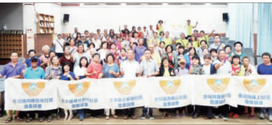
環保局辦理「環保志工特訓」課程，環保局長蔡其堯授旗予各志工人員代表並合影留念。

記者莊煥寧／綜合報導 金門縣環保局為鼓勵縣內各社區籌組環保志願服務隊，共同投入社區環保工作，特於六月三十日及七月一日，辦理「環保志工特訓」課程。課程內容包括：環保意識、社區參與、環境保護、資源回收等。環保局長蔡其堯在授旗儀式中表示，希望透過此次培訓，能激發鄉親參與環保的熱忱，共同為家鄉的永續發展貢獻力量。