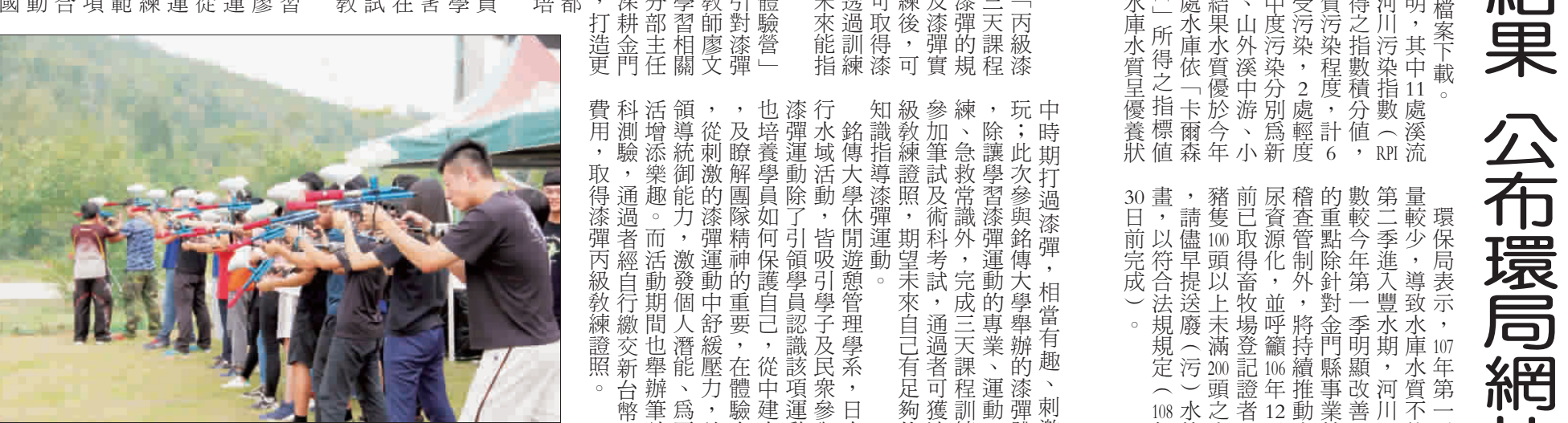
銘傳金門分部，首次辦理「丙級漆彈運動教練講習」，培養漆彈運動專業知能。

記者陳麗好／金沙報導 銘傳大學金門分部，首次辦理「丙級漆彈運動教練講習」，與學員於三天課程訓練中，歷經23小時的訓練，從漆彈的規則、運動營養學、運動傷害防護及漆彈戰術訓練等，學員完成三天課程訓練後，可參加筆試及術科考試，通過者即可取得漆彈丙級教練證書。與學員期滿後，可參加漆彈運動教練講習，指導漆彈運動。銘傳大學休閒遊憩管理系，昨日也進行水域活動，皆吸引學員及民眾參與。而漆彈運動除了引領學員認識該項運動外，也培養學員如何保護自己，從中建立自信及瞭解團隊精神的重要，在體驗中學習，從刺激的漆彈運動中舒緩壓力，並發揮活潑活潑的活力，激發個人潛能，為平淡生活增添樂趣。而活動期間也舉辦筆試、術科測驗，通過者自行繳交新台幣1000元費用，取得漆彈丙級教練證書。