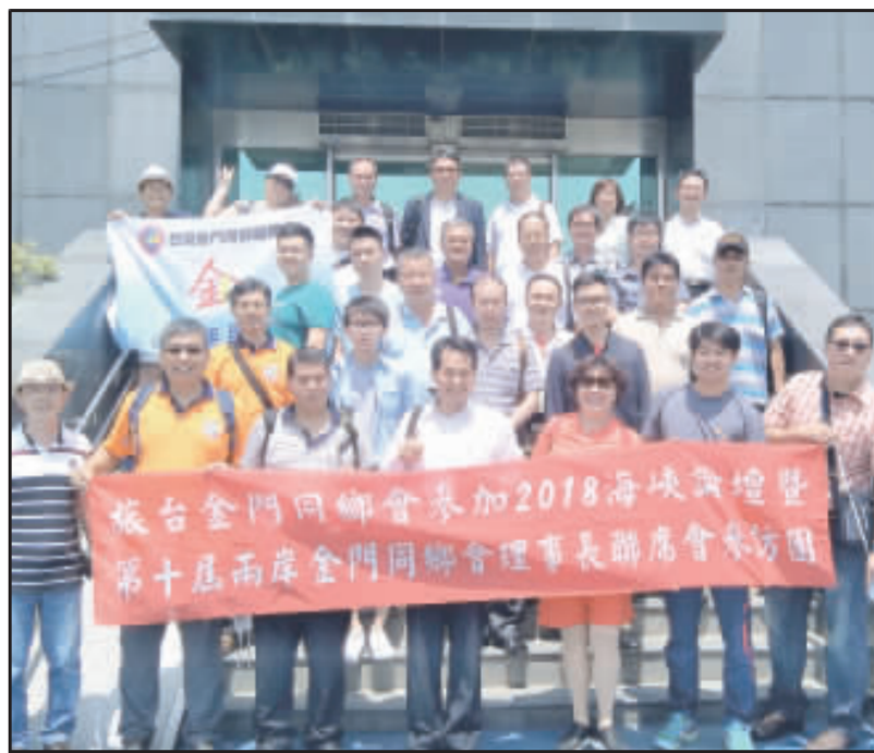
第十屆海峽論壇登場，台灣金門同鄉會總會組團跨海共襄盛舉。

第十屆海峽論壇6月4日於廈門登場，台灣金門同鄉會總會也組團跨海共襄盛舉，其中「關愛下一代成長論壇」5日上午於廈門賓館明霄廳舉行開幕式。