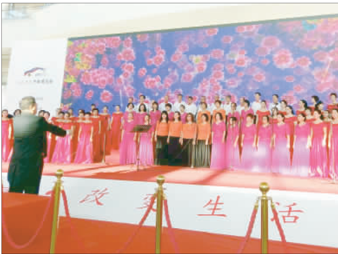
金門縣合唱團與鳳凰花合唱團、圓韻合唱團一起大合唱，展現兩岸音樂文化的和平與和諧。