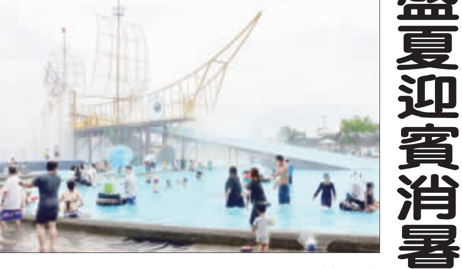
2018宜蘭國際童玩藝術節7日起至8月19日在冬山河親水公園登場，今年特別推出空中腳踏車「HiBike」，遊客需穿上護具背心，才能體驗在高空騎乘單車穿越水域。