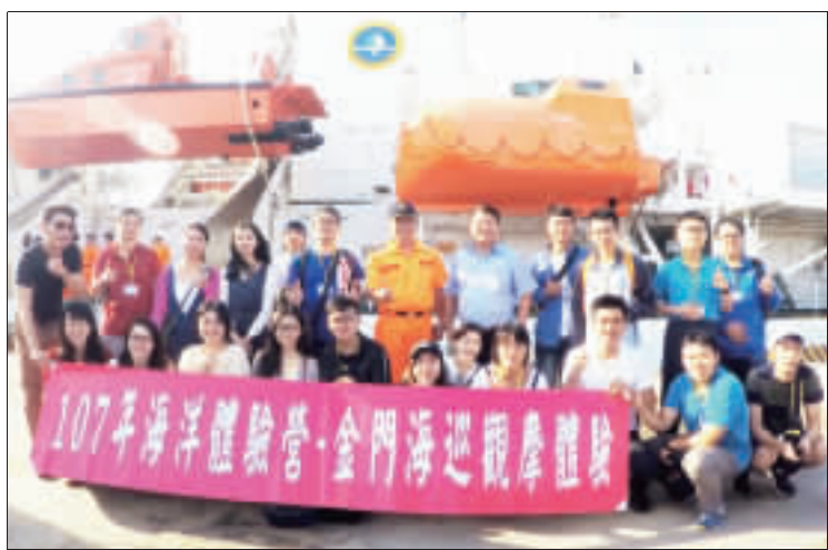
海巡署中部分署及金馬澎分署共同辦理「金門海巡觀摩體驗」，大專青年在三天兩夜的活動中，近距離觀摩海巡勤務，了解海、岸巡在海防第一線執法現況，體認海洋權益與保育之重要性。

記者陳麗好／金湖報導 海洋委員會海巡署今年再度規劃「107年暑期大專青年海洋體驗營」，4日至6日假金門地區辦理「金門海巡觀摩體驗」，大專青年搭乘100噸級苗栗艦往返金、澎、馬兩地，近距離觀摩海巡勤務，搭乘巡防艇至大膽島、烏礁島巡邏，深刻感受海、岸巡於海防第一線執法現況，也接受金門戰地文化洗禮，期藉以喚起青年學子守護海洋意識，及體認海洋權益與保育之重要性。 「金門海巡觀摩體驗」由海巡署中部分署及金馬澎分署共同主辦，與會大專青年4日下午2時許搭乘100噸級苗栗艦抵達金門水頭港，展開3天2夜的活動。在海巡署金馬澎分署第九岸巡隊引導下，實地觀摩海巡巡邏執勤情形，金門料羅商港拆檢貨物、水頭通關中心小三通勤務、新湖漁港安檢勤務等，搭乘巡防艇至戰地前線之大膽島、烏礁島巡邏，同時也走訪宮古樓、獅山砲陣地、馬山觀測所等並前往水產試驗所參訪，藉以了解海防第一線人員於海巡區域、深刻體認海洋權益與保育的重要性。活動於中午12時圓滿結束，學員也於水頭商港搭乘100噸級苗栗艦返金。 海巡署金馬澎分署第九岸巡隊表示，期藉以讓大專青年了解海巡署「護海專家」政策，彰顯國家主權，維護漁業資源，以及平時金門海域駐島之海巡人員執行擴大掃蕩越界捕魚之外籍漁船等勤務，展示海巡弟兄守護藍色國土的決心與能量，也期盼學員透過活動親身體驗感受海洋生態與海洋資源之珍貴與重要性，並能提升莘莘學子對國土疆域及海洋國家之意識與認同。