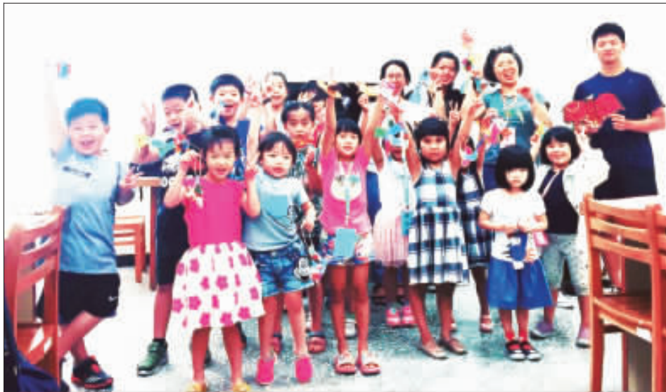
上、下：文化局、金沙圖書館合辦「金門閱讀島」系列活動，生動有趣的內容讓學子欲罷不能。

記者陳麗好／金湖報導 海洋委員會海巡署今年再度規劃「107年暑期大專青年海洋體驗營」，4日至6日假金門地區辦理「金門海巡觀摩體驗」，大專青年搭乘100噸級苗栗艦往返金、澎、馬兩地，近距離觀摩海巡勤務，搭乘巡防艇至大膽島、烏礁島巡邏，深刻感受海、岸巡於海防第一線執法現況，也接受金門戰地文化洗禮，期藉以喚起青年學子守護海洋意識，及體認海洋權益與保育之重要性。 「金門海巡觀摩體驗」由海巡署中部分署及金馬澎分署共同主辦，與會大專青年4日下午2時許搭乘100噸級苗栗艦抵達金門水頭港，展開3天2夜的活動。在海巡署金馬澎分署第九岸巡隊引導下，實地觀摩海巡巡邏執勤情形，金門料羅商港拆檢貨物、水頭通關中心小三通勤務、新湖漁港安檢勤務等，搭乘巡防艇至戰地前線之大膽島、烏礁島巡邏，同時也走訪宮古樓、獅山砲陣地、馬山觀測所等並前往水產試驗所參訪，藉以了解海防第一線人員於海巡區域、深刻體認海洋權益與保育的重要性。活動於中午12時圓滿結束，學員也於水頭商港搭乘100噸級苗栗艦返金。 海巡署金馬澎分署第九岸巡隊表示，期藉以讓大專青年了解海巡署「護海專家」政策，彰顯國家主權，維護漁業資源，以及平時金門海域駐島之海巡人員執行擴大掃蕩越界捕魚之外籍漁船等勤務，展示海巡弟兄守護藍色國土的決心與能量，也期盼學員透過活動親身體驗感受海洋生態與海洋資源之珍貴與重要性，並能提升莘莘學子對國土疆域及海洋國家之意識與認同。