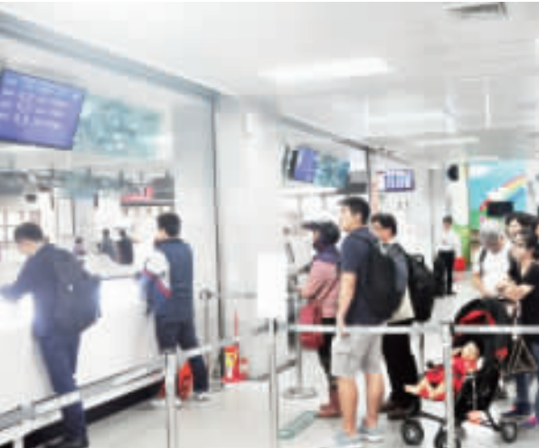
受瑪莉亞颱風來襲影響，台空中交通昨日下午二時後恢復飛行，搭機旅客到位置票。

記者李金鐘／綜合報導 受瑪莉亞颱風來襲影響，昨日金廈泉小三通航班昨日停航一天，台空中交通上午皆取消，直到下午二時後分別恢復飛行，下午各航班載客班滿，旅客都能順利抵達目的地。 昨日受瑪莉亞颱風影響，台金航班昨日下午部分航班停航，十一日上午各航班取消，直到下午二時後恢復正常，尚義機場也出現搭機人潮，遠東航空高旗往金門最先降落，隨後有遠東、台航、中興航空也隨後抵達，讓旅客有可乘。 金門航空指出，受瑪莉亞颱風影響，昨(11)日台空中交通上午皆取消，直到下午二時後分別恢復飛行，表示航班往返共94班次，三家航空公司共飛行廿班次，其他班次取消，直到下午二時後分別恢復飛行，幸好金廈泉小三通航班昨日停航一天，下午各航班載客班滿，但到六時許尚有空位，讓旅客都能順利抵達目的地。