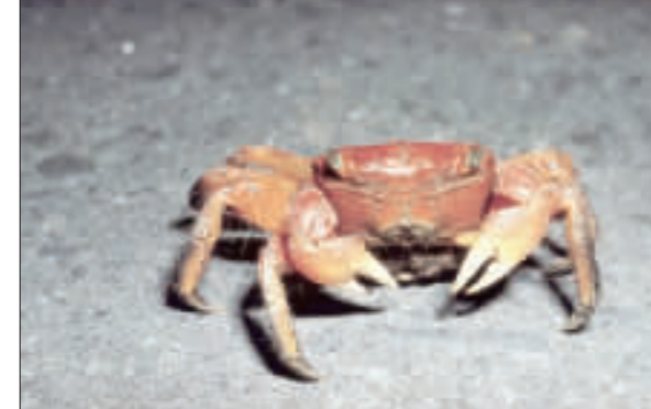
每年7月起至盛夏的大潮水期間，是墾丁陸蟹開始抱卵過馬路到海邊產卵的季節。圖為中型仿相蟹抱卵母蟹。

【中央社記者郭芷瑄屏東縣11日電】每年7月起至盛夏的大潮水期間，是墾丁陸蟹開始抱卵過馬路到海邊產卵的季節，墾丁國家公園管理處今年暑假期間舉辦三代同堂陸蟹生態之旅，擴大傳遞生態保育觀念。 墾管處解說教育課人員表示，墾丁國家公園的陸蟹有30餘種，以香蕉灣保護區及滿州鄉港口溪出海口一帶最多。每年7月至10月是母蟹過馬路(約農曆6月至10月)是母蟹過馬路到海邊產卵的季節，墾管處將在高峰期中秋節起至10月，於香蕉灣的台26線實施「護蟹過馬路」縮減車道措施，避免抱卵過馬路的母蟹遭來往車輛輾斃。 暑假來臨，為喚起民眾對陸蟹保育的關注，墾管處特別於7月28日和29日、8月26日和27日，在滿州鄉港口村舉辦「墾丁仲夏夜未眠，蟹蟹好孕」陸蟹生態之旅，墾管處表示，滿州鄉佳樂水吊橋至出海口一帶的陸蟹有以特殊外貌被稱為「一毛腿」的熟蟹蟹，蟹蟹的中型仿相蟹、奧氏後相蟹、一毛腿蟹及住在林投葉裡的林投蟹。