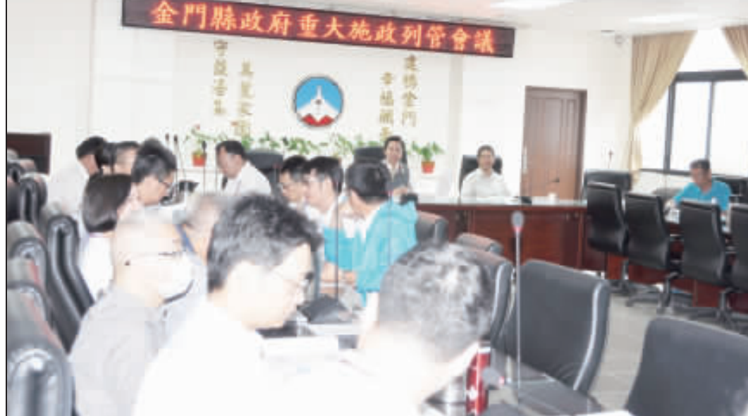
縣府重大施政列管會議 ▲縣長陳福海昨主持金門縣政府第27次重大施政計畫列管會議。

召開「城鎮之心工程計畫」競爭型計畫整體規劃及基本設計第8次審查小組會議時，本案也獲同意將配合第一階段前導計畫期程，優先集中資源挹注於「運動園區整體型計畫」上，不僅讓縣立體育場周邊運動設施公園化，也讓城區居住機能更趨完善。 至於接續生機與自然的環境空間，預算執行約1.5億元。目前計畫進度正常，實際進度14%。 另外，本案整體規劃及基本設計經中、央委員審查同意，已請規劃團隊配合建管作業規定修正基本設計，