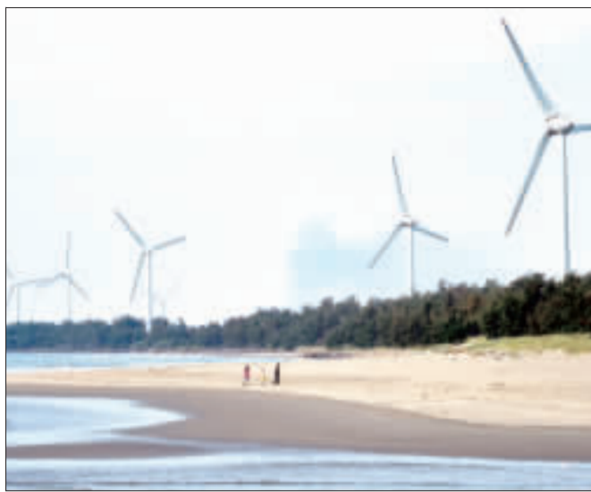
台灣政府積極規劃發展離岸風電，隨著第一階段核准容量陸續落地，風場建設工作也確實實質推進中。圖為位於苗栗後龍海岸的陸上風力發電機組。

【本報訊】財政部推動電子發票，但消費時店家常隨發票另印出優惠券，有民眾認為有違環保初衷，提案要求禁止或讓民眾自由選擇。財政部回應說，應回歸市場機制，由店家自律。 財政部指出，會議決議認為，商品優惠券或折價券，是商家對顧客提供的購物誘因，不屬課稅範圍，非財政部職掌，也非證明聯是用感熱紙印出，而感熱紙不能當作一般紙類回收，不利環保的疑慮。因此，有民眾在國家發展委員會公共政策網路參與平台的「提點子」提案，認為應在「電子發票實施作業要點」加入規範，禁止他種可選擇的印出商品優惠券。 提案者舉例，在自動提款機(ATM)的感熱紙也有商品優惠券，但都是選擇性的印出，為何隨發票印出的商品優惠券卻不可選擇性印出。 對此，財政部正式作出回應。財政部表示，針對此議題，行政院已於今年5月25日召開「開放政府第34次議題協作