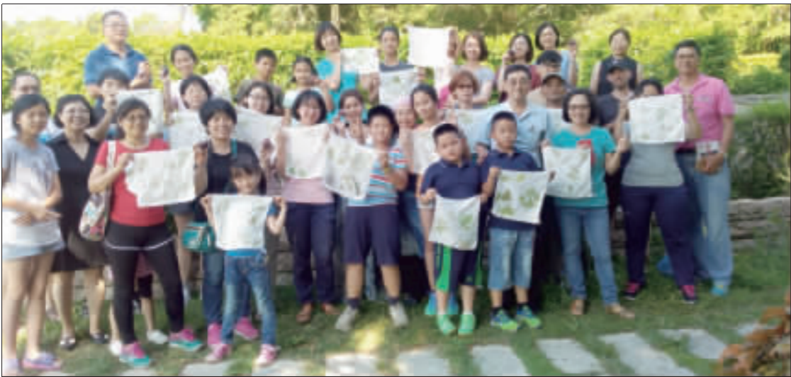
走讀植物染首日活動，參與學員大方展示作品並合照留念。