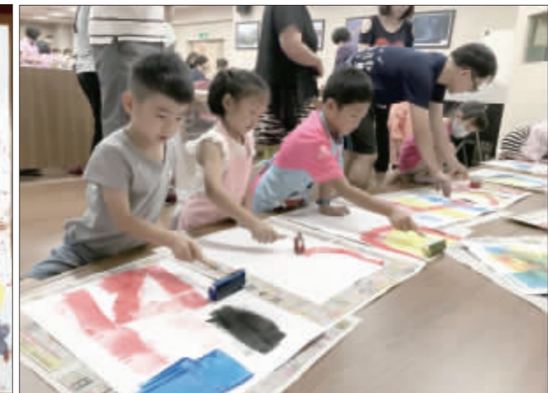
右、以各種顏料在紙張上進行拓印的活動，讓孩子們感到相當新奇有趣，同時更可以體驗親自動手做的樂趣；左、一親子DIY活動「施翠峰：一起玩拓印」活動中，透過拓印的方式讓小朋友們盡情揮灑創意，圖為小朋友作品。(文化局提供)