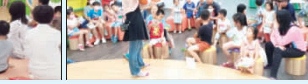
小朋友們在老師引導下手牽手互動，比出「旗魚王」的大小；右、假日故事屋說的是「旗魚王」的小故事，吸引許多民衆前來，親子同歡，一起聽老師說故事。

記者呂美慧／金寧報導 週日的假日故事屋是「旗魚王」，希望透過旗魚王的小故事來說明「人可以被打倒，但不可以被擊敗」的道理。現場小朋友除了仔細專注聆聽故事以外，更在老師的指引下，一起到台上手牽手比出故事中的「旗魚王」的大小，排列完成後，台下小朋友紛紛驚呼「好大呀！」現場掌聲不斷。