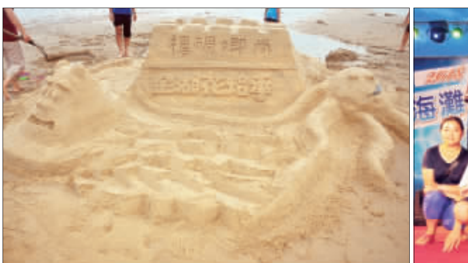
尚卿碉樓沙雕冠軍作品。

「沙灘比賽」第二名是「瓊林社區」隊，獲得2000元；第三名是「雅峰好正」隊，獲得6000元。