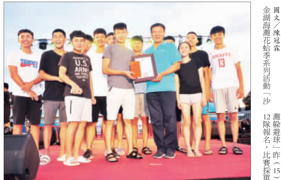
沙灘躲避球比賽，金中隊奪冠。

圖文／陳冠霖 沙灘躲避球比賽，今年共13支隊伍報名，最終由「叫你阿嬤」隊(如圖)拿下第一名，可獲得獎金5000元。該隊是由金大學生、軍人、社會人士等報名組成，他們是打排球認識的，平時就有在相約打球，能拿第一名感到很开心。其餘第一名「小島好正」隊，獲3000元；第二名「陽光火焰」隊，獲2000元；第三名「豆龍」隊，獲1500元；第四名「那不會倒的」隊，獲1000元；第五名「金門實習生」隊，獲500元；第六名「龍貓」隊，獲500元。