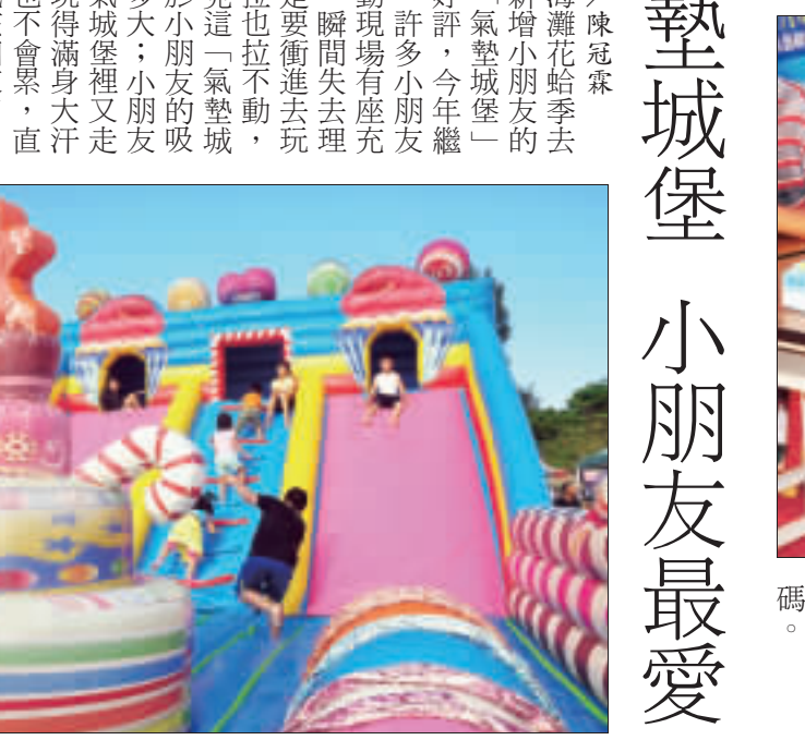
小朋友最愛氣墊城堡。

圖文／陳冠霖 金湖海灘花蛤季去年首度新增小朋友的最愛——氣墊城堡，廣受好評，今年繼續登場，許多小朋友看到活動現場有氣墊城堡，瞬間失去理智，家長拉也拉不動，其實可見這「氣墊城堡」對於小朋友的吸引力有多大。小朋友們在氣墊城堡裡又走又跳，玩得滿身大汗，一點也不會累，直到爸媽喊該回家了，還捨不得出來。這座「氣墊城堡」在花蛤季4天期間都會在成功海口廣場，爸媽可帶小朋友去「消耗體力」。