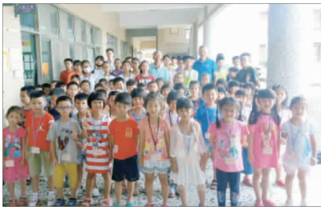
金沙鎮公所第12年辦理暑期「注音學習班」及「英文音標班」，百位轄內學子參與。

二年，已成為轄內一項扎根教育傳統，活動於7月12日開跑，共計有百位轄內學子參與。透過學校統一報名，計開設注音班3班及英文音標班2班，學子在鎮公所特設的專業教師帶領下，以小班制精緻教學方式，展開為期3週的先修課程，希望透過多元化活潑的方式，啟發新生學習興趣，順利銜接下來國小及國中階段的課程。