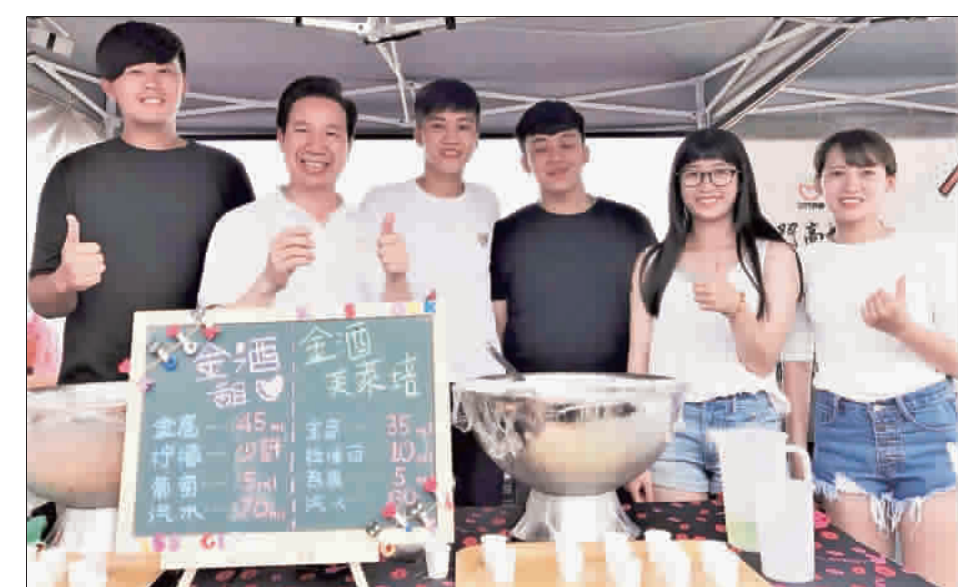
花蛤季開鑼了，下週將有調酒秀，歡迎民眾共襄盛舉。

記者許峻魁／綜合報導 自週六、日起，今(一〇七)年夏天裡，金門地區最令期待的暑假盛事「二〇一八金湖海濱花蛤季」活動已經展開了。金門酒廠預計在七月廿一日、廿二兩天的下午，在花蛤季的活動現場擺攤試飲，現場將有花式調酒提供民眾試飲。