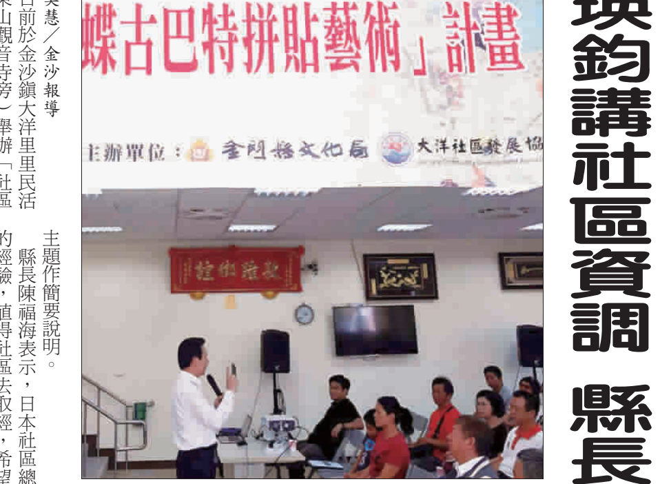
文化局日前於金沙鎮大洋里里民活動中心舉辦「社區資源調查方法與應用」社造基礎培力課程，縣長陳福海前往大洋里里民活動中心關心居民並說明此次主題。

記者呂美慧／金沙報導 文化局日前於金沙鎮大洋里里民活動中心舉辦「社區資源調查方法與應用」社造基礎培力課程，縣長陳福海前往大洋里里民活動中心關心居民並說明此次主題。 文化局日前於金沙鎮大洋里里民活動中心舉辦「社區資源調查方法與應用」社造基礎培力課程，縣長陳福海前往大洋里里民活動中心關心居民並說明此次主題。