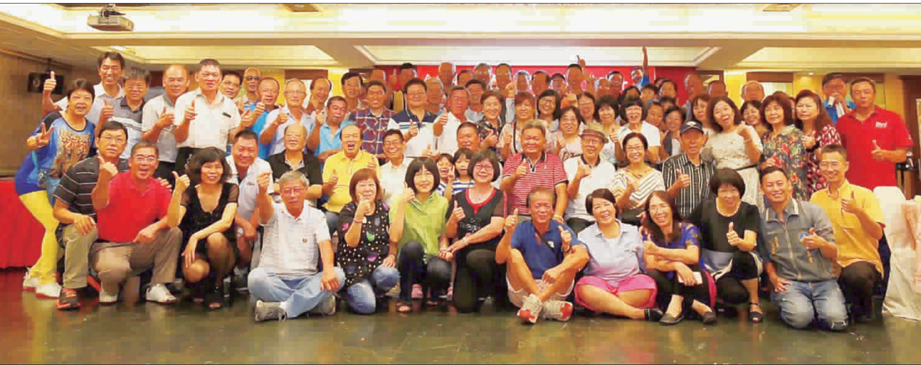
金寧國中第七屆畢業校友日前召開同學會，來自金門及台灣各地畢業同學齊聚台北市國軍英雄館，老同學們歡聚話當年。