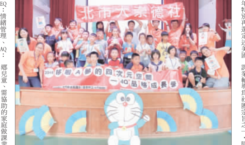
臺北市立大學崇德社13位社員與顧問，暑期再度到述美國小辦理4Q品格成長營，受到學子的喜愛。

記者陳麗好/金沙報導 品格才能呈現一個人的真正價值！臺北市立大學崇德社的13名社員與顧問，暑期時間在服務中學同時也推廣EQ品格精神，暑假再次到述美國小辦理「哆啦A夢的四次元空間4Q品格成長營」，大手攜小手在3天的活動中，引導小學生認識品格的重要，以建立正確的人生價值觀。