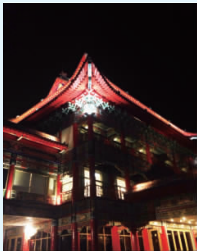
走在空無一人的路街 窸窣作響的樹葉漫過眼前 吹皺靜謐故鄉的風 很是淒切