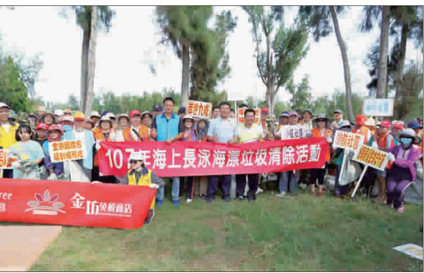
第16屆搶灘料羅灣海上長泳活動前夕，金湖鎮公所昨日舉辦淨灘活動。(陳冠霖攝)

冠冠軍「李子森」將帶來多首國語經典歌曲，以及國樂界美女團「皇朝樂團」悠然演奏。七月二十八日登場的「金夏星偶像」，將邀請情歌歌姬「梁文音」深情演唱，來自臺中熱烈的「王牌樂團」帶來精彩的組曲，以及超人氣「陳芳語」及「張力瑋」跨海首度合作演出。八月一日的「海島好彩鈴」，則請到高人氣的「蘇珮卿」與最佳演唱組合獎的「柯智棠」，以及入圍最佳國語男歌手的「柯智棠」，連串的小張懸之稱的新才女「詹森淮」將帶來「連串的現場演奏演唱創作。 八月四日登場的壓軸場「勁爆金曲夜」，則邀請重量級金曲台語歌后「詹雅雯」壓軸獻唱，實力派超唱將「朱俐靜」演出動感組曲，還有人氣超秀歌星「徐佳瑩」、「杜佳琪」共同演出，以及兩岸最受歡迎的電提「黃興與」互動秀。 除了重量級藝人外，還有2000金門流行舞蹈、金門大學藝術社、金門縣台灣原住民協會、娜魯灣舞蹈團、旅行社樂團、原住民族樂隊、胡待明、赤后樂團等金門在地團體參與演出。