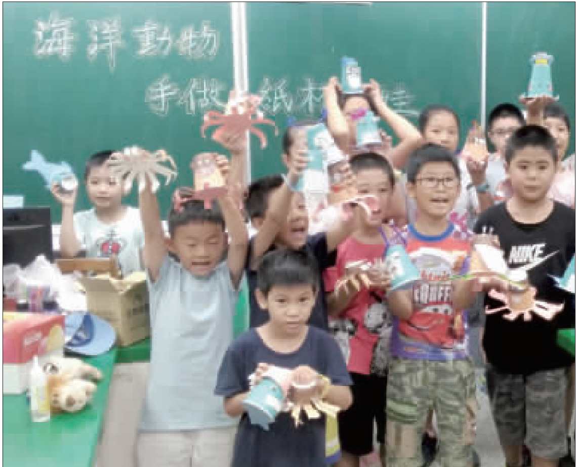
參與學童帶著自己製作的風力車進行競賽，都希望自己的風力車可以拔得頭籌搶先得第一。

記者呂美慧／金城報導 賢庵國小坡湖分校舉辦「2024坡湖夏日學樂」活動，希望藉由方式，讓孩子們在暑假中能有個玩樂的好去處，也能持續接受學校教育，體會做中學、學中做的樂趣。 賢庵國小坡湖分校，自104學年起，連續4年推出一日學樂活動，內容延聘學校特色課程，不僅將金門在地特色、科學及藝術學習融入其中，也廣泛閱讀金門文化素材，豐富學生的暑假生活。坡湖所規劃的夏日學樂課程在過去3年的教學模範賽中，更拿下一次全國優等獎、兩次全國特優獎。 教育部在104學年度鼓勵各校舉辦