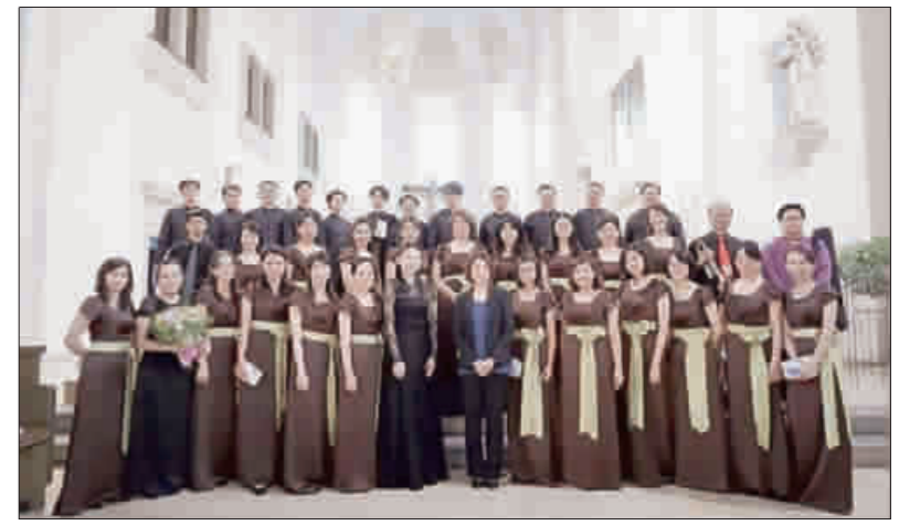
文化局將於本週六舉辦「因愛而唱2018粵語音樂會—祝福」,邀請愛唱歌手合唱團演出,歡迎民眾前往聆聽。

創嚴重昏迷,同行友人不知地點,求救無果,再到商家求救,最後由商家以手機撥打119電話報案送醫。 消防局表示,該局除原有的119報案系統外,另新增微信(Wi-Chat)報案系統,增加金門119受理陸客報案之方式,以有效增進陸籍旅客報案之便利性。微信(Wi-Chat)報案,於中國大陸下載次數已破億計,中國、大陸持有手機之陸籍民眾都有下載此軟體。透過此報案方式,讓消防人員更能迅速抵達事故現場,處理陸籍旅客緊急事故,讓陸客來金門旅遊就感受到有消防人員有如如守護神,隨時保護著你,更能有安全、安心、安定的保障。 消防局並說明相關下載方式,若你為蘋果手機用戶,請開啓手機之APP STORE選項,於搜尋欄中輸入Wi-Chat,按上搜尋,搜尋完成後下載Wi-Chat軟件,打開軟件後設立一組帳號密碼,完成後進入主畫面,掃描金門縣消防局(Wi-Chat)手機報案人型立牌看版QR-CODE加入報案群組(金門119,平安伴我行),若你為Android使用者,開啓PLAY商店,於搜尋欄中輸入Wi-Chat,按上搜尋,搜尋完成後下載Wi-Chat軟件,打開軟件後設立一組帳號密碼,完成後進入主畫面,掃描金門縣消防局(Wi-Chat)手機報案人型立牌看版QR-CODE加入報案群組(金門119,平安伴我行)。