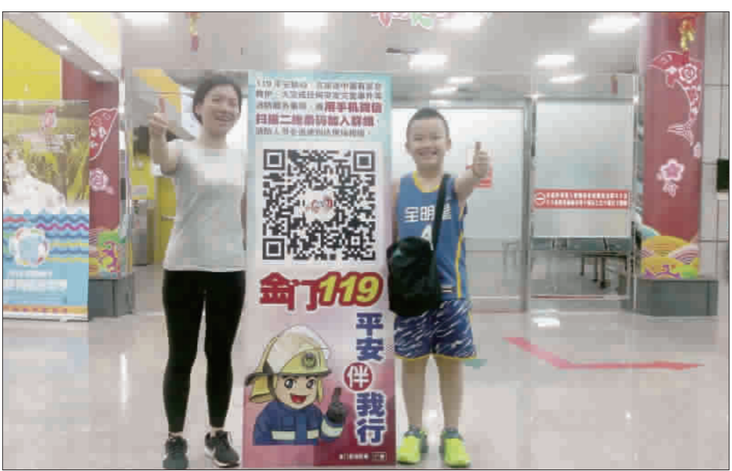
消防局將於本週六舉辦「因愛而唱2018粵語音樂會—祝福」,邀請愛唱歌手合唱團演出,歡迎民眾前往聆聽。

「金門119,平安伴我行」正式啟用,這項專為大陸旅客設置的微信(Wi-Chat)報案機制,由縣消防局在小三通水頭出口處布設,巨型醒目的報案人型立牌看版QR-CODE,讓遊客只要以手機掃描二維碼加入群組,上岸後即可獲得安全保護。 記者翁維智/綜合報導 「金門119,平安伴我行」正式啟用,這項專為大陸旅客設置的微信(Wi-Chat)報案機制,大陸旅客反應熱烈,稱讚是一項很貼心、讓人十分安心的措施。