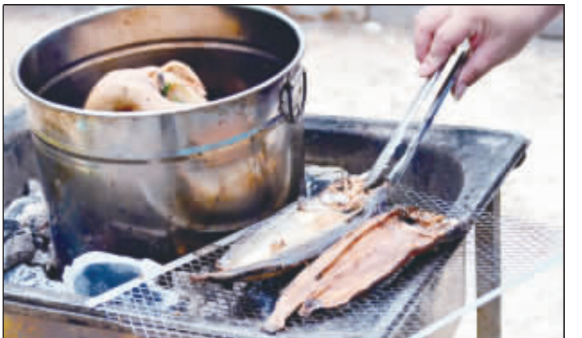
澎湖原住民文化促進會28日在原住民部落，以傳統歌舞祭儀，祈求祖靈庇佑族群平安，現場還能品嚐到傳統烤魚乾等家鄉美食。

【中央社台北28日電】交通部長吳宏謀日前接受中央社專訪時指出，交通部業務工作繁重，在聽取各單位業務簡報後，他覺得可以馬上做的就是全力推動綠美化，希望風景區道路能見到大片樹海及花海。 吳宏謀說，交通部業務包含陸、海、空及郵政、觀光、氣象等，工作非常繁重，安全、效率、品質、創新及永續等五大核心價值是未來施政主軸。 上任近兩週的吳宏謀已聽取所屬單位業務簡報，他認為有一件事可以馬上做的，就是加強綠美化。 吳宏謀說，目前國道及省道已有部分路段栽植有特色，但種的樹還不夠多，未來在重要國道路段、通往風景區道路，應該大量栽植，營造大片樹海、花海景觀，讓用路人心情更愉悅。 吳宏謀認為，綠美化除了提升整體環境品質，也有助空氣污染減量。