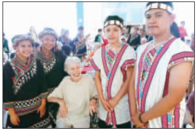
南投縣民和國中濁岸合唱團參加維也納世界和平合唱節，原定進聯合國機構演出遭取消，團員改去當地一家養老院獻唱，原住民美聲令長輩感動。圖為團員與養老院長合影。

【中央社台北28日電】因中國施壓，南投縣民和國中濁岸合唱團原定進聯合國機構演出遭取消，團員改去當地一家養老院獻唱，原住民美聲令長輩感動。圖為團員與養老院長合影。 【中央社台北28日電】因中國施壓，南投縣民和國中濁岸合唱團原定進聯合國機構演出遭取消，團員改去當地一家養老院獻唱，原住民美聲令長輩感動。圖為團員與養老院長合影。 【中央社台北28日電】因中國施壓，南投縣民和國中濁岸合唱團原定進聯合國機構演出遭取消，團員改去當地一家養老院獻唱，原住民美聲令長輩感動。圖為團員與養老院長合影。