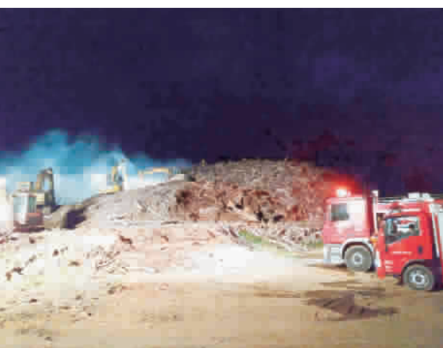
前埔教練場傳火警，消防局與各單位積極救災撲滅火勢。

金城盃籃球賽菁英組四強出列，今日將爭冠。昨日最後一場比賽，由汕頭大學迎戰臺灣師大，乙組冠軍的汕頭大學，對上甲組亞軍的臺灣師大，比賽開始汕頭大學展現分組冠的氣勢，第一節開始，汕頭大學維持領先優勢，第一節結束二十五比十五，汕頭大學暫時領先，第二節開始，汕頭大學再戰，人高馬大的汕頭大學，逐漸擺脫臺灣師大的防守，第三節結束，以五十四比四十，將領先分數拉開至兩位數，到第四節決勝期，臺灣師大把握幾波攻勢，在最後一分三十八秒時上演逆轉秀，終場以六十二比六十七，由臺灣師大獲勝。 今日賽程：上午十時，山東大學與中州科大。下午一時，金門州，山西大學與高師大。下午二時卅分，金酒與汕頭大學。