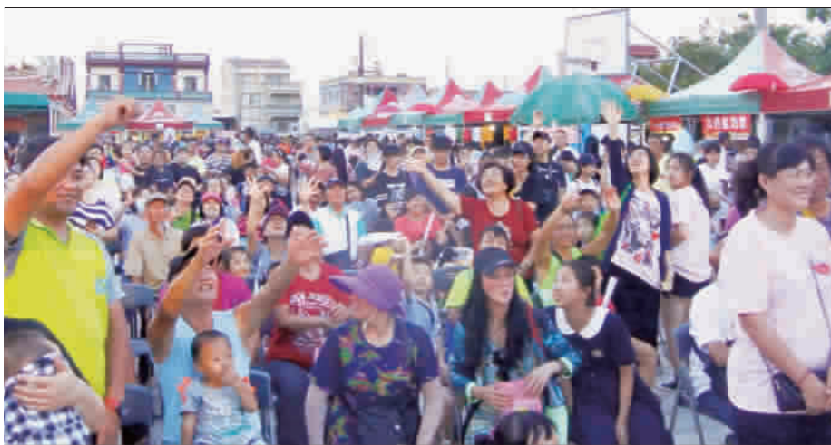
「第10屆新前墩西瓜節暨社區20週年慶」昨日登場：右、吸引不少鄉親前往參與，炎炎夏日台上參與吃西瓜比賽，十分消暑；左、縣長陳福海與與會貴賓一同切蛋糕（西瓜）揭開系列活動。

「第10屆新前墩西瓜節暨社區20週年慶」昨日登場，吸引不少鄉親前往參與，炎炎夏日台上參與吃西瓜比賽，十分消暑；左、縣長陳福海與與會貴賓一同切蛋糕（西瓜）揭開系列活動。 記者陳麗好／金沙報導 「第10屆新前墩西瓜節暨社區20週年慶」昨日登場，吸引不少鄉親前往參與，炎炎夏日台上參與吃西瓜比賽，十分消暑；左、縣長陳福海與與會貴賓一同切蛋糕（西瓜）揭開系列活動。 「第10屆新前墩西瓜節暨社區20週年慶」昨日登場，吸引不少鄉親前往參與，炎炎夏日台上參與吃西瓜比賽，十分消暑；左、縣長陳福海與與會貴賓一同切蛋糕（西瓜）揭開系列活動。