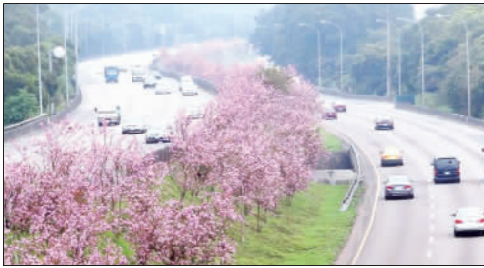
交通部長吳宏謀表示，目前國道及省道已有部分路段栽植有特色，但種的樹還不夠多，未來在重要國道路段、通往風景區道路，應該大量栽植，營造大片樹海、花海景觀。圖為國道3號三義路段中央分隔帶種植的羊蹄甲。

【中央社台北28日電】交通部長吳宏謀日前接受中央社專訪時指出，交通部業務工作繁重，在聽取各單位業務簡報後，他覺得可以馬上做的就是全力推動綠美化，希望風景區道路能見到大片樹海及花海。 吳宏謀說，交通部業務包含陸、海、空及郵政、觀光、氣象等，工作非常繁重，安全、效率、品質、創新及永續等五大核心價值是未來施政主軸。 上任近兩週的吳宏謀已聽取所屬單位業務簡報，他認為有一件事可以馬上做的，就是加強綠美化。 吳宏謀說，目前國道及省道已有部分路段栽植有特色，但種的樹還不夠多，未來在重要國道路段、通往風景區道路，應該大量栽植，營造大片樹海、花海景觀，讓用路人心情更愉悅。 吳宏謀認為，綠美化除了提升整體環境品質，也有助空氣污染減量。