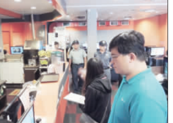
縣府暑期青春專案「聯合稽查小組」在金城地區的網咖、電子遊藝場、撞球場、KTV等青少年易聚集場所實施突擊稽查。

記者莊煥華／金城報導 金門縣政府為防範暑期青少年偏差行為，避免流連不當場所，自6月1日零時起啟動「暑期保護青少年青春專案」，結合教育處(含校外教育組)、建設處、社會處、衛生局、環保局、消防局及警察局等7個單位成立「聯合稽查小組」，加強防範青少年偏差行為，擴大預防犯罪宣導及淨化妨害青少年成長環境等三項重點工作，縣警察局長劉耀欽率領稽查小組在暑期期間應多關照子女，並提醒青少年朋友們要從事正常休閒活動，遠離不良場所、遠離毒品、拒絕危險駕駛，注意自身安全，過個健康快樂的暑假。 為帶給金門學子們一個安全健康的暑假，暑期青春專案「聯合稽查小組」針對青少年常出入之不當場所加強稽查，昨日在金城地區各網咖、電子遊藝場、撞球場、KTV等青少年易聚集場所實施突擊稽查；並告誡經營妨害青少年身心健康場所業者，不得僱用青少年當服務生及坐檯陪酒，亦不得在深夜時段容留青少年在場所內逗留，展現今年青春專案保護青少年暑期安全的決心，共查獲違反建築法等案件。 目標在淨化青少年活動空間，宣示掃除毒品、幫派、飆車等危害之決心，讓暑假期間家長都能放心、青少年都能平安。 因應暑假期間長，警局於7月7日在涇州陶藝坊舉辦「陶藝研習班」，另分局也各籌辦1場宣導活動，並將於8月14日起聯合校外會在金門縣金湖體育館舉辦「溫馨關懷弱勢學童暑期課後輔導」活動，鼓勵青少年踴躍參與健康、具學習效果的休閒活動，協助青少年正確休閒娛樂安心打工，向毒品說不，培養正確的人生觀。 縣警察局長劉耀欽表示，今年「暑期青春專案」執行時間自6月1日凌晨起至8月31日晚12時止，主要工作為防範青少年偏差行為、擴大預防犯罪宣導及淨化妨害青少年成長環境等三項防制重點，希望暑期期間應多陪伴關懷子女，增進親子互動與感情；另提醒青少年朋友們從事休閒活動時要謹慎選擇，遠離不良場所、遠離毒品、拒絕危險駕駛，注意自身安全，以免染上惡習及減少被警機會，過個真正健康快樂、平安幸福的暑假。