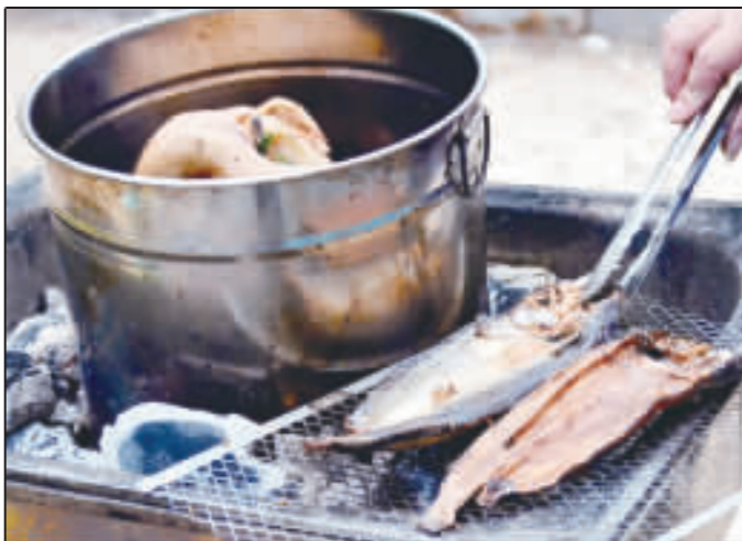
澎湖原住民文化促進會28日在原住民部落，以傳統歌舞祭儀，祈求祖靈庇佑族群平安，現場還能品嚐到傳統烤魚乾等家鄉美食。