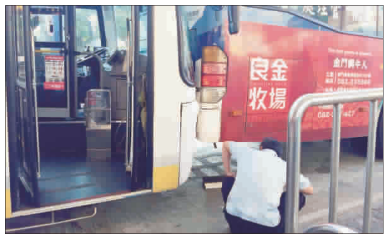
沙美公車站29日下午5時許發生公車司機被公車夾傷事件，警消獲報後到場處理，並將受傷駕駛送醫救治。

記者李金鎗／金城報導 金城鎮為加強推動「垃圾分類及源頭減量」工作，申請環保局補助廚餘桶1萬2千個，將自8月1日起至8月31日止，由里鄰長協助發放至各家戶。 金城鎮公所環保課表示，金城鎮今年自實施「垃圾分類」以來，鎮民配合度高，統計自今年1月至6月的廚餘回收量已達55.5公噸，成效相當良好，為鼓勵鎮民繼續推動各項資源回收工作，因此申請辦理家戶廚餘桶補助。 為使發放作業更加順暢，鎮公所特別召開協調會，由鎮長石兆璋主持，邀集各里里長及民政幹部研商作業程序，會中決議，廚餘桶發放以設籍金城鎮且實際居住者為限，以門牌為主，戶籍為輔，由各里里長依里民生活習性主導廚餘桶發放作業，請里長發放至家戶，務必做到各家戶均有發到，但也不能造成物質上的浪費！ 金城鎮廚餘桶領取資格以107年6月30日設籍該鎮，於發放作業時仍有戶籍者為限；發放作業時間以107年8月1日起至8月31日止。 鎮長石兆璋邀集各里里長及民政幹部研商廚餘桶發放作業。