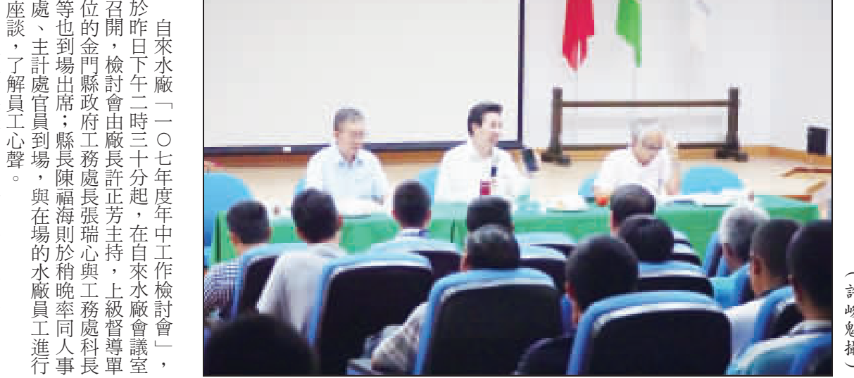
水廠召開年中檢討會，縣長陳福海出席。