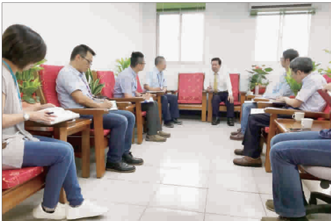
縣長陳福海於昨日上午8時10分親自參與工務處每週召開之處務會議。

大樓的配置情況，並能直接與經營者對談其經營理念與特色，未來於各鄉鎮規劃的綜合服務大樓，也要創造各自不一樣的特色，以吸引鄉親使用。另外對於地區的道路拓寬，應該不是只有硬性的將道路拓寬而已，近年來道路兩旁的植栽景觀塑造，經過縣長的協調，也可與林務所間有了很好的默契，形成了很多很好的道路景觀，同時也將林務所相關公共建設，要能掌握施政的節奏與時機點，對於相關建設或工程的招標，縣長也希望建立一套優良廠商評鑑的制度，而透過這樣的制度去選擇到好的廠商，有好的廠商才會有好的設計構想及施工品質，而工務處同仁則提供工程專業上之想法，只要各同仁想做而且不違法的前提下，即使做錯了也沒關係，縣長都會支持的。最後縣長陳福海也勉勵要以同理心推動後續業務。