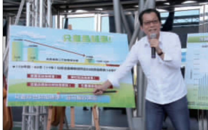
環保署長李應元1日表示，空污法防制法修正案即將頒布實施，對於外界說傳老舊車輛將被強制淘汰一事，他強調新法「只取締烏賊車，不取締老舊車輛」，只要車輛符合標準，都可以上路。(中央社)

【中央社嘉義市1日電】環保署長李應元今天表示，空污法防制法修正案即將頒布實施，對於外界說傳老舊車輛將被強制淘汰一事，他強調新法「只取締烏賊車，不取締老舊車輛」，只要車輛符合標準，都可以上路。 環保署長李應元1日表示，空污法防制法修正案即將頒布實施，對於外界說傳老舊車輛將被強制淘汰一事，他強調新法「只取締烏賊車，不取締老舊車輛」，只要車輛符合標準，都可以上路。 李應元說，新修正的空污法防制法於6月25日經立法院三讀通過，對於工廠及電廠等固定污染源、機車及柴油車等移動污染源管制強度及排放標準都予以提高。 李應元指出，空污法修正案通過後，外界以訛傳訛，很多人因此擔心老舊車輛將被禁用、將被強制淘汰，其實「只要車輛符合標準，都可以上路」，並沒有取締老舊車輛問題。 他說，對於20萬以上的都會區，由於街道上人多，為了人民健康，環保署會加強稽查二行程機車；至於鄉下地方如嘉義縣、雲林縣、台東縣、花蓮縣等人口未超過20萬人的鄉鎮，空氣品質相對較好，基本上會用宣導方式補助，將持續到明年年底；至於民國92年底以前出廠的機車排放標準，仍以16年前實施的標準，也就是CO 2 、HC、200ppm，「只要正常保養、符合排放標準，依然可以繼續行駛」。 他說，外界謠傳環保署將強迫淘汰10年以上老舊機車，這絕非事實，希望謠言止於智者，環保署支持古董機車在文化保存上的意義，後續將會對於古董機車規劃相關管理機制。