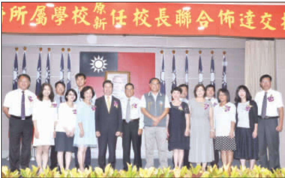
金門縣政府所屬學校8位原新任校長昨佈達交接，交接典禮後，縣長分別與退休校長(左圖)和新、續任校長(右圖)合影。

記者翁維智／縣府報導 金門縣政府昨日上午9時在縣府多媒體簡報室舉行所屬學校原新任校長交接典禮，由縣長陳福海布達任命並擔任監誓人，主計處處長王真龍擔任監交人。 此次新任校長計有林水進、陳佩玉、許雪芳、薛奕龍、李盈潔、黃明森、蔡雪芳、曾秀玲共8位；續任校長則包括許維民、陳雅蘭、陳來添、孫麗琪、張志猛、劉界宏、余鳴共7位。 陳福海致詞時表示，4年來，縣府對教育的投資達10億，感謝校長和老師的用心和付出，讓我們看到金門教育的競爭力，尤其教育也是金門的希望工程，幾位卸任校長的傳承和努力，不僅創造了個人工作崗位的價值，也圓了人生的教育夢。 陳福海也說，從政以來，他一直很珍惜鄉親給他機會，也把所有時間都奉獻在這個島嶼，為了圓自己的金門夢，一路走來，他目標清楚，更30年如一，不忘初心，對於教育的投資，也在教育處全體同仁的打拚下，逐一的把施政的優先順序一一架構和執行。 話鋒一轉，陳福海強調，政治人物最需