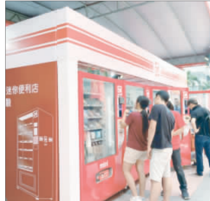
OK mart響應電子支付政策，自今年6月初發布OK mini迷你便利店，提供電票、電支、信用卡以及國際三大PAY超過20種的無現金感應支付後，目標3年全台裝設達5000台。(中央社)

如果要成為夾娃娃機的場主，業者表示，首先需找好店面、機台，然後至店面所在地縣市政府辦理登記證等相關手續，並至當地稅務局進行稅務登記後，就可邀請其他人員分租機台，也就是擔任所謂的「台主」；場主可以透過租金盈利，而台主則是透過來客每日所投入的現金賺取，以及調整機台來取的。 至於目前民眾發現基隆廟口夜市出現擺放龍蝦、沙公等活體生物的夾娃娃機，或成龍蝦、沙公等活體生物的夾娃娃機，不代表沒有虐待動物的事實，民眾仍應依社會秩序維護法檢舉。(中央社)