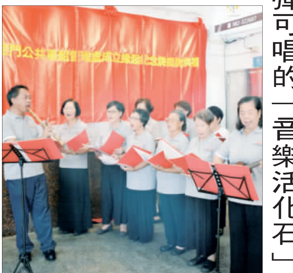
圖為塔后鎮公所舉辦的積木、樂高機器人體驗營活動現場，多位家長陪同子女參與，場面熱鬧。

記者呂美慧／綜合報導 文化局為落實推動金門閱讀島，積極促進民眾養成閱讀習慣，同時推廣閱讀、深化金門在地民眾之閱讀能力，將於今日下午2時至4時在塔后活動中心舉辦「積木、樂高機器人體驗營」活動，邀請民眾一同參加體驗營，活動將以在地社區居民2人一組為主，歡迎踴躍前往，一起走入社區，邁入閱讀新世界！