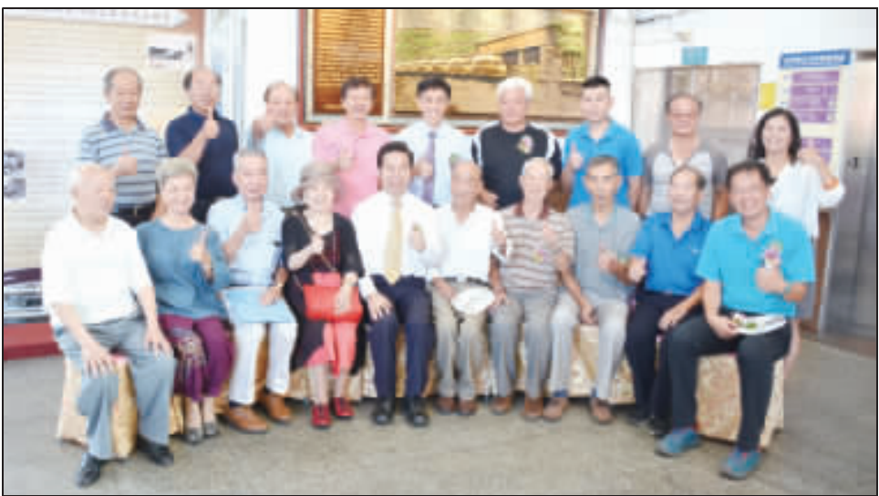
金門縣長陳福海(左五)與民營金門汽車客運原始股東代表、員工在紀念牌前合影。

記者楊水冰／金城報導 金門縣公共汽車管理處成立緣起紀念牌揭牌典禮於昨(三)日在金城車站大樓舉行，由金門縣長陳福海和與會貴賓、代表共同揭幕，感念六十年前「金門汽車客運股份有限公司(民營客運)」和業者對金門交通運輸改善的奉獻，也選原一段鮮為親知親見的民營客運史實及一個公道，陳縣長也代表車船處和鄉親表示感謝及感念，肯定民營客運業者對金門交通發展的貢獻；而當民營客運業者家屬說，這一段親不知的歷史能有美好結局，相信先人會感到自豪及欣慰在天之靈！