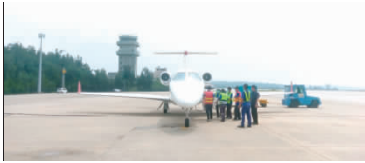
右、金門緊急醫療專機2日上午執行第一趟後送病人赴台灣的任務；左、縣長陳福海親赴金門醫院關心個案，並指示金門醫院與衛生局全力協助。

記者陳冠霖／綜合報導 自7月27日起正式駐地金門的緊急醫療專機，2日上午執行第一趟後送病人赴台灣的任務，飛機於5:50自尚義機場起飛，2:55降落松山機場，並順利將病人安全送抵台北榮總，後送時間相較過往使用直升機，節省一半以上飛行時間。 金門縣衛生局表示，本縣緊急醫療專機於7月27日中午12時正式駐地，2日上午進行首位緊急醫療後送案例，縣長陳福海親赴金門醫院關心個案，並指示金門醫院與衛生局全力協助。 衛生局表示，本案於2日上午5:50自金門尚義機場起飛，2:55降落台北松山機場，並順利將病人安全送抵台北榮總醫院，轉送時間相較過往使用直升機，節省一半以上飛行時間。據了解，該後送病患是日前於榜林園環發生車禍之傷者，其傷勢雖穩定，但為確保安全起見，仍先後送至台灣，以利後續治療。