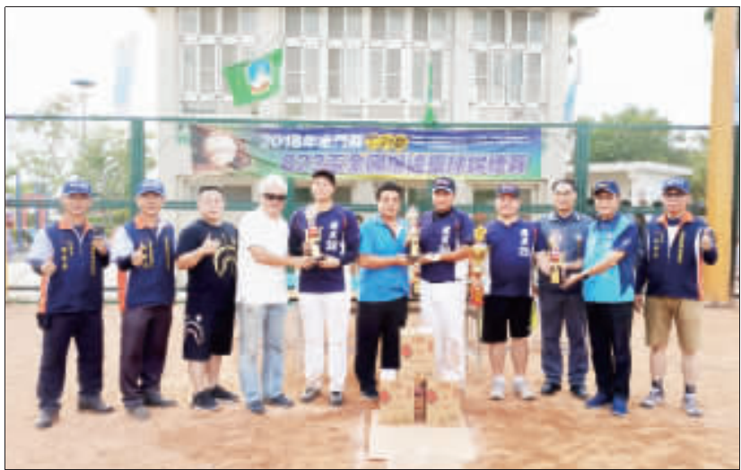
左、金門砲戰組冠軍隊伍「礁溪」與貴賓合影；右、獲得總冠軍與823砲戰組冠軍的隊伍「福興」，與貴賓合影。