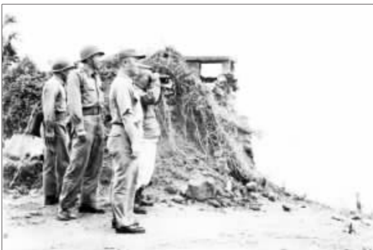
▲民47.7.24國防部俞大維部長於大膽島北山海灘偵察砲陣地。

47年8月23日爆發的金門砲戰，迄今已60年，在慶祝砲戰勝利60週年的今天，我們絕不可忘記砲戰英雄陸志家上校及這一群在大二膽島上浴血奮戰堅忍不拔的英勇戰士！