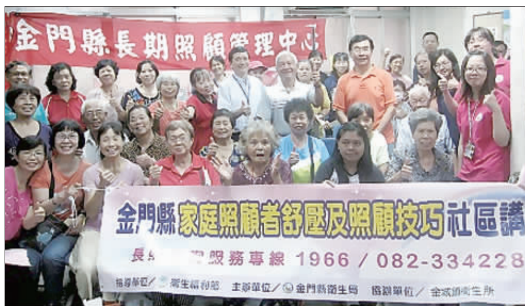
金門縣家庭照顧者舒壓及照顧技巧社區講座，由金城鎮衛生所主辦。

「金城鎮社區失智服務據點」也舉辦「後浦學堂」懷舊年冬的認知促進及緩慢失智方案活動，受到許多長者歡迎與參加。金城鎮衛生所表示，長照是新政府服務長者的重要課題，而且許多照顧長者的服務，都是縣政府可以做的社福社政工作，不管是失智還是失能，都是要加強照顧的地方，做保健也防止失能與失智，著重預防。