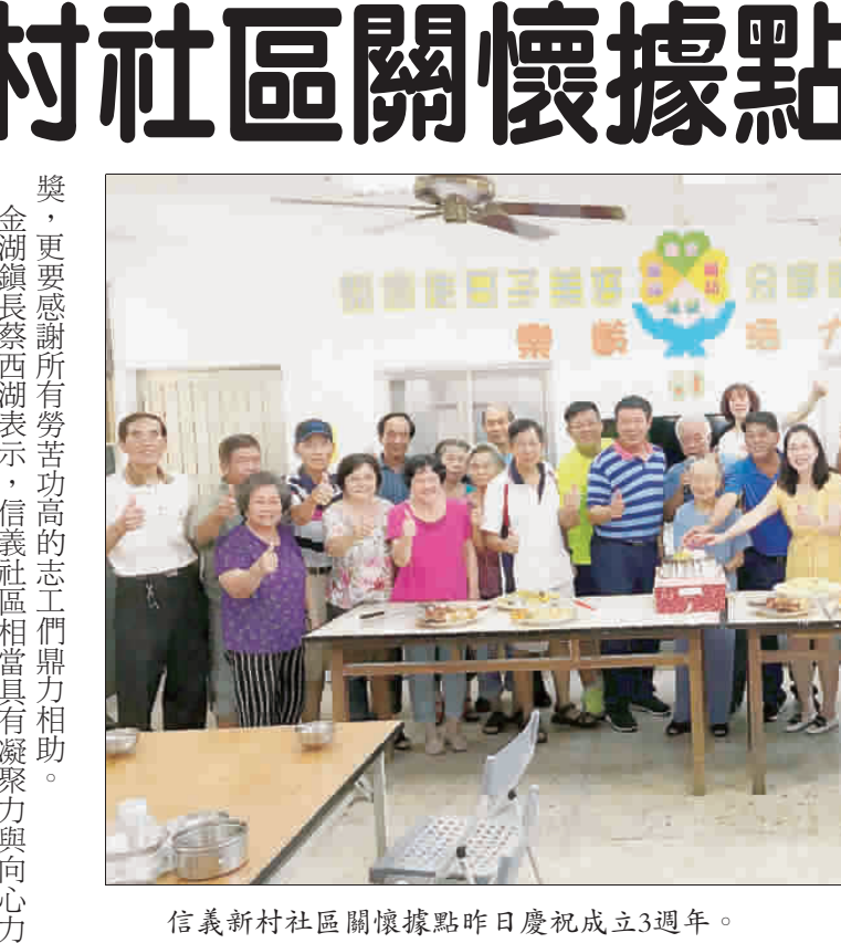
信義新村社區關懷據點昨日慶祝成立3週年。

農委會主委金日率員來金召開協調會 計2,000公頃，處理民眾通報紅火蟻128件及辦理烈嶼地區外防防治2次，並已於7月6日完成第一次防治工作計2,000公頃。 農委會副主委委員黃金城率領農委會副主委委員陳宏博、林德恭、黃詩敏、黃海東、組長陳宏博、科長李昆龍及技正黃詩敏、並偕同防部及金防部相關人員先就紅火蟻防治工作進行會談，期能擴大地區紅火蟻之防治範圍，加強軍事營區紅火蟻之防治工作，減少紅火蟻之防治經費。 縣府指出，本縣106年辦理入侵紅火蟻防治工作，計發放誘餌防治站3,000公頃，並於11月雇用桃園紅火蟻防治隊4人，發放防治誘餌劑防治站157,200公頃，另處理民眾通報入侵紅火蟻防治工作防治次，107年1-8月辦理入侵紅火蟻防治工作防治