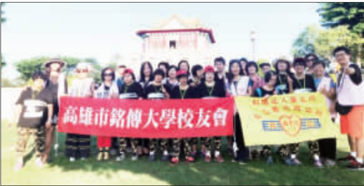
銘傳校友助義光院生金門圓夢之旅，一圓院生多年來的希望。