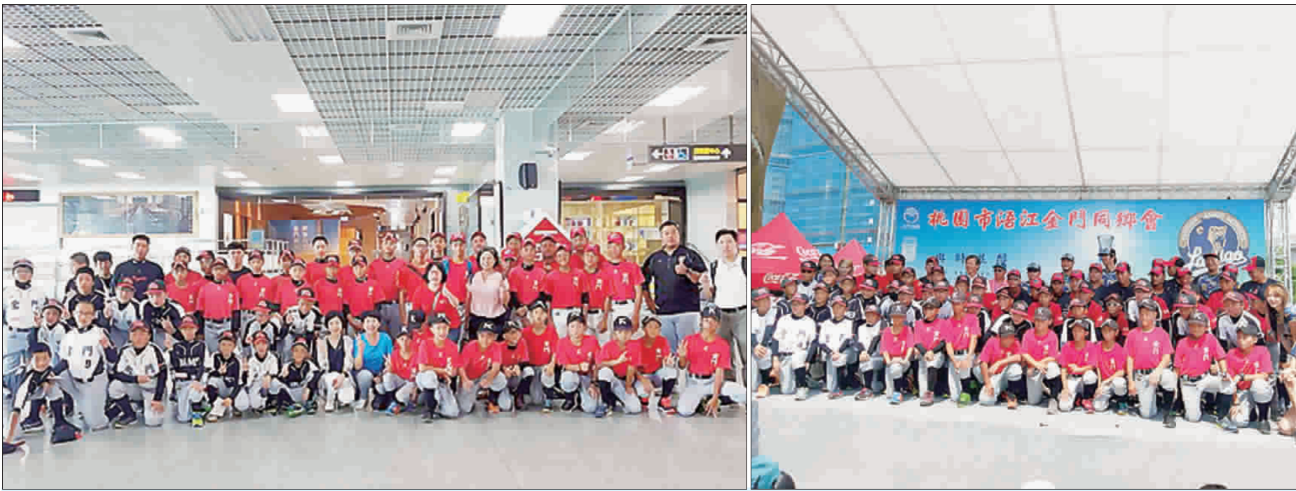
左、本縣三級棒球隊受邀桃園參與「桃園金門日職棒嘉年華」，行前於尚義機場大合照；中、活動現場，球員與秘書長林德恭、桃園市金門同鄉會理事長李仁雄、Lamigo球員和Lami girls合照；右、縣長陳福海也趕往「桃園市金門日」活動現場共襄盛舉。