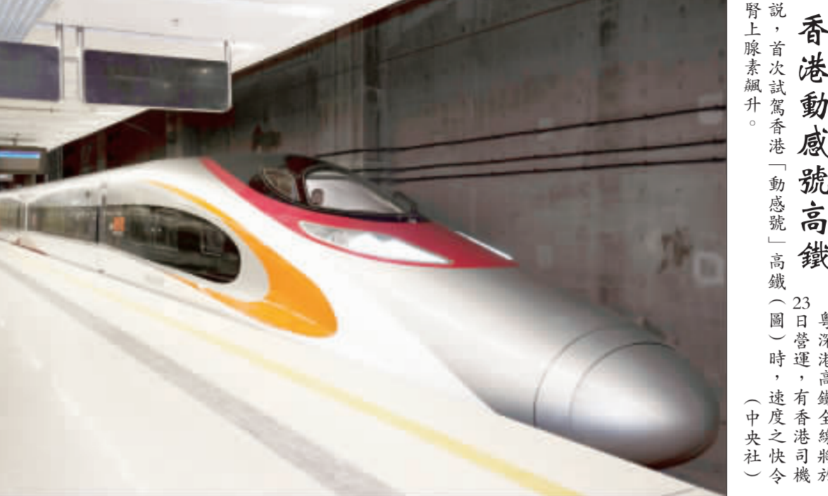
香港動感號高鐵 粵港高鐵全線將於23日營運，有香港司機說，首次試駕香港「動感號」高鐵（圖）時，速度之快令腎上腺素飆升。（中央社）

外媒分析，美國總統川普對中國祭出關稅大旗，無意間促成中國與日本的關係回暖，但由於兩國源於歷史積怨和領土爭端的一世仇關係，這種恢復注定有限。 新華社報導，第7次中日財長對話在北京舉行。中國財政部長劉昆和日本副首相兼財務大臣麻生太郎攜雙方財政部、央行及金融監管高級官員出席，展開面對面對話交流。 綜合英國金融時報和法國國際廣播電台中文網報導，昨日的會談是兩國多年緊縮關係解凍的最新跡象，會談的象徵性價值大於實質性。 報導說，中日關係因歷史積怨和釣魚台主權爭議，多年來始終在低點徘徊，但隨著川普今年升任與中國的貿易衝突，北京試圖在幾個月內緊急修復忽視多年的中日關係。 在北京有意為之之下，中國國務院總理李克強5月時展開20年任內以來的首次日本行；此前一個月，兩國還舉行了近8年來的首次高層經濟對話。 另據日本共同社，中日兩國基本達成共識，日本首相安倍晉三擬於10月23日抵達北京訪問。這是除了出席國際會議場合，近7年來日相首次訪中。 金融時報說，中日友好關係的恢復將受到歡迎，但恢復注定的有限。 雖然如此，金融時報認為，東京最好充分利用與北京的關係回暖，因為此舉有助於提升整個亞洲的安全；同時也希望北京修復對日關係並非政治上的權宜之計，而是有連貫性地與日本保持交流溝通，因為中方過去5年若採取後一種方式，如今就不必如此費力去修復關係。（中央社）