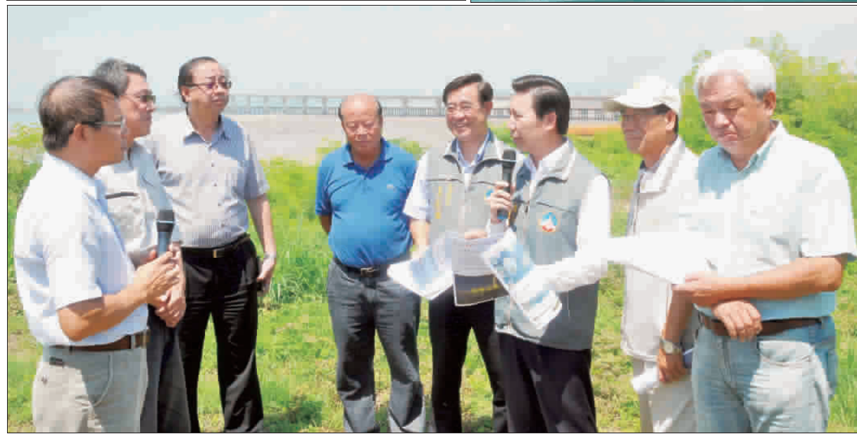
會中首先聽取交通部高速公路局工程執行簡報，簡報指出，金門大橋(CO-2)標續工程於105年12月28日開工，截至107年8月31日工程累計預定進度21.67%，累計實際進度2.23%，微幅落後1.8%。