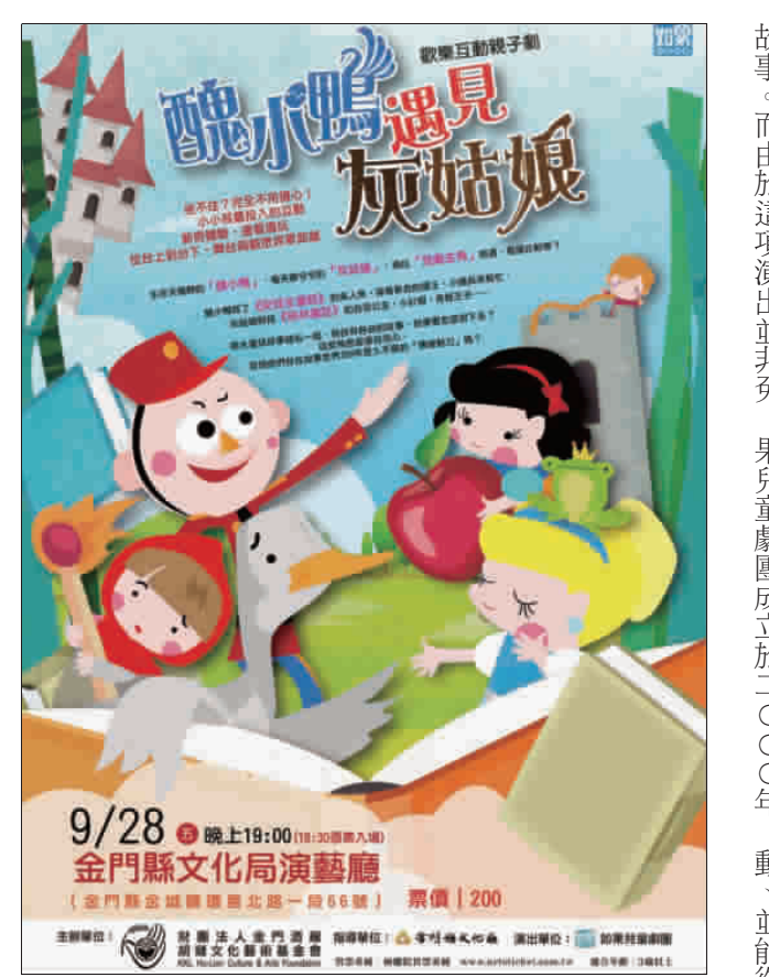
《醜小鴨遇見灰姑娘》將於九月二十八日(星期五)晚上七點起(20:00)開放入場，於金門縣文化局演藝廳演出，歡迎有興趣的民衆踴躍購票參與，機會難得。

記者許峻魁／金城報導 費觀賞，有興趣鄉親必須購票進場。 由金門酒廠胡連文藝術基金會主辦的「二〇一八親子劇場」，邀請人如果兒童劇團帶來《醜小鴨遇見灰姑娘》(如圖)，定於九月二十八日晚七時假金門文化局演藝廳演出，歡迎全家一起來觀賞這經典的童話故事。而由於這項演出並非免費，有興趣鄉親必須購票進場。 如果兒童劇團《安全新舞台》劇《醜小鴨遇見灰姑娘》，劇中華麗舞臺、奇幻魔法變身、可愛逗趣的人物演出，讓景觀的大小觀眾感動驚喜！建議觀賞年齡為三歲以上。如動、並能從中學習，進而開發孩子的無限潛能。 《醜小鴨遇見灰姑娘》將於九月二十八日(星期五)晚上七點起(20:00)開放入場，於金門縣文化局演藝廳演出，歡迎有興趣的民衆踴躍購票參與，機會難得。胡連文基金會提醒，注意，本活動除了提供50張票券供清潔弱勢人士申請外(憑清寒、低收入證明，每人兩張為限)，一般民衆購票(20元)進場。購票請上兩廳院售票系統。