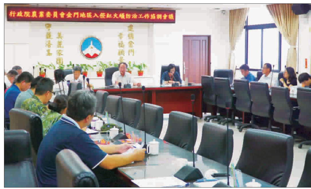
農委會副主委來金召開紅火蟻防治會議，討論如何積極降低紅火蟻侵擾發生率。

記者許峻魁／金城報導 紅火蟻攻擊性極強，入侵金門後即有擴散，因此防治紅火蟻刻不容緩，行政院農業委員會4日下午，由農業委員會副主委黃金城來金召開「入侵紅火蟻防治工作跨部會協調會」，透過中央地方各單位共同商議，一起研擬防範辦法，期望能在防治工作後，將發生率再降低。 行政院農業委員會是於九月四日的下午一時三十分左右，在金門縣政府第一會議室，召開「入侵紅火蟻防治工作跨部會協調會」，這項會議是由農業委員會副主委黃金城擔任主持人，並邀集動植物防疫檢疫局局長馮海 城、擇日來金就紅火蟻防治工作在金門舉行協調會，因此才有此次的會議召開，希望透過此次會議，期望能擴大紅火蟻之防治範圍，加強軍事管區紅火蟻之防治工作，減少紅火蟻之防治死角。 農業委員會副主委黃金城表示，紅火蟻是外來種，因為對民衆生活造成很大困擾，所以希望能夠有效控制，不管理是在今年度或是明年度，農委會已經向行政院爭取到幾千萬的補助，專門針對紅火蟻處理，而根據相關數據來看，金門地區紅火蟻發生從七月三日到四成五左右，若能持續有效降低至百分之十以下，基本對於民衆生活的影響性就會比較小一些，除了農地以外，金門很多廢棄軍營也比較不好處理，這方面也有做一個全面統計，中央紅火蟻防治中心也會提供協助的。 防務所說明，金門從去(一〇六)年開始辦理入侵紅火蟻防治工作，總計投放誘餌防治有四百三十五公頃，並於去年十一月僱用桃園紅火蟻防治隊四人投放餌劑來防治烈嶼地區共一千兩百七十九公頃，另處理民衆通報入侵紅火蟻防治，計一百五十七次。而今年一至八月辦理入侵紅火蟻防治工作，計有三千三百六十一公頃，處理民衆通報紅火蟻一百二十八件以及辦理烈嶼地區外防治一次，並已於七月六日完成第一次防治工作。 而根據防務所委託國家紅火蟻防治中心協派偵測人員調查紅火蟻之發生情形，雖發生率經防務所投入防治後確有明顯效果，但發生率仍是偏高，加上紅火蟻繁殖力強(蟻後壽命五至七年，每日可產卵一千顆，成熟蟻巢平均每年可以產生四百五十隻新的蟻後)，一旦入侵後，單靠防務所人力依舊有死角，且防治效果會受溫度及雨水等天候影響。 此外，近期也接獲多起民衆因受紅火蟻叮咬咬傷之事故，因此縣長在八月初緊急召開入侵紅火蟻防治會議，會中指示動用災害準備金支應相關防治所需經費，經防務所研擬防治計畫總計需八百萬元採購餌劑、灑佈機、租賃車輛及研擬協同林務所支援人力及防務所人員約二十五人，預計在九月十五日起，利用星期假日加班，預計用二十個工作天，預估可增加防治面積四千公頃，加強擴大防治力道，而防務所也將研擬分送鄉鎮公所方便民衆就近領用。而目前的防治策略，除持續投藥來減少其密度外，還需軍方及鄉親如能在軍事管區、田間或戶外活動時發現紅火蟻立即進行施藥或通報防務所，則紅火蟻之防治工作將可事半功倍，並可降低民衆受叮咬的風險。 四日的會中，針對軍管區紅火蟻防治問題，國防部與金防部同意協同辦理軍事管區紅火蟻之監測及防治工作，並請防務局安排教育訓練、紅火蟻防治中心提供宣導影片、海漂垃圾及堆置站之監測與防治等多項決議，期望能擴大紅火蟻之防治範圍，加強軍事管區紅火蟻之防治工作，減少紅火蟻之防治死角，以維護生態環境、農業生產與民衆之健康安全。