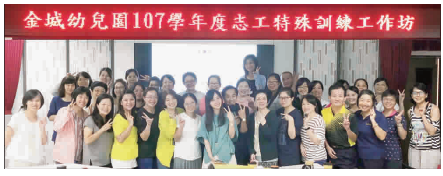
城幼志工特殊訓練工作坊，邀請專家為推動閱讀的志工們增能。

記者唐宗翰／金城報導 金城幼兒園推動閱讀，希望因閱讀而深化家庭成員間的關係。日前，園方邀請在生活寫作及親子教育上具知名度的二位老師，為志工們增能，期望能激發新的思維和做法。 讀已是萬幸，但須進行學習單的呈現時卻是令人卻步的。因此為了志工們的需求，日前城幼聘請了生活寫作及親子教育非常著名，並入選「遠見天下」未來教育、台灣「一百」、「亮語文創教育」的創辦人彭瑜亮老師，期望閱讀與寫作在親子關係上有不同的視野與想法，且更有不同的引導及呈現方式。 彭瑜亮老師的親子講座主題是「讓孩子犯錯」。講師散發風趣的魅力，透過音樂、短片、真實案例、經典的亮語，讓現場志工家長們無一不動容，家長們皆反思到教育沒有正確的答案，及意識到自己的教育方式能否看見孩子。在閱讀寫作方面也提到，不要愛閱讀也是以找其他養滋養，毋須將閱讀過度神話，閱讀很好，但不讀還好，因為閱讀是為了興趣不是為了寫作，不要為了寫作而抹殺了寫作興趣，更抹殺了親子關係。放手不是目的，而是開始，開始更需耐心陪伴、細心觀察、用心聆聽、真心對待，這些都看得懂也聽得到，但經過講師真誠的內容回應，在場家長都心有戚戚焉。經由本次活動，家長們意識到孩子行為背後的意義，擁有看見孩子的眼光，不只是看表面的行為、語言與回應，家長們有意識到就是改變的開始，進而開始學習愛孩子的能力。 園方於去年成立志願者，因為這群志工的投入，無疑是對學校推動閱讀深入家庭更邁進一大步。然而在推動閱讀時，志工們發覺現在閱讀學習單的實施上總是使不上力。家長們願意帶領孩子閱