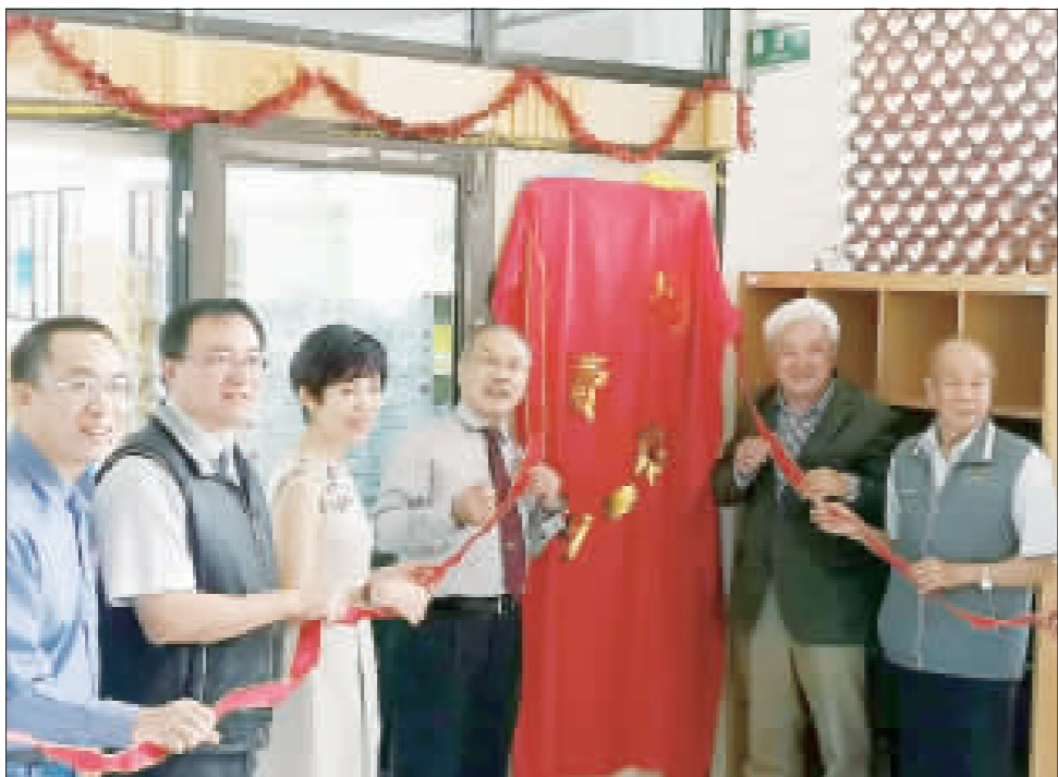
上、金城國中歡慶54周年校慶，眾貴賓一起切蛋糕誌慶；下、金城國中圖書館改造變身為社區共讀站，將館內藏書向一般民眾開放。

而昨日校慶園遊會，在城中醒獅舞陣團的表演唱下揭幕，全校22個班攤位創意十足，展現團隊合作精神，學校也安排攤位創意設計與攤位營運兩項競賽，獎勵各班同學在園遊會上的用心。昨日城中校園處處充滿歡笑聲和祝福聲，學子沉浸在熱鬧的園遊會中，校友、貴賓一同感受學校的活力、創意，在校園處處充滿慶祝氣氛，也為校慶活動劃下圓滿句點。最後上場的活動，則是九年級的班際接力賽，九年級的班際接力賽，在激烈的競爭之下，展開激烈的競爭，而本屆的城中校慶活動則在運動競賽中，劃下圓滿的句點。