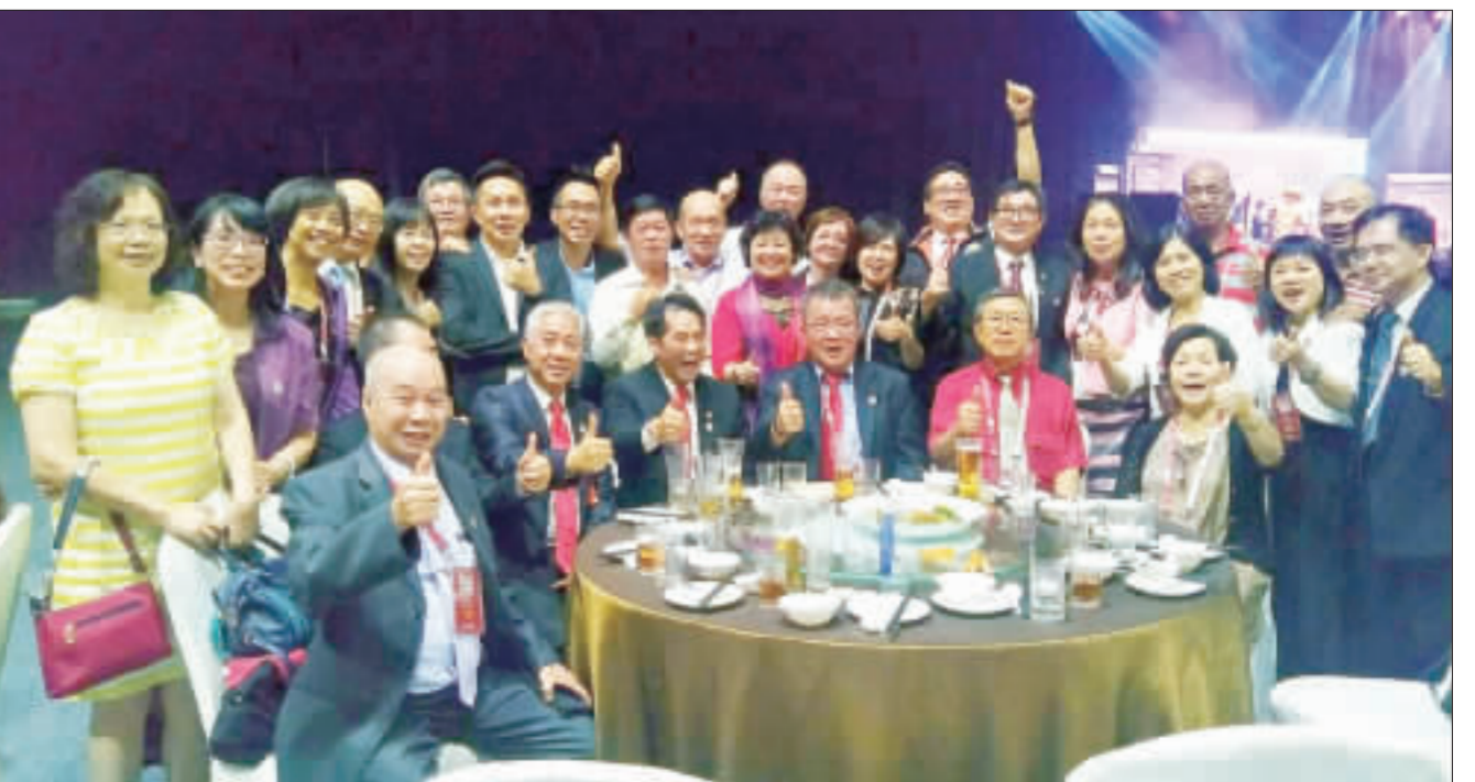
▲總會團員拜訪金江會館，隨團成員慷慨解囊，捐款興學，傳為佳話。