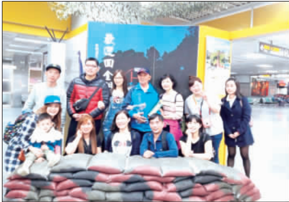
左、右：金門縣政府「2018戰地主題推廣活動—老兵召集令獎勵計畫」至11月8日止，蒞金旅遊老兵人數8,848，向1萬人邁進中。

記者李增注／綜合報導 金門縣政府「2018戰地主題推廣活動—老兵召集令獎勵計畫」至11月8日止，蒞金旅遊老兵人數8,848，向1萬人邁進中，觀光處表揚歡迎老兵返金同時，觀光處表揚天柱貢糖持續贊助每位老兵貢糖試吃品外，金酒公司跟進，推出老兵購酒優惠方案。