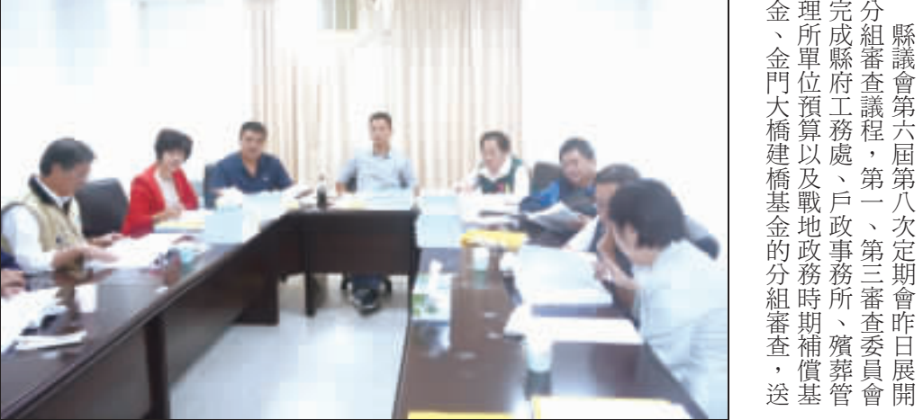
左、右：縣議會定期會分組審查會議中，第一、第三審查委員會委員針對權責所屬的議案進行審議。

記者莊煥寧／綜合報導 縣議會定期會第六屆第八次定期會昨日展開分組審查會議，第一、第三審查委員會委員針對權責所屬的議案進行審議。 縣議會定期會昨日展開分組審查會議，第一、第三審查委員會委員針對權責所屬的議案進行審議。