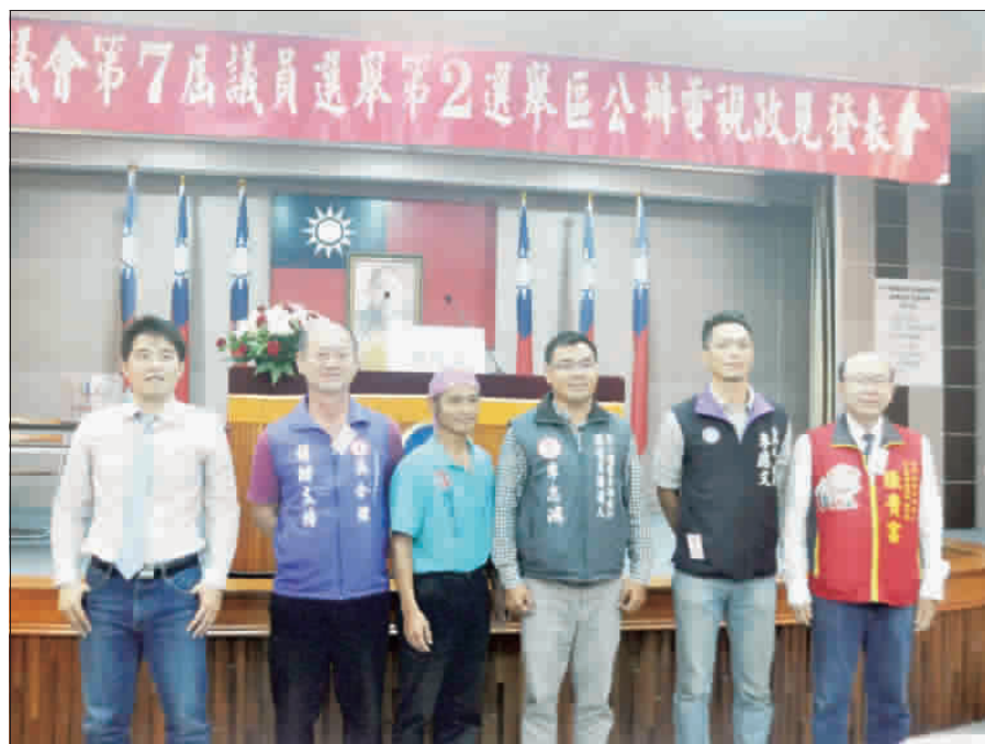
金門縣議會第七屆議員選舉公辦電視政見發表會，第二選區候選人到場政見發表六位合影。