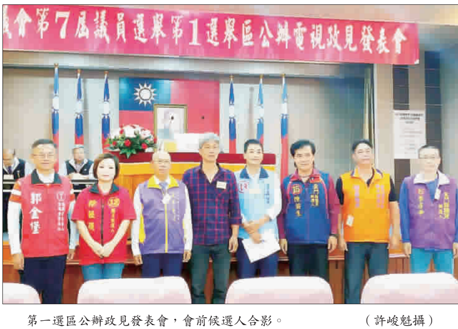
第一選區公辦電視政見發表會，會前候選人合影。