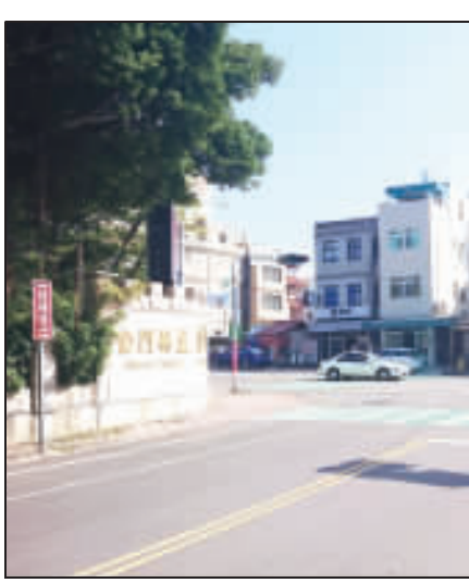
左、右：金城民族及民權路路口，11月19日將啟用紅綠燈。