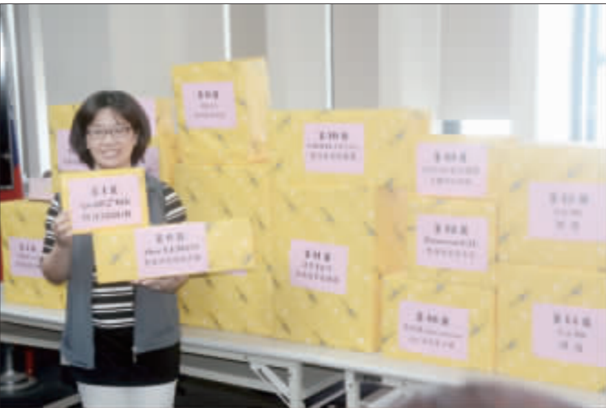
記者莊煥寧／綜合報導 為防範虛偽設籍人口危害選舉之公平、公正和純潔性，捍衛住民自治之選舉精神，金門地檢署特別在選前最後一週推出反賄選抽獎活動，共有150個獎項，獎品十分豐富，最大獎為5.2平板電腦，最小獎也有禮券20元，歡迎民眾踴躍參加。地檢署表示，希望透過活動熱度最高的抽獎活動吸引民眾注意，並加深民眾印象，提醒金門鄉親各戶政機關要求強制將其戶籍遷出。

地檢署表示，本次發給抽獎券的總數量為1500張（其中2000張委託社區發展協會發放，3000張開發現場索取），數量有限，發完為止，活動獎品十分豐富，大小獎共有150個獎項，並於20日下午2時在地檢署5樓公開抽獎，有意參加抽獎活動的鄉親，一定要儘快行動，相關活動詳情及獎項可洽金門地檢署網站及臉書粉絲專頁。