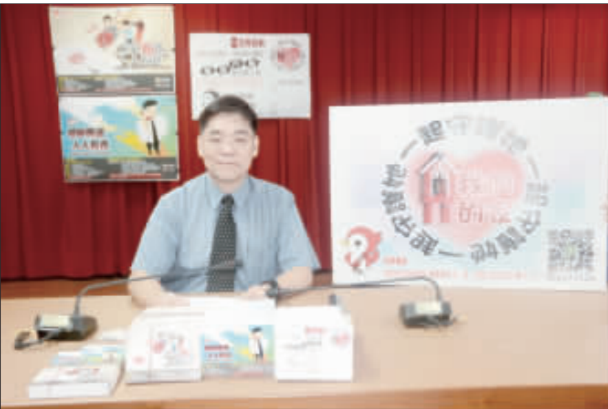
金門地檢署辦理反賄選抽獎，彩品相當豐富，檢察長毛有增（左圖）親自說明活動的意義及內容，並呼籲選民「捍衛住民自治『在地人的民代、由在地人做主』」。