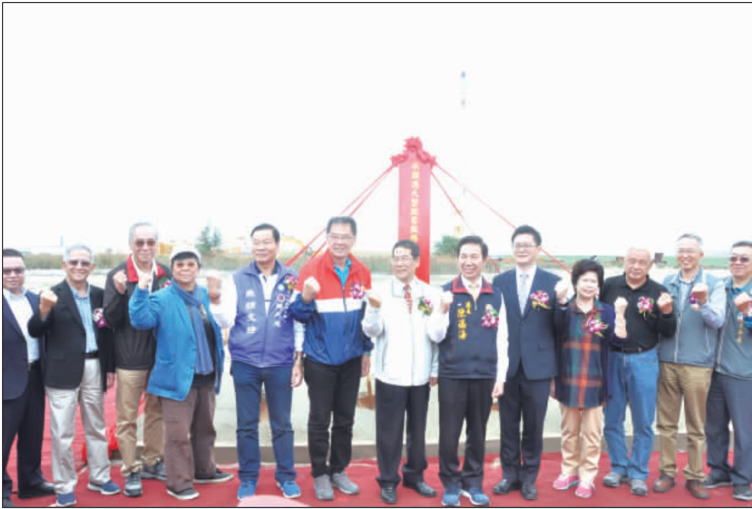
歷經10次流標，本月初順利決標的金門「水頭港大型旅客服務中心新建工程」於昨日下午吉時舉行動土典禮，帶著滿滿的期待與信心，由金門縣政府秘書長翁明志、交通部航港局副局長陳寶權、副縣長吳成典、秘書長林德恭、金門旅台學人前台灣結構工程師公會理事長蔡榮根、縣議員陳濱江、許華玉、交通部港務小組委員等數十位貴賓應邀擔任奠基石。典禮在古風古韻中揭開序幕，隨後由陳福海主持動土典禮，並由陳福海主持動土典禮...