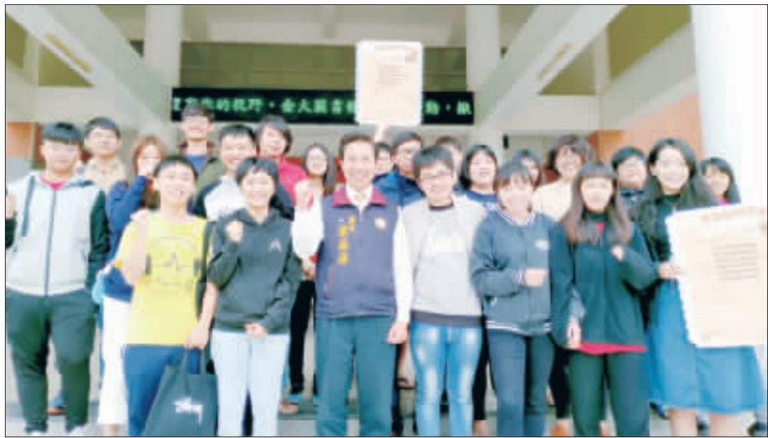
縣長陳福海參與由大學生自發成立的「金門友善動物島促進學陣」宣示大會，與20餘位大學生開心合影。

記者李增注／綜合報導 一群愛「毛小孩」的大學生來到金門讀書，發現金門對於友善動物的環境並不好，因此成立「金門友善動物島促進學陣」，希望推動讓寵物在金門能夠得到友善的對待。這項運動推出了六項訴求，得到縣長陳福海全力支持，並獲得第一選區縣議員候選人徐銀鏡、金城鎮長候選人許鎮輝、金寧鄉長候選人陳成宗、金沙鎮長候選人吳有宗、金城鎮代表候選人陳文顯及金城鎮代表候選人翁江亦等人的簽署支持。