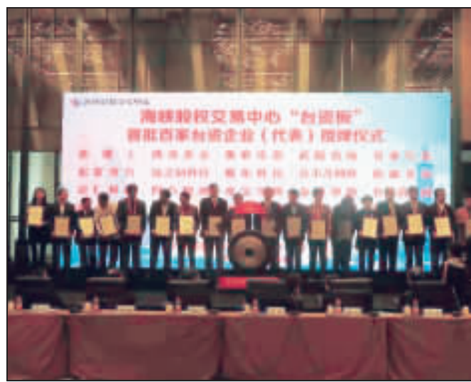
台資版宣布設立 福建省的海峽股權交易中心宣布新設集合100多家台企的「台資版」。(中央社)

2016年兩岸企業家峰會閉幕，2天的峰會關注中國經濟形勢及相關政策，不少產業合作的討論焦點，聚集於中國「對台31條」及「一帶一路」，希望藉勢發展。 兩岸企業家峰會4、5日在中國福建省廈門市舉辦，峰會期間共舉行8場專題論壇，由召集人統籌，在閉幕式上總結報告。 8場論壇包括「綜合合作交流」、「資訊、通信」、「綜合合作交流」論壇建議陸方提出的「關於促進兩岸經濟文化交流合作的若干措施」(對台31條)應重視台企遭遇的問題，呼籲如放寬台資銀行營業範圍限制，包括五險一金。同時建議落實台企與陸方合作「一帶一路」爭取商機，由中國發展改革委員會成立單一窗口，協助台企獨資或與陸企合資爭取商機。 金融方面，論壇涉及兩岸銀行融資、人民幣跨境支付、互聯網金融等方面的合作，也討論兩岸金融人才資格和證照互認等議題，並強調金融創新，積極促進兩岸金融機構以科技創新，加強交流。 「能源及環保節能產業合作」論壇，一是古雷石化產業合作平台，希望提供更多更完整的投資政策及服務，逐步解決企業投資遭遇的困難。 至於現代服務業暨文化創意產業論壇，則談到拓展兩岸運動休閒、教育旅遊，提升文創業對接及影視跨界文創業發展。 此外，因應中國大陸「新零售」趨勢，論壇也討論借鑒中國大陸電商經驗，對接兩岸跨境電商服務產業鏈。包括兩岸合作輔導在地商家、培育電商人才，進一步推廣兩岸優質農特產品及文創精品，讓兩岸電商朝向精緻化多元化發展。 論壇討論方向也包括兩岸5G、雲端、物聯網、智慧城市等新興產業，考慮到中國大陸發展趨勢，生物科技、安寧長照也是論壇重點之一。 當前中國經濟形勢下，在大陸的台灣中小企業發展難題在這次峰會中提出。福建省的海峽股權交易中心今天宣布新設集合100多家台企的「台資版」，在掛牌增加企業曝光度，吸引投資者目光。 不過，目前「台資版」還無法上市交易，因此著重在掛牌增加企業曝光度，吸引投資者目光。