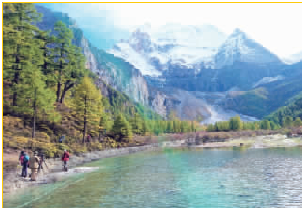
▲「龍珠措」秋色斑斕水潑潑，人在國畫卷軸行。

四川四姑娘山秋色離離，東畫一幅亮紅；西塗一片金橙；南調一道紺綠；北繪一圈彤彩。楓葉更是秋天紅色的舞鞋，一路舞舞開來，把山谷抱起把山谷放下；把村舍擎起把村舍放下；把溪流牽起把溪流放下……盡是「楓」采翩跹，「楓」情萬種，一逕舞舞