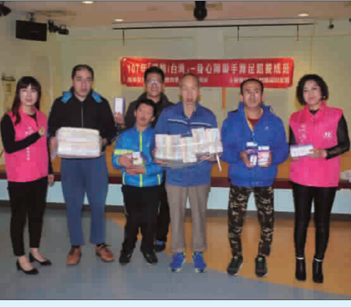
▲金門縣新二代兩岸交流協會親子團前往福田家園慰問。(陳冠霖攝)