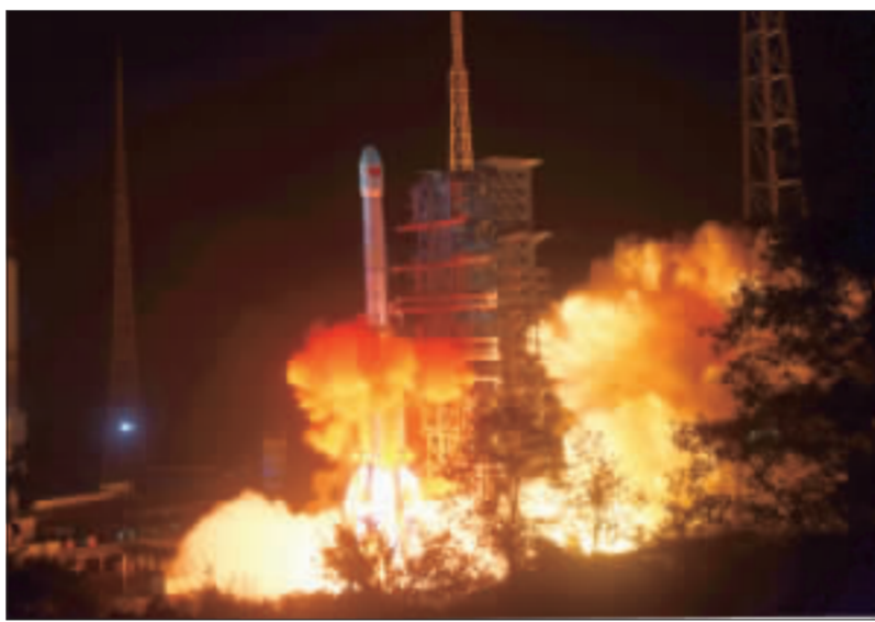
中國8日凌晨2時23分在西昌衛星發射中心成功發射嫦娥四號探測器，預計飛行27天後，將於2019年初在月球背面著陸，這將是世界第一顆在月球背面著陸和巡視探測的太空載具。

嫦娥四號發射，首次勘查月球背面。中國8日凌晨2時23分在西昌衛星發射中心成功發射嫦娥四號探測器，預計飛行27天後，將於2019年初在月球背面著陸，這將是世界第一顆在月球背面著陸和巡視探測的太空載具。 嫦娥四號探測器將有幾個國際上「首次」實現人類月球背面著陸和巡視探測。首次實現人類月球背面著陸和巡視探測。首次實現人類月球背面著陸和巡視探測。首次實現人類月球背面著陸和巡視探測。 嫦娥四號探測器將有幾個國際上「首次」實現人類月球背面著陸和巡視探測。首次實現人類月球背面著陸和巡視探測。首次實現人類月球背面著陸和巡視探測。 嫦娥四號探測器將有幾個國際上「首次」實現人類月球背面著陸和巡視探測。首次實現人類月球背面著陸和巡視探測。首次實現人類月球背面著陸和巡視探測。