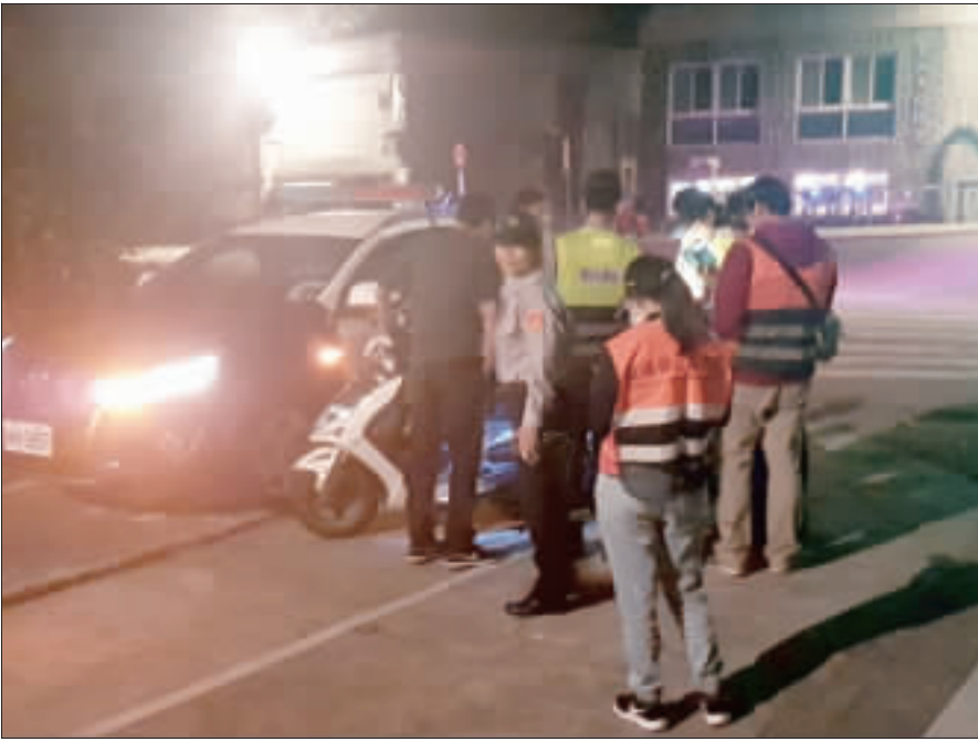
縣警局結合環保、監理單位加強執行「聯合路檢勤務」，於地區重要道路針對違規改裝車輛加強路檢。

【本報綜合報導】為改善移動污染源之空氣污染，維護國民健康，落實環境保護政策，參考歐美、亞洲等國之移動污染源石油產品成分管制標準，修正現行「車用汽油柴油成分管制標準」，當中，修正汽油之苯含量最大值加嚴至0.8%、柴油之多環芳烴含量最大值加嚴至8%、增訂船舶燃油硫含量最大值加嚴至0.5%及增訂航空燃油硫含量最大值加嚴至0.2%，加嚴國內移動污染源燃料成分管制。 本縣環保局指出，車用汽油柴油成分管制標準自八十八年十二月十五日訂定發布，歷經六次修正，最近一次修正為九十八年七月二十九日，逐步建構我國車用汽油柴油成分之管制標準。而汽油、柴油經過燃燒後，將排放氮氧化物(NOx)、硫氧化物(SOx)、碳氫化合物(HC)等多種有害物質，造成臭味、酸雨及煙霧等問題，減少對人體之健康危害與空氣污染，環保署考量目前世界各國對於車用汽油柴油成分管制標準趨嚴，現行管制標準已不敷管制需求，另配合一百零七年八月一日修正公布之空氣污染防治法，移動污染源管制對象增加船舶及營運中之施工機械、農業機械等，爰予以檢討修正。