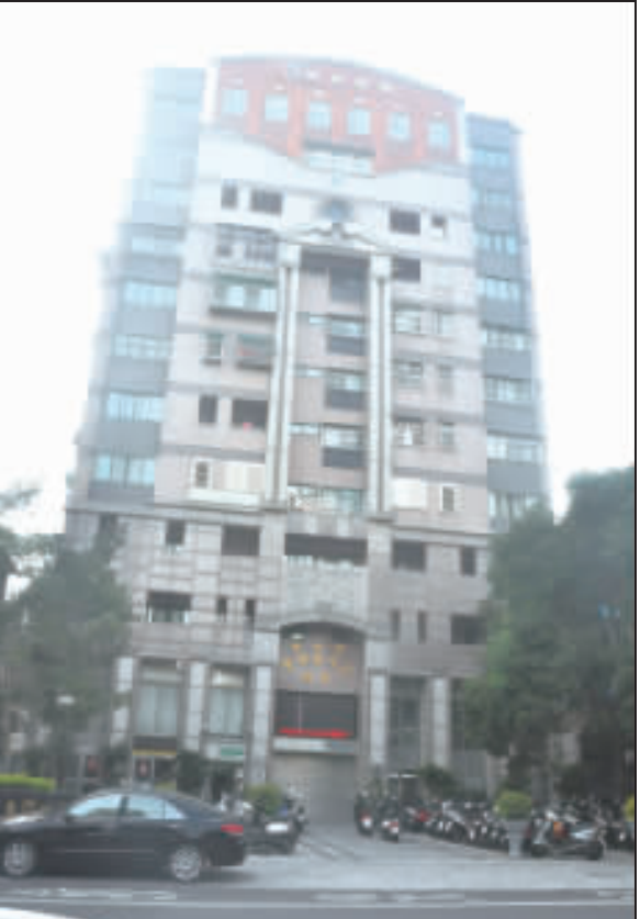
本縣108年度公告土地現值，地王仍是金城鎮金信大樓所屬地價區段。

金門公告土地現值 記者李金鐘／金寧報導 金門縣地價評議委員會於昨日(9)召開地價評議會，評定本縣108年度公告土地現值，經會議討論，本縣108年平均公告土地現值增幅調升1.6%，地王仍是金城鎮金信大樓所屬地價區段，各土地公告現值將於108年1月1日公告實施。 本縣地價評議委員會，經參考各界之意見，將部分臨主要道路之區段與裡地之區段適度劃分，帶狀公共設施用地分段劃設及依都市計畫使用分區檢討等因素，共劃設120個地價區段，較前一年增加20個區段，各區段之地價，經會議討論，為