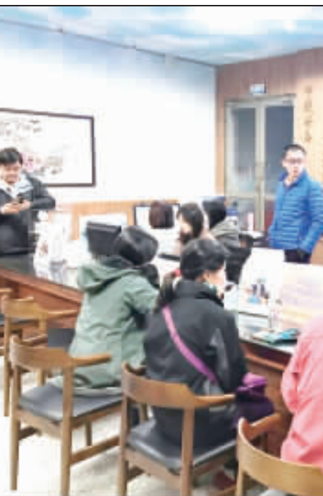
108年春節假期期間台金航線機票昨下午6時統一開放第一階段訂位作業，縣府為服務鄉親上網訂位，特協同各鄉鎮公所同步於縣府1樓大廳及各鄉鎮公所開設服務櫃檯，協助鄉親訂票。

記者翁維智/縣府報導 108年春節假期期間(108年1月31日至2月11日)臺金航線機票昨下午6時統一開放第一階段訂位作業，共計提供12架次、1520個座位。縣府為服務鄉親上網訂位，特協同各鄉鎮公所同步於縣府1樓大廳及各鄉鎮公所開設服務櫃檯，協助鄉親訂票。統計昨日共服務鄉親121人次，有效訂票29張。 縣府指出，依歷年來開放訂位後經驗，仍有部分鄉親反映尚未訂到機票，無法回鄉過年，有鑑於此，11月26日金門縣政府即召集各相關單位及航空公司召開108年春節運送協調會，一會中除請交通部民航局和航空公司儘量協助，定調108年春節尖峰時段機票需求務必以不低於今年為原則，權、協助鄉親訂票。 後續也將審慎看待鄉親位需求。觀光處也說明，縣府施政一直是站在服務鄉親的立場用心，致力提供最優質的服務，但因訂位時間大量電費及訂位人潮湧入航空公司在內，仍不免造成網路及電話壅塞，為此，對於航路及電話壅塞，該處也請有需要鄉親儘速向航空公司電話或網路訂位，如欲搭乘航班班額滿亦可向航空公司客服中心電話洽詢，航空公司將持續進行清理作業，倘有清出機位將優先通知候補充客購票，請鄉親特別注意！ 另民航局也將針對候補狀況規畫第二階段加班機運能，並於明(108)年1月8日下午6時開始於縣府1樓大廳服務台將同步於縣府1樓大廳服務台烈嶼等五鄉鎮公所開設服務櫃檯，協助鄉親訂票。