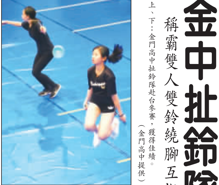
上、下：金門高中扯鈴隊赴台參賽，獲得佳績。