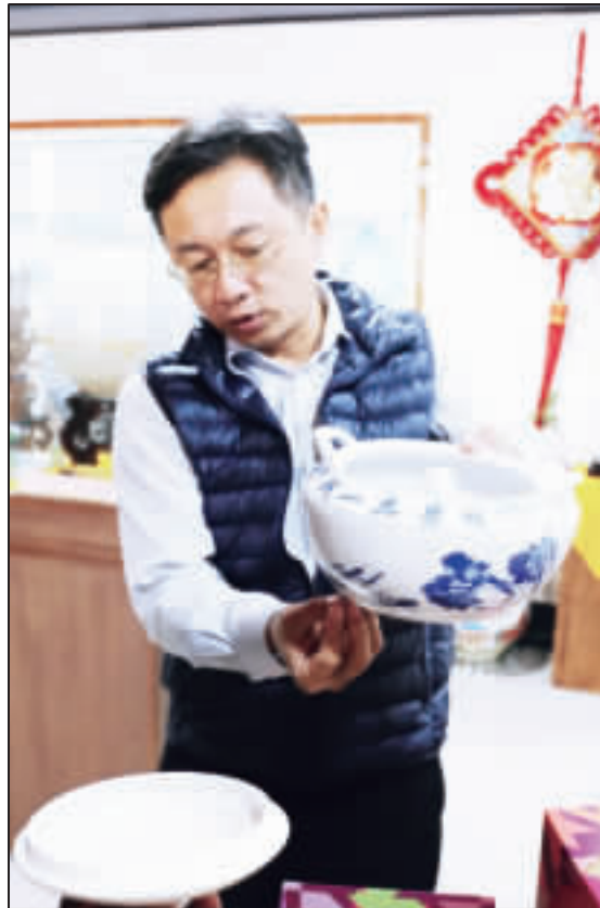
上、下：金門陶瓷廠出產的「陶瓷汽鍋」，在台中新社花海展出，外爆紅，引發民眾搶購熱潮。(陶瓷廠提供)

適度回應各界之意見，僅作微幅調整，主要變動在於於部分開發用地適度調降，新興整體開發地區及現值差異較大之地區酌予調升，以緩和逐步調整之方式使各地價區段間之差異趨於均衡。 經會議評議結果，本縣地王仍是金城鎮金信大樓所屬地價區段，每平方公里5,500元，最低地價區段為金湖鎮東碇島，每平方公里300元。明年各土地公告現值，將於108年1月1日公告，民眾可至地政局網站 https://andweb.kinmen.gov.tw/query/valueprice.jsp?zmenu=fnuc 查詢。 責任編輯／趙水樹