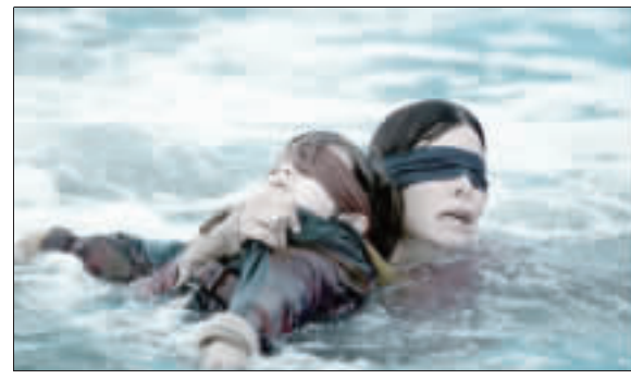
珊卓布拉克(右)拍Netflix電影，挑戰「蒙上你的眼」

【中央社台北訊】知名演員珊卓布拉克(Sandra Bullock)日前在Netflix電影「蒙上你的眼」(The Eyes)中，與奧斯卡外語片「更好的世界」(Bævre)首度攜手合作，挑戰「挑戰眼盲」的演技。 【中央社台北訊】知名演員珊卓布拉克(Sandra Bullock)日前在Netflix電影「蒙上你的眼」(The Eyes)中，與奧斯卡外語片「更好的世界」(Bævre)首度攜手合作，挑戰「挑戰眼盲」的演技。 【中央社台北訊】知名演員珊卓布拉克(Sandra Bullock)日前在Netflix電影「蒙上你的眼」(The Eyes)中，與奧斯卡外語片「更好的世界」(Bævre)首度攜手合作，挑戰「挑戰眼盲」的演技。