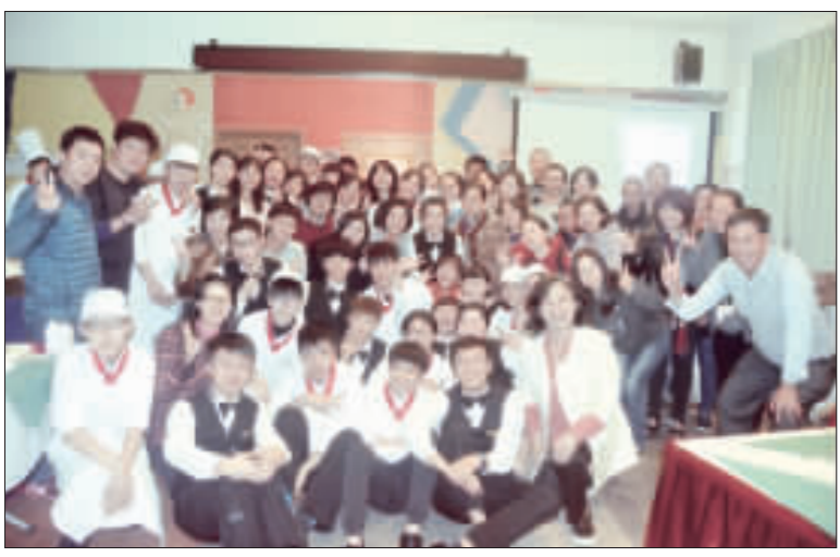
金門農工職校舉辦餐飲管理科畢業成果展：上、準畢業生端出精緻健康蔬食料理；下、溫馨大合照，劃下圓滿的句點。

記者許加泰／綜合報導 上菜囉！國立金門農工職校舉辦餐飲管理科畢業成果展，由32位準畢業生提供精緻的多國料理及健康蔬食，展現在中餐、西餐、烘焙、蔬果切割、咖啡、飲料調製與餐服服務各領域上的學習成果。學生看著媽媽在餐桌上品嚐自己做的料理，並露出滿意的笑容，「好感動、好有成就感」。