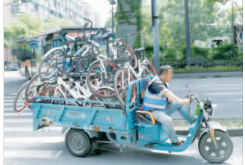
共享單車在中國網路創業領域一度風光無限，統計顯示，2016年到2017年間，中國總共成立了41家共享單車公司。泡沫退去後，倒閉潮於2017年6月正式引爆，當年死亡榜上少說有30家，而今年業巨頭ofo也面臨用戶擠兌押金。

共享單車在大陸火起一年多後，已近黃昏。行業巨頭ofo小黃車近來押金遭到擠兌，總部門口動輒上百人排隊，線上退款人數更破千萬，積欠押金逾人民幣10億元（台幣45億元）。 ofo小黃車經營不善的利空消息近來在市場傳散，引來用戶擠兌押金。由於線上退款需耗時待，微博上則到ofo總部可當場退還押金的傳聞傳出後，從週一（17日）開始，線上退款的人數則一舉突破千萬大關。澎湃新聞指出，截至18日晚間10時，ofo小黃車的押金在線上退款人數已達到300萬人。按照押金為99元或199元計算，退押金總額在10億至20億元。 儘管ofo小黃車一直對外宣稱「押金正正常常，用戶可在ofo端自行申請，0至15個工作日到帳」。不過，一名在大陸工作的台灣民眾10日線上申請退款，在忙忙碌碌中一封簡訊驗證碼，再次聯繫ofo後至今仍未拿到錢。 共享單車在中國網路創業領域一度風光無限，統計顯示，2016年到2017年間，中國總共成立了41家共享單車公司。泡沫退去後，倒閉潮於2017年6月正式引爆，當年死亡榜上少說有30家，而今年業巨頭ofo也面臨用戶擠兌押金。