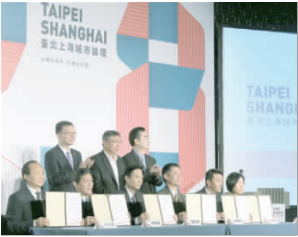
台北上海雙城論壇20日在晶華酒店登場，在台北市長柯文哲（後中）、台北市副市長鄧家基（後右）與上海市常務副市長周波（後左）的見證下，由雙方代表簽署青少年運動員培養交流合作、北市大同區與上海市嘉定區交流、台北市電影委員會與上海市廣播影視製作業行業協會交流等3項備忘錄。

【中央社記者梁佩綺、繆宗翰台北20日電】台北上海雙城論壇今天登場，台北市副市長鄧家基說，選後舉辦雙城論壇最尋常的意義在於藍綠有共識擴大交流，台北與上海雖沒有相同過去，但藉由交流有共同未來。雙城論壇在晶華酒店登場，上午舉行開幕式，由台泥企業團董事長張安平引言，副市長鄧家基與上海市常務副市長周波致詞，雙方就主題進行簡講，隨後簽署合作備忘錄，最後由台北市長柯文哲致詞。 鄧家基致詞時表示，昨天他陪著周波副市長訪問公共住宅、內溝溪生態整治以及台達電時，感受到台北與上海都面臨競爭壓力；而他一度脫稿，笑說周波昨天當場邀請鄧家基與林洲民到上海發展，給台北市帶來很大壓力。鄧家基說，此次雙城論壇在選後持續舉辦，最尋常的意義就是藍綠白在擴大交流上有共同的認知與共識。 盼台北與上海能正向交流發展，帶動全面互動，期望台北、上海沒有完全相同的過去，寄望交流努力，讓下一代有美麗和諧共同的未來。 周波表示，雙城論壇是兩岸城市交流最重要的機制化平台。上海與台北既是合作關係，也有競爭關係；因為只有競爭，才會有進步，才會有動力。 他說，上海作為中國大陸長三角的核心城市，不僅可以為台灣民眾發展機遇，也可以讓雙城論壇發揮更多作用，讓上海與台北共同譜寫更多美好的雙城故事，共同維護兩岸和平發展的大局。 張安平則以作家狄更斯「雙城記」中「這是最美好的時代，也是最壞的時代」等語開頭，替雙城論壇拉開序幕，有些城市在歷史洪流中消失，有些仍存，但都有過重要地位，「當下現在的我們，所做的每一件事情，都是為了未來的下一個時代，因為我們都在寫歷史」。