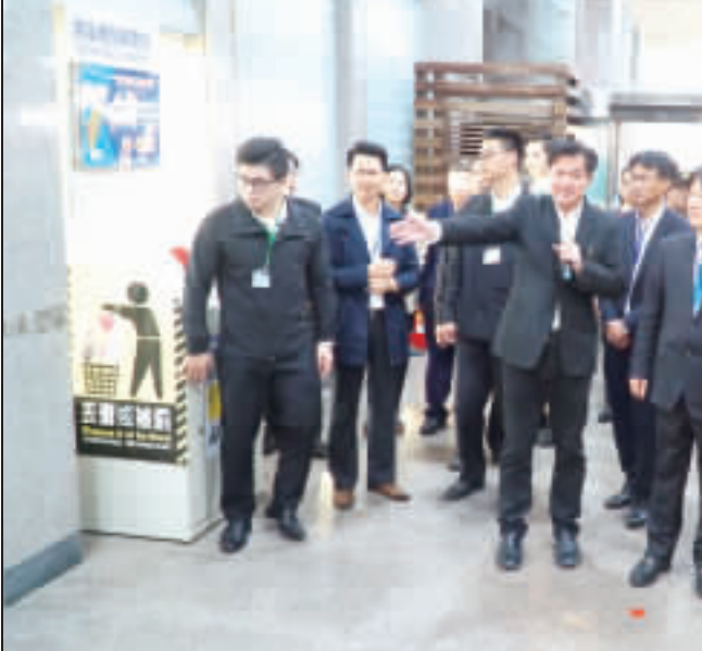
上、賴清德視察小三通，並與防疫犬互動；下、賴清德視察小三通，了解防疫措施。