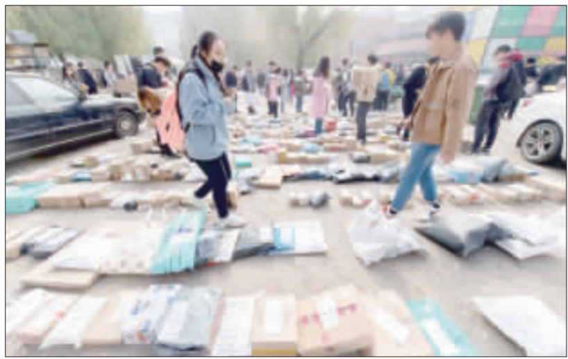
圖為今年「雙十一」期間，太原市山西大學校園內大量到貨的快遞。

據中國國家郵政局郵政業安全監管信息系統監測，一件從陝西武功寄往北京的快遞包裹，僅需5小時即可抵達。中國快遞業務量連續5年居世界第一，超過美國、日本和歐盟的總和。 綜合第一財經等媒體報導，年業務量突破500億件是中國快遞發展史上又一里程碑，也是中國從快遞大國向快遞強國邁進的新起點。 中國國家郵政局新聞發言人、市場監管司司長馮力虎在記者會上表示，中國快遞業務保持高速成長，行業7家企業陸續上市，形成一家年收入逾人民幣百億元、4至5家年收入超50億元的企業集團。 他表示，自2017年開始，中國快遞業務量連續5年居世界第一，超過美、日、歐等發達經濟體總和，成為世界郵政業的動力源和穩定器。