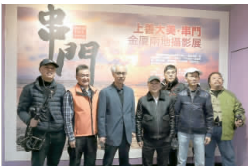
金廈攝影家協會與廈門市企業家攝影協會聯合舉辦的《上善大美·串門》攝影交流展，於12月29日在金門縣文化局第一展覽廳隆重舉行。參加

記者詹宗翰／金城報導 「金門廈門對門」，兩地的攝影家聯合舉辦攝影展，將碰撞出怎樣的火花？透過《上善大美·串門》此一展覽，將可看出藝術家對美的追求，是沒有地域之分的。 金門縣攝影家協會與廈門市企業家攝影協會聯合舉辦的《上善大美·串門》攝影交流展，於12月29日在金門縣文化局第一展覽廳隆重舉行。參加