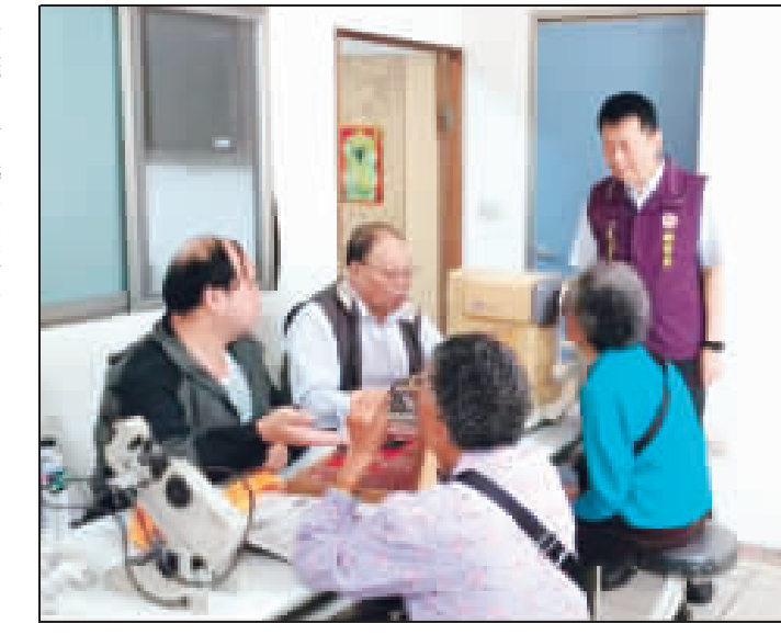
金門榮民服務處辦理「107年度下半年榮民光學眼鏡巡迴服務」。(金門榮民服務處提供)

根據航港局表示，近年積極推動金門小三品及廚餘，統一採集中處理原則，避免病菌傳播風險，並持續加強宣導，要求兩岸航商於售票處、入出境及乘船期間向旅客發放防疫文宣，及在船上廣播防疫相關規定及罰則，以避免旅客因違規攜帶肉類食品入境，遭處20萬元以上100萬元以下之罰鍰。 航港局亦呼籲元旦連假期間，(C/C)相關單位也將加強旅客進出管制區之隨身行李檢查及加派防疫犬，提醒旅客切勿自疫區攜帶肉類食品入境，避免受罰。