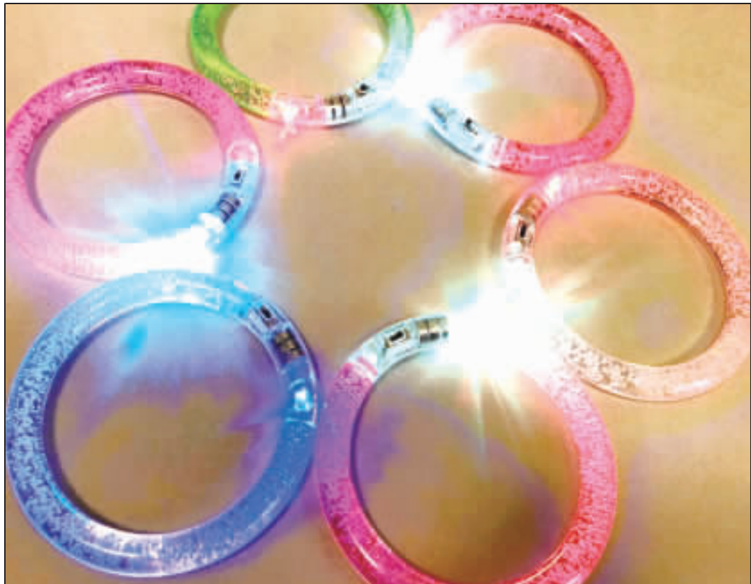
2019跨年晚會將在現場發送LED發光手環，發完為止。

記者詹宗翰／金湖報導 金彩新未來2019金門跨年晚會，12月31日晚間7時30分起假縣立體育館後方廣場舉行，今年由梁赫群、小禎(胡盈禎)搭檔主持，民歌手邵肇政、台語唱將陳隨意、蘇有蓉、華裔歌手Kendy(林愷倫)、創作型歌手文慧如、黃文星、療傷系歌姬梁文音等藝人到場獻唱，小朋友最愛的YOYO家族的太陽哥哥、月亮姐姐也抵金同樂，最後由高音高到比太武山還高的鐵肺女王戴愛玲壓軸演出！ 文化局表示，晚間6時30分起開放進場並發放摸彩券及LED發光手環(發完為止)，摸彩券需於晚間8時前將摸彩券投入摸彩箱，表演活動自晚間7時30分由金門在地主持