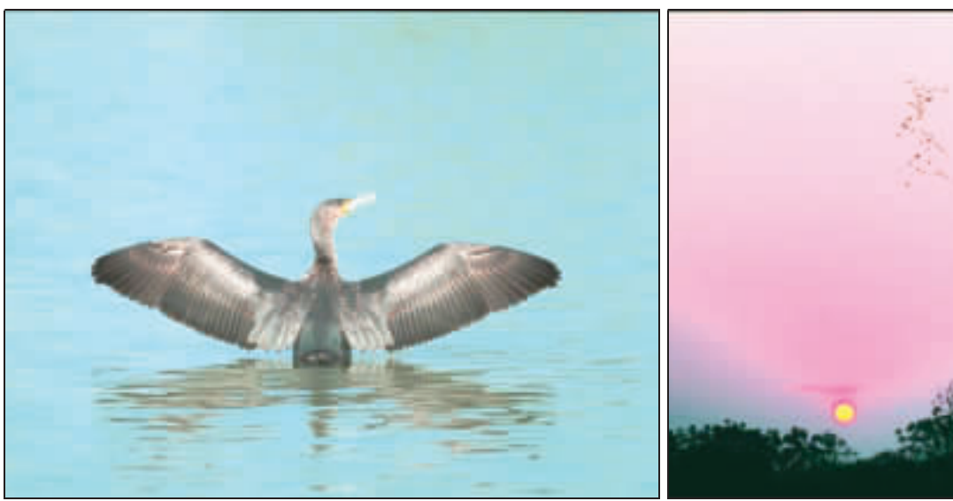
鷓鴣在金門主要棲息在慈湖、陽明湖、陵水湖等地。其中慈湖為最大棲地，每當傍晚夕陽餘暉，成千上萬的鷓鴣井然有序的排成人字形或一字形陸續歸巢，壯觀場面，已成為金門重要生態景觀之一。

以波浪狀隊伍飛翔，盤旋飛舞的壯闊場景，黑壓壓的一片非常壯觀，讓人驚豔不已。 金管處表示，金門已經發現現有紀錄的鳥種有20種之多，其中，冬季除了留鳥外，連同冬季候鳥、過境鳥，同時可欣賞到黑翅鳶、魚鷹、黑鶯、金背鳩、雙嘴鸛、珠頸斑鳩、棕背伯勞、戴勝、黃尾鸝及多種鷓鴣、雁鴨科等鳥種，為最佳賞鳥季節。 金管處指出，金門冬季賞鳥，可持續到明年3月，除了慈湖、大金門的滄江溪口、太湖、官澳、浦邊、洋山、金沙水庫外，小金門的陵水湖等地，都是賞鳥的好地點。鷓鴣在金門主要棲息在慈湖、陽明湖、陵水湖等地。其中慈湖為最大棲地，每當傍晚夕陽餘暉，成千上萬的鷓鴣井然有序的排成人字形或一字形陸續歸巢，壯觀場面，已成為金門重要生態景觀之一。 金管處為提供更多民眾、遊客可以了解鷓鴣的生態，以及推廣賞鳥正確的倫理與態度，已從今年11月17日起委託金門縣野鳥學會於慈湖三角堡現場提供鷓鴣生態解說，整個解說活動至昨日告一段落，活動期間，吸引來自各地的鳥迷共同迎接北方嬌客來臨，共譜冬季戀歌。 金門冬季賞鳥季節，金管處歡迎各地鳥迷相約到金門旅遊、賞鳥，體驗金門自然生態之美。