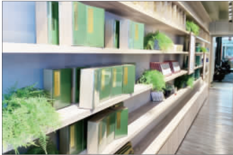
金門王大夫一條根，明年元月將成立第一家品牌概念店，期待藉不一樣的氛圍打造，為百年老店再創繁華盛景。

「王大夫」一條根，明年元月將成立第一家品牌概念店，期待藉不一樣的氛圍打造，為百年老店再創繁華盛景。