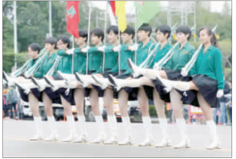
元旦總統府升旗彩排 北一女樂儀旗隊登場

【中央社記者余祥台北30日電】九合一選舉國民黨獲勝，面對2020年重選執政，前立委孫大千今天說，國民黨太陽轉型的第二步，就是要先拋掉「自戀的偶像包袱」；國民黨立委林奕華則認為，要丟掉大老文化，深入基層。 國民黨內目前僅有前新北市長朱立倫表態投入總統大選，外界關注其他黨內太陽動向，前立法院長王金平日前指出「是否要選要看黨內因緣」，黨主席吳敦義、前總統馬英九則都低調未表態。 孫大千認為，政治人物應該主動展現勇於承擔的魄力與態度，黃袍加身或者是推舉推戴都是舊時代的老戲碼。而政治人物本就是要來自人群，並不是貴族階級，也沒有高人一等，在新時代的政治模式中，政治人物應該跟民眾一起呼吸、一起感受，唯有如此，才能夠從庶民的角度看到問題，用庶民的語言來對話。 國民黨立委林奕華則建議，黨內太陽不要再走「大老文化」，要真正了解民意，且必須深入基層，台灣雖然小，但也十分多元，應該要了解各種不同族群的需求。林奕華也認為，按照目前整體趨勢，大家希望政治人物講人話聽的懂的話，提出的訴求也要是民眾真正期待的，而經濟絕對是台灣民眾最關切的重點。 屬於年輕世代的國民黨中常委、台北市議員徐弘庭表示，黨內太陽最缺之兩部分，第一，是清楚而簡單的論述，現在外界不太清楚他們參選所代表的意義是什麼，第二，是給年輕世代機會，年輕世代的加入將帶來不一樣的選舉動能。