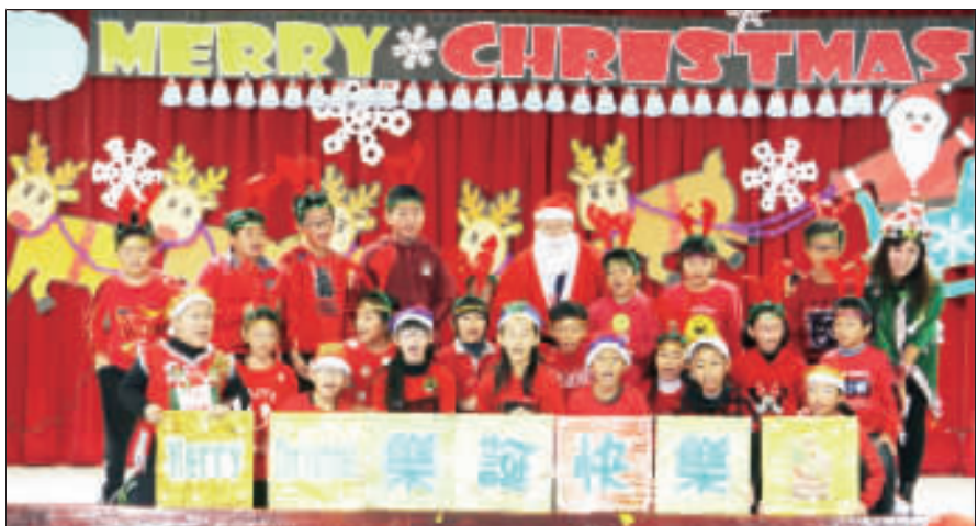
古城國小教學參觀日，用英語歌曲及唱跳律動歡度聖誕節。