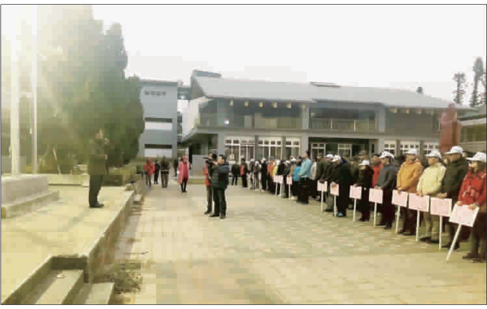
金湖鎮公所屬各小學升旗典禮與升旗健走典禮。

禮，一大早6點天還沒亮，點寒意，大批民眾就湧進金湖國小升旗台前廣場，等著準備升旗典禮；6點30分一到，由新任金湖鎮長陳文顯帶領，眾人唱著國歌、向國旗敬禮，目送國旗隨風飄逸、冉冉升天。 升旗典禮結束後，便是一度例行的健走活動，本次健走路線約3.5公里：金湖國小大門（出發）