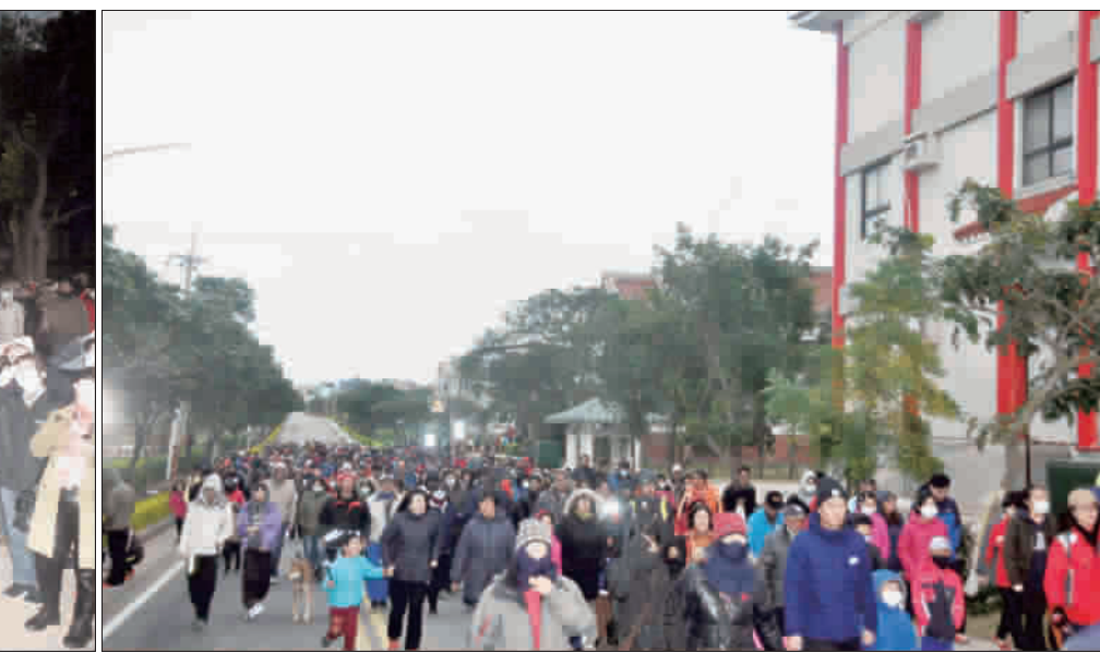
左、右：迎接中華民國108年新年到來，金寧鄉公所辦理元旦升旗典禮暨全民健走活動。