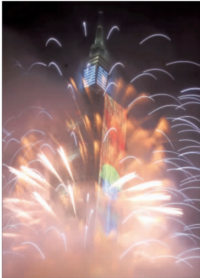
台北101跨年煙火秀長達360秒，透過9大主題展現台灣的多元文化，並祝福大家2019年有好的開始。(中央社)

【中央社巴黎31日綜合外電報導】施放煙火加上慶祝活動，狂歡群眾迎接新年，從亞洲一路往西到歐洲、美洲，全球慶祝活動接力，宣告結束過去一年的紛擾。 法新社和英國「每日郵報」(Daily Mail)報導，全球跨年慶祝從澳洲展開，以雪梨史上最大規模施放煙火，照亮港口天際線，長達12分鐘之久。 在香港，數十萬午夜派對群眾擠滿維多利亞港兩旁，觀看10分鐘的煙火秀，這場秀耗掉180萬美元(約新台幣520萬元)。 印尼雅加達，逾300對佳偶參加政府舉行的集體婚禮，以迎接新年到來。 不過，印尼今年取消煙火秀，以表示對12月22日逾40名海嘯難童致哀。 在中東杜拜，煙火點亮全球最高樓哈利法塔(Burj Khalifa)的天空，觀賞群眾欣喜不已，而鄰近的高塔拉斯海瑪(Ras Al Khaima)尋求列入金氏世界紀錄最長的煙火施放時間。 在全球新年慶祝中，俄羅斯橫跨數個時區，由遠東區開始，一直到莫斯科市公園舉行音樂和燈光秀，有超過1000個溜冰場為民眾歡樂開放。