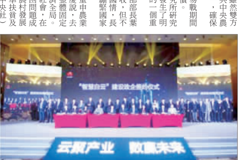
海外頻頻受阻 華為在廣州打造智慧城市

廣州智慧城市生態合作峰會28日召開，在海外頻頻受阻的華為技術有限公司，宣布將把廣州市白雲區打造成中國領先的智慧城市。 華為技術有限公司與廣州市政府簽署合作協議，將把廣州市白雲區打造成中國領先的智慧城市。