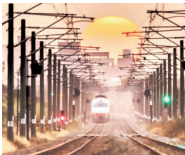
雲林科技大學學生拍攝夕陽餘暉下的火車爆紅，但也因為取景位置是否觸法引起討論。

【中央社記者葉子綱雲林縣1日電】雲林科技大學李姓學生拍到夕陽火車照片，分享後爆紅，但因拍攝站的位置引起爭議，斗六鐵路警察局派出所昨天表示，已請學校教官協助通知學生前來說明，以釐清相關情況。 雲林科技大學學生迷上攝影，花了七個月時間，追逐夕陽餘暉下的火車畫面，29日在臉書貼出成果，形容雀躍心情說「終於等到了」，照片分享後爆紅，但也因為拍攝站的位置，是否觸及鐵路法，引起爭議。 鐵路警察局台中分局六六派出所表示，已經透過學校教官，協助通知李姓學生來說明，時間尚未決定，以釐清相關情況，依據鐵路法酌量處理。 李姓學生昨晚表示，拍攝夕陽中的火車，是在平交道柵欄升起後，走到路中間抓到畫面，或在鐵道外一旁抓住火車通過的瞬間畫面，已經獲獲教官通知要前往派出所說明，一定據實回答。