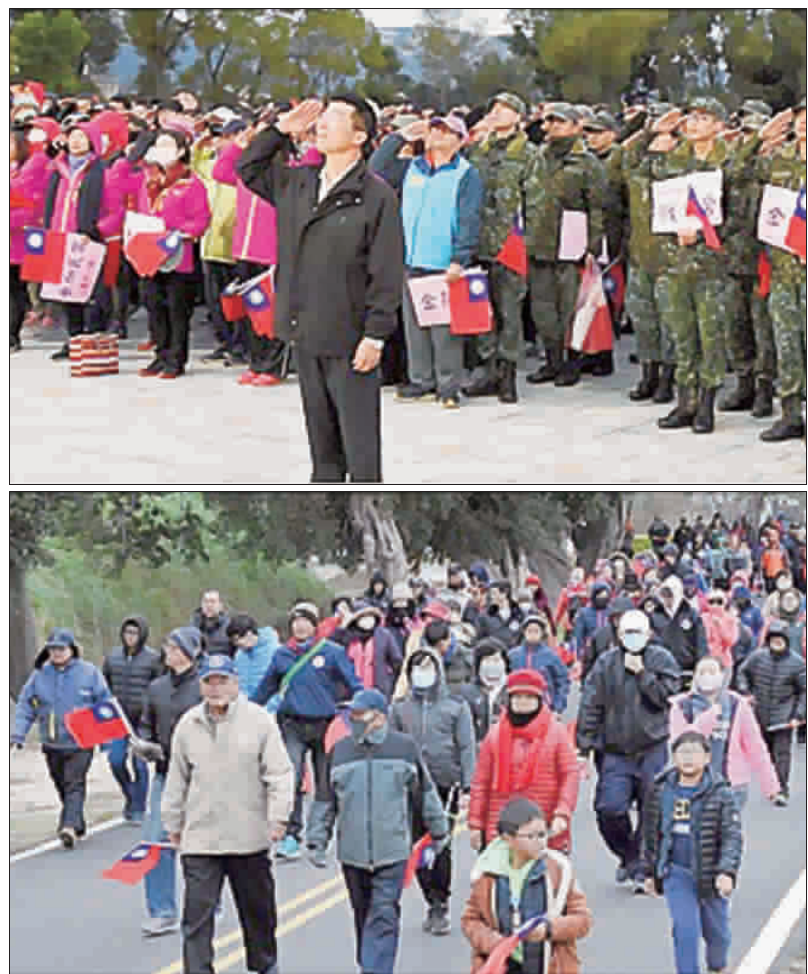
上、下：金沙鎮108年元旦升旗活動，昨日假金沙國小舉行，鎮長吳有家率領熱情參與的軍民學子，升旗唱國歌並健走迎新年。

記者陳冠霖／金湖報導 一元復始，萬象更新！昨（一）日是108年元旦，金湖鎮公所所屬各小學升旗典禮與升旗健走典禮，隨即展開。金湖鎮公所特別製作的「金湖鎮」，與高榮烈。 升旗典禮昨日早上舉行元旦升旗典禮。許多人都是衝著金湖鎮公所今年準備的「金湖鎮」而來，該圍巾為國旗紅藍白配色，有2019、壹零捌字樣、小豬圖案，以及印有「金湖」、「諸事大吉」等小朋友拿到圍巾之後，立刻迫不及待圍在脖子上，直呼這樣就不冷了。 今年是陳文顯上任金湖鎮長後第一次元旦升旗典禮，他致詞時表示，升旗健走活動為慶祝108年元旦，激發全民精神團結及愛國情操，提倡全民健身運動風氣，推廣居民實際參與運動，落實促進國民身心健康，歡喜邁向新的一年，同時祝大家新年快樂、萬事如意，也希望大家新的一年要像健走這樣多運動，保持身體健康；陳文顯強調，新的一年鎮公所會更盡心盡力為鎮民服務，也特別感謝鎮代會及所有鄉親對於鎮公所的支持。