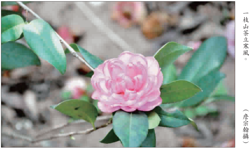
山茶花 别名 耐冬

【本報訊】隨著網購的普及，不法商家利用網路進行詐騙的案數也隨之增加。縣警察局刑大提醒市民，網購時應提高警覺，切勿因貪小便宜而輕信網路，以免蒙受損失。警方指出，目前網購行情差太大，許多商家利用價格優勢吸引消費者，但其中不乏詐騙集團。