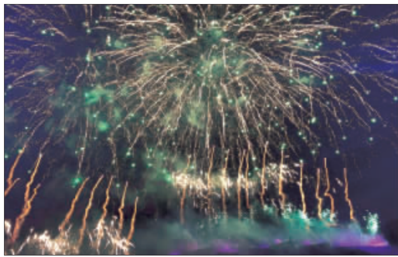
蘇格蘭愛丁堡煙火秀在有數百年歷史的古堡上空施放，相當壯觀。

【中央社巴黎31日綜合外電報導】施放煙火加上慶祝活動，狂歡群眾迎接新年，從亞洲一路往西到歐洲、美洲，全球慶祝活動接力，宣告結束過去一年的紛擾。 法新社和英國「每日郵報」(Daily Mail)報導，全球跨年慶祝從澳洲展開，以雪梨史上最大規模施放煙火，照亮港口天際線，長達12分鐘之久。 在香港，數十萬午夜派對群眾擠滿維多利亞港兩旁，觀看10分鐘的煙火秀，這場秀耗掉180萬美元(約新台幣520萬元)。 印尼雅加達，逾300對佳偶參加政府舉行的集體婚禮，以迎接新年到來。 不過，印尼今年取消煙火秀，以表示對12月22日逾40名海嘯難童致哀。 在中東杜拜，煙火點亮全球最高樓哈利法塔(Burj Khalifa)的天空，觀賞群眾欣喜不已，而鄰近的高塔拉斯海瑪(Ras Al Khaima)尋求列入金氏世界紀錄最長的煙火施放時間。 在全球新年慶祝中，俄羅斯橫跨數個時區，由遠東區開始，一直到莫斯科市公園舉行音樂和燈光秀，有超過1000個溜冰場為民眾歡樂開放。