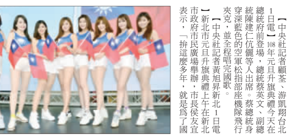
新北元旦升旗，國旗女孩吸晴。

【中央社記者張榮祥台南1日電】今天是元旦，台南市長黃偉哲在新化虎頭埤主持升旗典禮，他期勉市府團隊在新的一年，疼惜鄉土，苦民所苦。 【中央社記者鄭文燦在元旦升旗典禮上許下5個願望，盼藉此讓桃園城市轉型，讓市民生活更好。他同時也期許，民進黨可以檢討、改革、接地气，以人民的感受為出發點，找出新的方向。 【中央社記者梁琨綺台北1日電】新年快樂！台北市長柯文哲昨晚，迎接2019年，他說，「不管什麼酸酸甜甜，2018年即將結束，讓台灣向前走，迎向2019。」