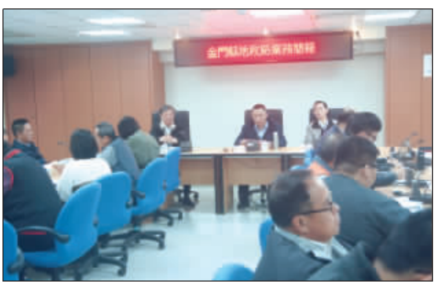
縣長楊鎮浚聽取地政局業務簡報。

縣長楊鎮浚指出，本縣特殊的歷史背景，非常多的土地問題是很難處理，但在地政局團隊辛勤努力下，已經處理非常多土地問題，地政人員所付出的心力和成果，他表示肯定之意。 楊鎮浚說，切身權益往往是最敏感，也最為在乎的事，還有很多因主、客觀因素，還無法處理的土地問題，有賴大家共同