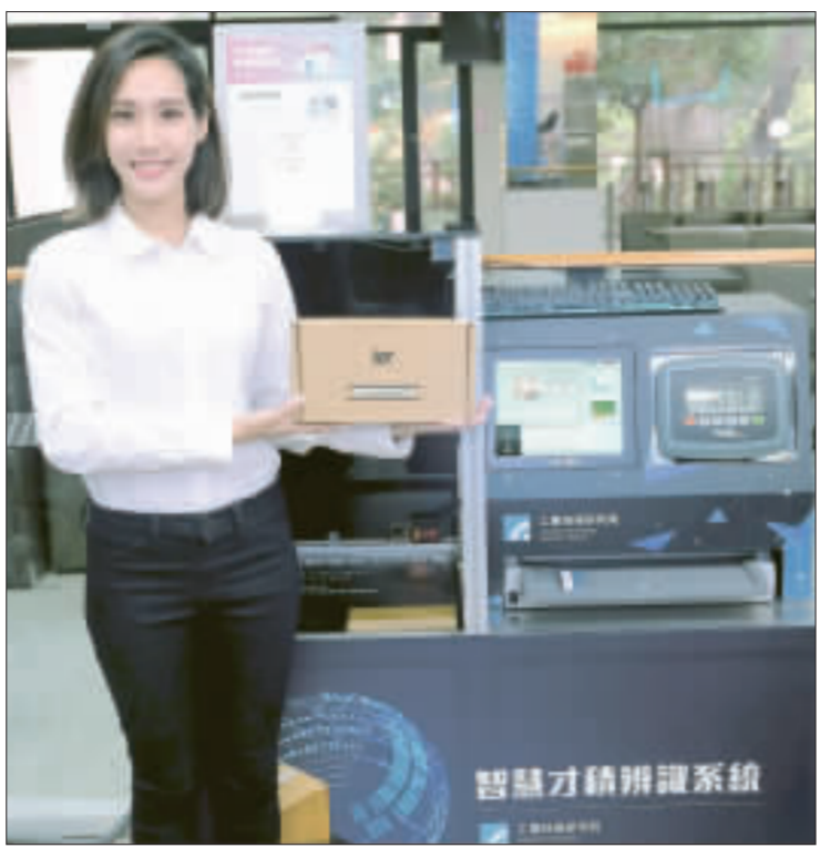
萊爾富的「科技概念店」主打7大科技應用，包括：盤點自助車、才積辨識、人脸识别、熱區偵測、人流偵測、互動看板與電子標籤等。

繼超商雙雄分別在去年開設科技應用店、萊爾富也推出科技概念店，打出7項科技應用輔助人力，減少店員繁瑣勞務，更能專注於服務及與客人互動上。 便利商店導入科技設備已成顯學，繼統一超商在去年推出首間無人商店，全家超商開設科技概念店後，萊爾富也推出科技概念店。萊爾富超商與工研院合作，於去年11月底在交通大學開設首間科技概念店。 萊爾富的「科技概念店」主打7大科技應用，包括：盤點自助車、才積辨識、人脸识别、熱區偵測、人流偵測、互動看板與電子標籤等。 萊爾富運用盤點自助車、電子標籤與才積辨識等3大技術減少店員工作。萊爾富表示，「盤點自助車」會依照設定路線與時間自動盤點架架上庫存，提供店員補貨資訊，節省巡視商品時間與來回路程；而「電子標籤」能遠端設定變價資訊，不僅省去更換標籤時間，也能省去列印紙本標籤，達到環保效益。 萊爾富表示，使用科技設備目的並非取代人力，而是將人力去做更具意義的事，像是更換價格標籤、補貨上架等有科技輔助後，可以讓店員減少繁瑣勞務，讓店員能更專注服務、與客人互動。 另外，萊爾富說，「大數據統計」包含人流偵測、熱區偵測與人脸识别。「人流偵測」是藉由攝影機偵測，計算進出商店人次，提供人流流量資訊，搭配「熱區偵測」進階觀察特定區域的停留人數與時間，提供門市熱點分析資訊，藉由人脸识别系統，分辨來店客層的年齡、性別與到訪次數等數據。以3大技術搜集數據，以達到未來精準行銷。 除了智能科技店的發展，萊爾富預計今年將在人潮較多的門市新增自助型結帳區，達到人潮分流，節省民衆排隊時間與減少門市員工工作量。 (中央社)