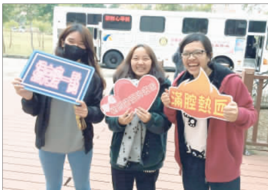
金大學生響應快樂捐血活動。