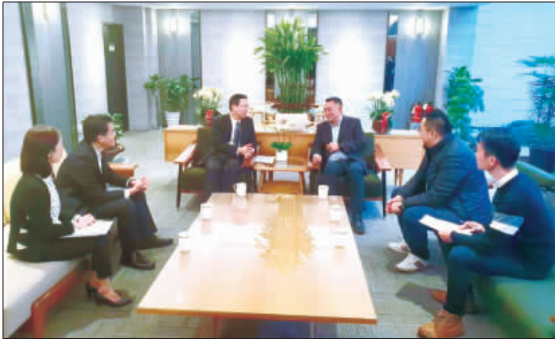
縣長楊鎮浚一行，昨拜會民航局長林國顯，就春運工作請民航局全力支持協助。

網址： http://www.digit.gov.tw/kimmen/ (建議使用IE瀏覽器登錄，以免登錄錯誤)。縣府觀光處表示，調查系統並非「訂位系統」，調查期間結束後，縣府將儘速彙整機位需求向民航局及航空公司爭取增加開班機位疏運，俟確認加班機位後將另行於縣府網站及金門日報等媒體公告相關事宜。