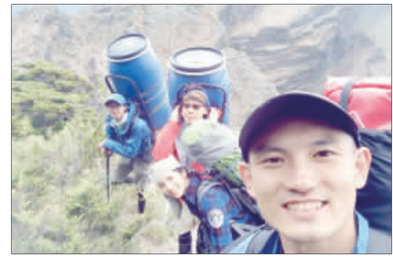
上、下：50多名熱愛爬山的志工，花3年，在29個高山山屋建置加壓艙。