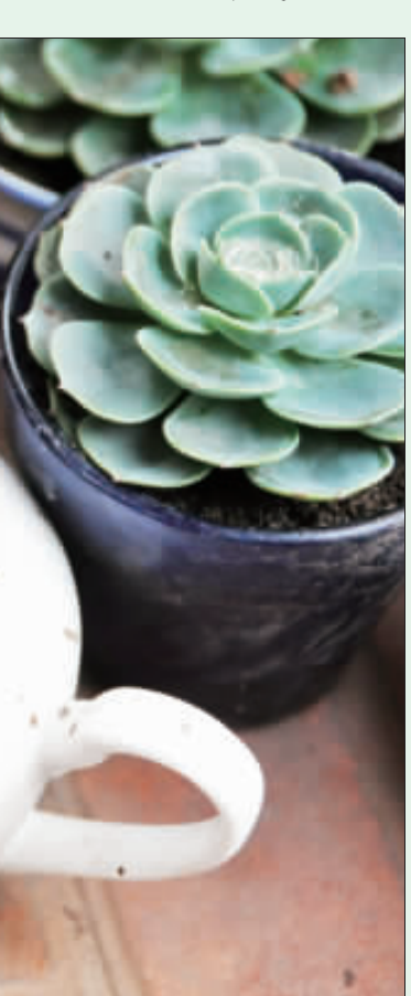
圖文/李增旺 只要一些巧思,廢棄的小茶壺,也能因著種上一些多肉植物,顯得逸趣橫生,讓人賞心悅目。