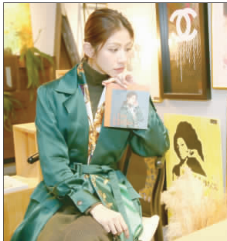
「台語就像家人，是在心裡很緊密的一條線，好像永遠不會斷。」歌手李千那接受中央社專訪時表示，11年前比賽時，當下覺得離夢想更接近了一點，「那已經是很不可思議的事情」，如今完成夢想，讓她直呼「很不真實」。