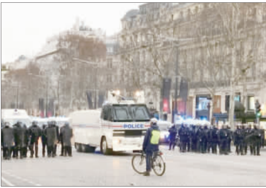
法國「黃背心」運動發起連續第9個週末的街頭行動，憤怒的抗議者中，有人希望政府重組，有人甚至要求制定更民主的憲法。

【中央社記者曾依璇巴黎12日專電】法國「黃背心」運動發起連續第9個週末的街頭行動，憤怒的抗議者中，有人希望政府重組，有人甚至要求制定更民主的憲法。在1月5日的第8波街頭行動中，有抗議份子用巴黎用機具破壞政府發言人葛里沃(Bernadine Grievart)辦公室所在的建築物，闖入法院破壞車輛，還有退後拳擊手毆打警察；西部城市勒恩(Rennes)市政府及南部城市比讓(Briançon)的法院也被攻擊。