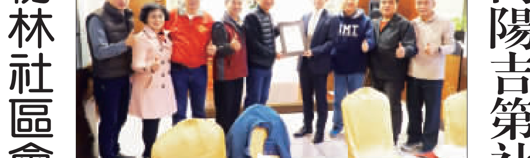
向陽吉第社區發展協會感謝各界協助，特別致贈感謝狀，並與現場貴賓合影。

記者許峻魁／金城報導 金城鎮向陽吉第社區發展協會日前舉辦第六屆第三次會員大會暨聯誼餐會，並在餐會中，邀請社區成員們一起聯歡，並在餐會中，邀請社區成員們一起聯歡。