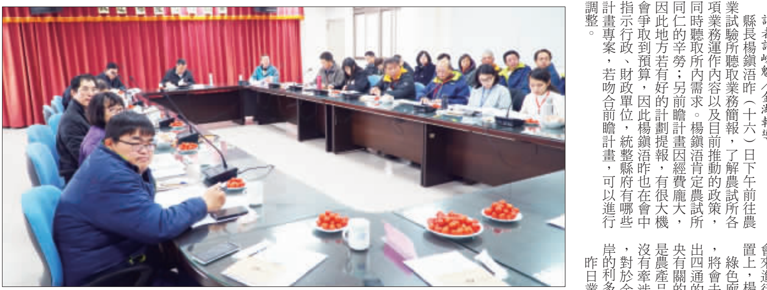
楊鎮浚昨日前往農試所，聽取業務簡報。

記者許峻魁/金城報導 縣長楊鎮浚昨(十六)日下午前往農業試驗所聽取業務簡報，了解農試所各項業務運作內容以及目前推廣的政策，同時聽取所內需求。楊鎮浚肯定農試所同仁的辛勞；另前計劃書經費龐大，因此地方若有好的計劃提報，有重大機會爭取到預算，因此楊鎮浚昨也在會中指示行政、財政單位，統整縣府有哪些計畫專案，若符合前計畫，可以進行調整。