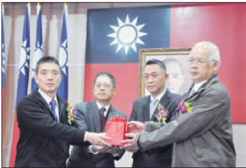
縣長楊鎮浩昨日主持上任後第二波原新任首長佈達交接典禮，他期勉新任首長，不管在何位置服務，都要在工作崗位上把角色扮演好。