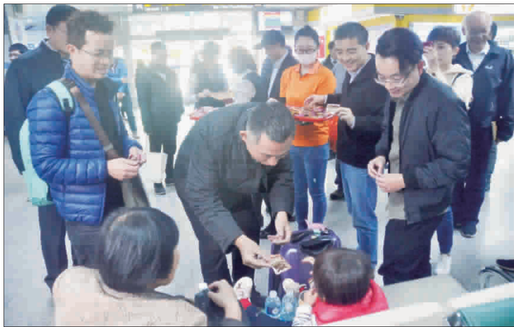
金門豬肉製品沒問題 饋贈親友最佳伴手禮

三、公訂訂票作業時間：自一月二十一日(星期一)上午九時起，由各航空公司訂位電話及網路公開接受訂位。 縣府提醒表示，鄉親於訂票時應注意：(一)訂票時間：訂票時間為一月二十一日(星期一)下午四時前依航空公司的通知或指示限期開立機票，同時特別呼籲本波第三波加班機開立機票與規定限制與前兩次管制期間訂票作業程序一樣，即今年春節假期期間金門航線(108年1月31日至2月6日)臺灣往金門及108年2月6日至2月11日金門往臺灣)針對離島航線實施機票加註「限當日當班次有效」，「運至運航班起飛前辦理退票」及「逾期作廢」等措，請鄉親特別注意。