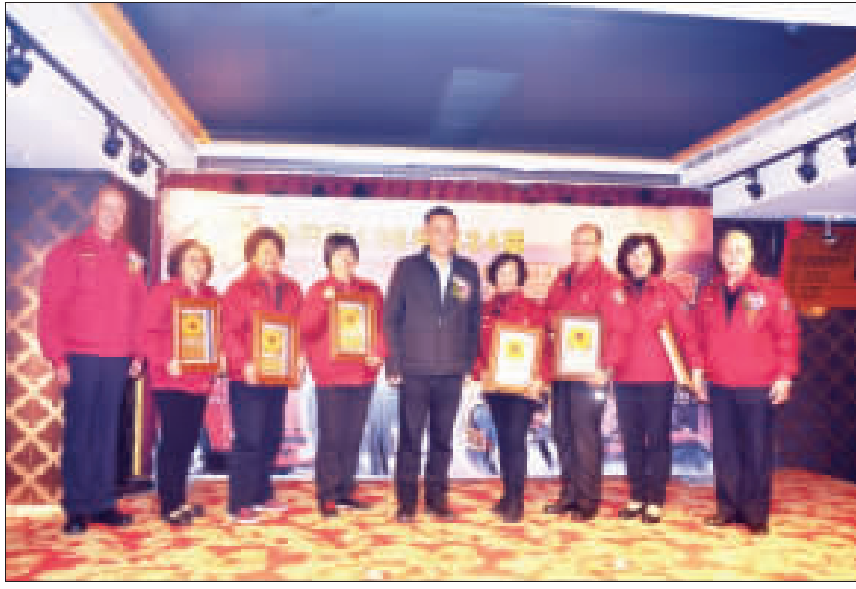
左、右：金門縣消防局舉辦第廿四屆消防節慶祝表揚大會活動，縣長楊鎮浚頒發表揚績優消防、義消、志工人員及參加各項比賽績優人員。

記者李金鐘／金城報導 金門縣消防局舉辦第廿四屆消防節慶祝表揚大會活動，縣長楊鎮浚頒發表揚績優消防、義消、志工人員及參加各項比賽績優人員。表揚大會由縣長楊鎮浚主持並頒發表揚20位績優消防、義消、志工人員，轉頒6位內政部消防署106年全國消防績優救護人員，頒發消防宣傳電影得獎單位，致贈6位退休消防、婦宣人員紀念牌，另為感謝國軍及高雄港務消防隊水頭港分隊、金門航空站長期協助本縣執行救災工作，因此特別致贈感謝狀，典禮簡單隆重。 過去一年裡，本縣消防局在全體同仁的努力下，無論是在年度消防工作評核、災害防救業務訪評、災害防救演習均受中央高度肯定，獲評全國特優，也在本縣縣運會、全國消防技能大賽都獲得優異的成績。另外，在全國健康城市暨高齡友善城市獎項都能憑藉過人的創意獲得「金點獎」的獎項，縣長特別表示肯定全體消防同仁的辛勞。 縣長楊鎮浚致詞時表示，很高興獲得消防、義消、志工人員努力付出表現而獲得表揚，在每一個頒獎和頒發各項獎項過程中，我內心深感敬佩與謝意，就因為消防職責犧牲奉獻努力付出，為地區消防工作來把關，所以鄉親才能過著穩定的生活。讓與會各項獲獎的成績表現，都讚不絕口給予高度肯定。對於消防局與義