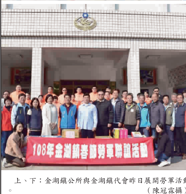
上、下：金湖鎮公所與金湖鎮代會昨日展開慰勞軍警消活動。