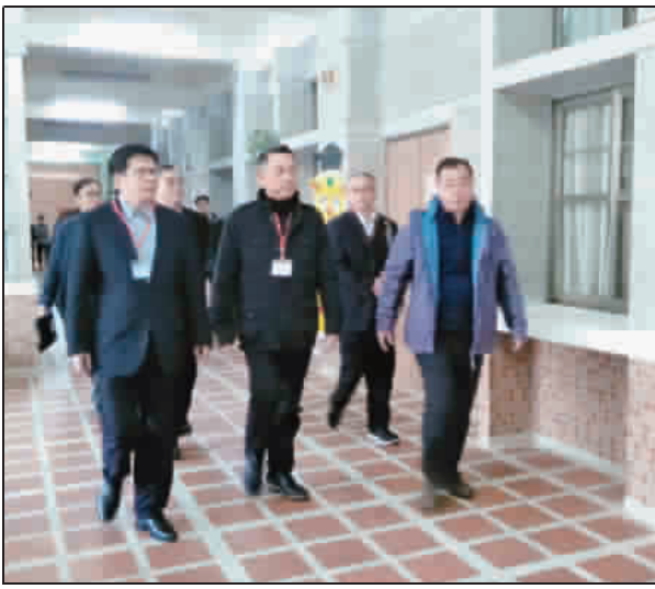
學測昨起在金大舉行，縣長及金大、金中校長前往為考生打氣。

主嫌為治平專案對象年僅22歲 宜蘭來金約1年 警查扣被害人本票及支票數十張金額達1283萬元等證物