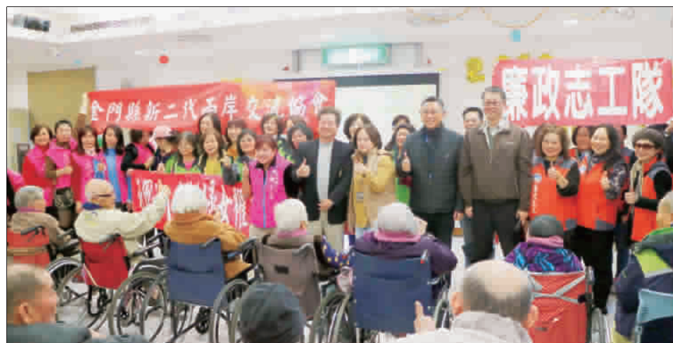
縣長楊鎮浩昨日展開社福機構慰問行程，發送慰問金給長者及園生。

記者陳冠霖／綜合報導 春節將至，縣長楊鎮浩昨(25)日展開社福機構慰問行程，陸續走訪蘭湖日照中心、晨光教養家園、金門監獄、福田家園、松柏園等機構，發送慰問金給長者及園生，以及團體加菜金。 這是楊鎮浩就任後首度的三節節日，他昨日在社會處長董崇陪同下，展開社福機構慰問行程，一連走訪蘭湖日照中心、晨光教養家園、金門監獄、福田家園、松柏園等5站，關心長者健康、園生生活、弱勢照顧需求等，並各別致贈慰問金和加菜金傳達春節祝福，慰問場面溫馨，一片提前歡慶佳節的氣氛。 楊鎮浩致贈加菜金給蘭湖日照中心、晨光教養家園、金門監獄、福田家園、松柏園等社福機構外，並向所有辛勞的照顧人員、社工及單位工作人員致意，感謝大家平日無私付出照顧弱勢鄉親，並提前祝賀佳節快樂，逐一向園生與長者們發送加菜金及紅包，祝賀阿公阿婆平安。 在蘭湖日照中心，楊鎮浩和長輩們噓寒問暖；來到晨光教養家園，楊鎮浩讚許晨光在照顧弱勢上的付出；在金門監獄，楊鎮浩和典獄長討論監獄目前收容情形；在拜會福田家園與松柏園時，也在園方人員的帶領下，與園內就養民眾們閒話家常，楊鎮浩也親自為老人家圍圍圍巾。楊鎮浩強調，地區有許多弱勢團體待關懷，縣政府除了進行弱勢慰問外，其他重要節日也會派員前往關懷，期望縣府的行動能起帶頭作用，吸引社會各界捐助弱勢族群。 社會處表示，昨日慰問行程，發給蘭湖日照中心每人1000元(共30人)、晨光教養家園每人2000元(共24人)、福田家園每人2000元(共78人)、松柏園每人1000元(包括大同之家共103位)，並發給每個單位包括金門監獄團體加菜金各2萬元。