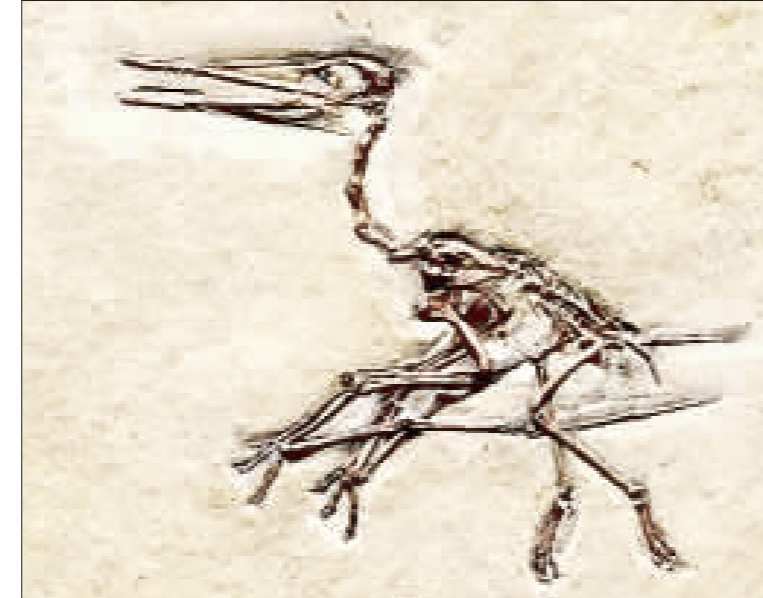
翼龍目能飛行脊椎動物

記者李增汪／金城報導 喜歡自彈自唱嗎？傳統音樂館邀請國小三年級以上的朋友們一起來學習彈奏烏克麗麗，自1月28日起至2月1日止，星期一至星期五，在邱良功古厝開課。以最容易入門的烏克麗麗四絃琴彈奏，彈唱新年歌曲，當代名曲，還有金門歌謠、傳統曲調。融匯經典與潮流音樂藝術，提供青少年學子寒假活動，快樂樂樂過新年！