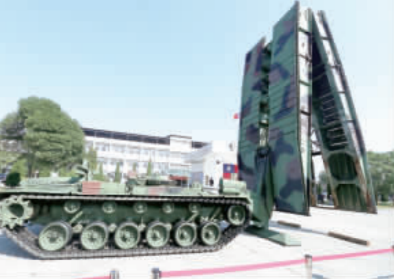
陸軍第六軍團指揮部第53工兵群官兵們展示履帶機動橋。

【中央社訊】侯安琴桃園25日電】農曆春節將至，總統蔡英文今天赴陸軍五三工兵群慰勉官兵時表示，去年花蓮地、五三工兵群與她一同搭機到當地，也祝賀在場大家新年快樂。 致詞最後，總統特別提陸軍國防部部長、總長、陸軍司令要好好的照顧官兵，並表示，官兵是國家的棟樑，也是我的戰友，官兵是國家的棟樑，也是我的戰友，官兵是國家的棟樑，也是我的戰友。