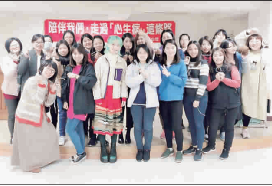
衛生局舉辦藥癮去汙名化課程講座。

記者陳冠霖／綜合報導 金門縣衛生局近日公布107年度「藥癮個案戒治」服務成果，共補助54位藥癮個案接受醫療戒治，並辦理毒品防制宣導12場次、特色藥癮醫療成果宣導1場次、志工毒防專業教育訓練3場次及赴台交流1場次。衛生局強調，將持續在藥癮議題上努力，讓藥癮個案與藥癮者不再孤單。有需要請洽金門縣毒品危害防制中心，電話：082-337515。 衛生局表示，於107年度起依據《金門縣藥癮個案戒治服務費用補助實施要點》，共計補助54位藥癮個案（含一、二級毒品成癮者）接受醫療戒治。 衛生局指出，藥癮是一種慢性疾病，透過至衛生福利部金門醫院穩定就醫、毒品危害防制中心追蹤輔導及轉介就業等，協助藥癮個案順利復歸社會、延緩藥癮復發及降低再犯率。 衛生局表示，107年度共辦理藥癮認識、戒治及毒品危害防制宣導12場次，本縣特色藥癮醫療及處遇服務成果宣導1場次，並至社區及金門大學社會工作學系招募對毒品危害宣講、陪伴藥癮者有興趣、熱忱者加入毒品危害防制中心志工，另針對志工辦理藥癮輔導及毒防專業教育訓練3場次及赴台交流1場次。 衛生局指出，脫「癮」而出的路雖然漫長，但隨著民眾對藥癮的認識與理解而逐漸去汙名化，衛生福利部金門醫院提供美沙冬替代藥物給藥窗口及戒癮門診使個案穩定就醫，本縣毒品危害防制中心各網絡單位的協助與資源媒合等，衛生局將持續在藥癮議題上持續努力，讓藥癮個案與藥癮者家屬不再孤單，「再大的難題，讓我們一起面對」。