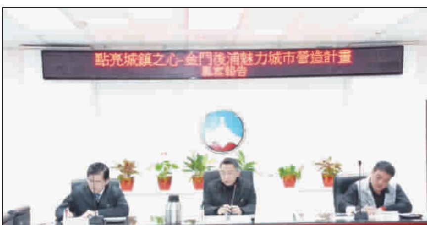
縣長楊鎮潁上任來首次主持「點亮城鎮之心—金門後浦魅力城市營造計畫」專案報告會議。

記者莊煥寧／縣府報導 縣長楊鎮潁上任來首次主持「點亮城鎮之心—金門後浦魅力城市營造計畫」專案報告會議。他表示，城鎮之心計畫對金門來說是重大工程，同時也是改善改變整個金門結構，立意良好，也是改善改變整個金門結構，立意良好，也是改善改變整個金門結構，立意良好。城鎮之心計畫對金門來說是重大工程，同時也是改善改變整個金門結構，立意良好，也是改善改變整個金門結構，立意良好。