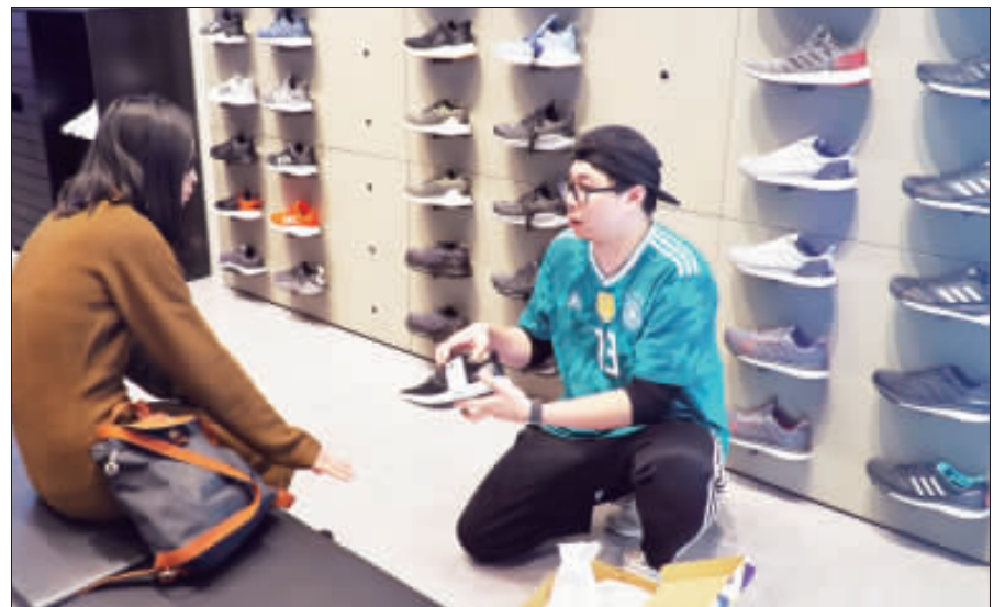
adidas專賣店開幕，消費者購物詢價。

自己本身就是一本好書，閱讀不僅可以讓生活更充實，文化水準提升，捐書更可帶來借福愛物觀念之推廣，歡迎民衆打包家中藏書，共襄盛舉這次活動。歡迎大家拿兒童繪本、青少年讀物、勵志及休閒文學廣告文宣、特定宗教及限制級圖書則不在捐書及交換範圍。書籍是人類共享的資源，任何一本閒置的書，都是資源浪費。或許您有讀過的好書想與更多人分享，卻不知道怎麼辦？金門縣文化局圖書館舉辦的好書交換，正好可以將舊書交換的管道，讓民衆可以將好書的生命延續下去。 收書原則：圖書封面及內頁須清潔完好，無破損、污損或塗鴉情形者。電腦類書籍須最近2年內出版者。視聽資料CD、VCD及DVD均不收。凡大學以下各科書、各縣市政府機關出版品、各機關學校藏書、不讀之書、明顯破損的書籍、宗教類書、贈閱書籍或報章雜誌、磁碟片、錄音帶及錄影帶等皆不收。凡違反法令、善良風俗或盜印、盜版、盜錄、盜拷之圖書資料及文化局圖書館認定不宜交換者一律不收。捐贈及交換之雜誌請以知識類雜誌為主。例如：《小南風》、《國家地理雜誌》等。蓋有金門縣文化局或其他縣市漂書印章不納入捐書與交換範圍。民衆所提供交換之圖書資料，文化局擁有處理權，人員認定內容如有爭議，依圖書館服務人員認定為準。 捐書方式：請將符合捐書原則之圖書資料，於即日起至3月31日活動時間內，送至捐書地點金門縣文化局北棟成人圖書館一樓流通服務檯，由文化局工作人員核實後發給「好書交換券」一張，一本圖書資料可核發「好書交換券」一張，集滿15點送100元禮券（數量有限，送完為止）。集滿300元禮券（數量有限，送完為止）。 換書方式：如不兌換禮品，可選擇將符合收書條件之圖書，由文化局工作人員核對後發給「好書交換券」一張，於現場以1本書交換1本書、2本書換2本書方式交換好書，以此類推，挑選等數量圖書（即一件圖書資料可兌換好書交換券數點數1點，好書交換券1點可兌換圖書資料一件）。