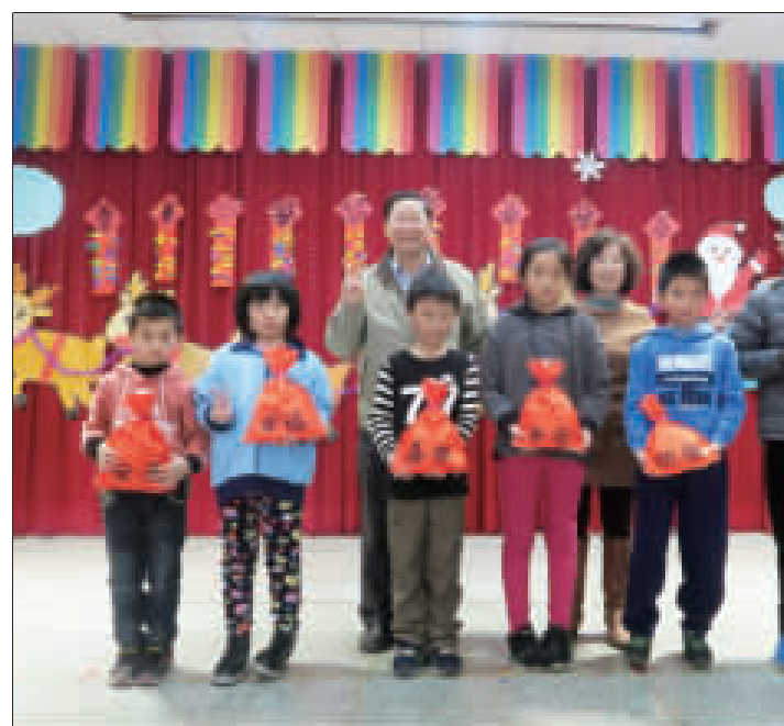
古城國小送給全體師生福袋，祝福新的一年平安、圓滿。

記者李增廷／綜合報導 農曆春節9天連假快到了，有積欠稅款已被限制出境者，若行前可別忘了，先繳清欠稅或提供相當擔保，才能解除出境限制。 國稅局表示，依稅捐稽徵法第24條第3項規定，個人欠繳稅捐在20萬元以上，或在行政執行程序終結前，個人欠繳稅捐在50萬元以上，營利事業在30萬元以上者，經稅捐稽徵機關依法審酌符合限制出境條件者，即報由財政部函請內政部移民署限制個人或營利事業負責人出境。 國稅局特別提醒民眾，納稅全部欠稅及罰鍰或提供全額擔保後，方得解除出境限制，若僅繳納部分稅捐或向行政執行分署辦理分期繳納，在稅捐未全部繳清前，仍不可以解除出境限制，所以如有欠稅請儘速繳清或辦妥足額擔保手續，再準備出境事宜，以免無法出境致行程受阻，破壞出國渡假的好興致。