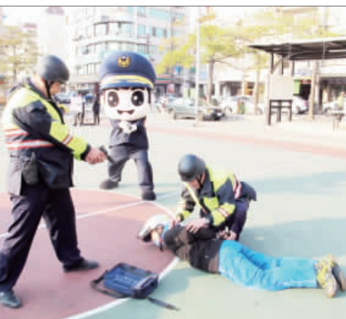
金湖分局在土地銀行山外分行舉行防搶演練。

記者陳冠霖／金湖報導 土地銀行遭搶，金湖分局在土地銀行山外分行舉行防搶演練，演練設定有歹徒闖入土地銀行要搶劫，銀行行員報案後，金湖分局警員立即啟動快打及攔截圍捕機制，成功逮捕歹徒。金湖分局局長張文峰表示，春節期間警方將持續規劃有效率之勤務作為，以防制任何治安事故發生，不讓不肖之徒有可乘之機。 春節前夕，民衆提、存款機會頻繁，為預防金融機構遭受歹徒搶劫或持槍強盜財物等傷人案件發生，金門縣警察局金湖分局特別與土地銀行金門分行新市里辦事處聯合舉行防搶演練，以增強民警快速反應及金融機構員工對各種狀況處置能力。 金湖分局表示，本次演練假想土銀新市里辦事處對外營業結束，即將拉下鐵捲門前，突有歹徒闖入行搶，旋即往大門逃竄，金湖分局接獲報案後，立即啟動快打及攔截圍捕機制，成功逮捕歹徒。 金湖分局指出，「金融機構防搶演練」25日下午進行無預警測試演練，並做成成果演練相互觀摩學習，充分展現「快速打擊犯罪警署」具有快速、機動、專業、訓練有素等特性，展現「維護治安、打擊犯罪決心」。 金湖分局局長張文峰表示，為了讓民衆生活安定，不會因春節假期而跟著停擺，這場演練提醒金融業者應隨時保持警覺心，同時測試警方之緝捕能力，現場民衆對警方能在如此短時間內將搶劫嫌犯捕獲到案，均深表肯定。警方將持續規劃有效率之勤務作為，以防制任何治安事故發生，不讓不肖之徒有可乘之機。