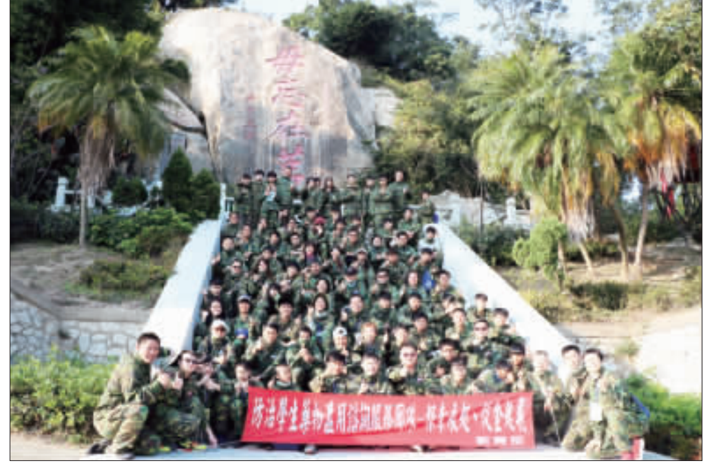
全國諮服團齊聚金門，校外會規劃三天兩夜多元活動。

記者許煥堯／綜合報導 一份送該局辦理，收件時間以郵戳為憑。 依據「金門縣環境教育審議會設置要點」中規定，金門縣政府為審議、協調及諮詢本縣環境教育行動方案，促進轄內環境教育實施與發展，依環境教育法第十二條第一項規定，設置審議會。審議會可上金門縣環境保護局網頁（ https://epb.km.gov.tw/ ）下載。環境局指出，第四屆「金門縣環境教育審議會」歡迎推薦具有環境教育、自然保育、公害防治、環境資源管理、氣候變遷、災害防救、社區參與等相關專長之專家學者及民間團體成員。並請於2月28日（星期四）前檢附推薦表及相關證明文件（如：著作、資歷、績優或獲獎等證明文件，著作部分影印封面即可）。各一份送該局辦理，收件時間以郵戳為憑。