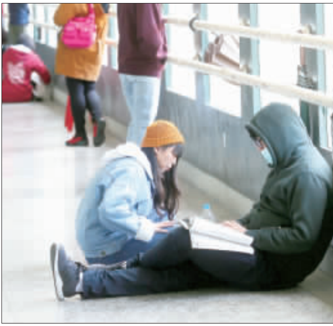
大學學測26日進入第2天考試，遇上強烈大陸冷氣團來襲，不少考生戴上口罩、帽子，在應試前做最後複習。(中央社)

【中央社記者許秩維台北26日電】108學年度學測今天下午考完，大考中心表示，為逐步接軌108新課綱，學測命題也開始增加結合生活情境和跨領域的素養題，如社會科就出現不少合科考題。 大學入學考試中心主任劉孟奇表示，108新課綱預計108學年(今年8月)上路，配合新課綱的大考新制度會在110學年正式推動，因此108學年至110學年的大考命題仍是遵循現行的108課綱，不會有太過劇烈的變動。 108新課綱強調素養導向，劉孟奇指出，素養導向的特色就是結合生活情境和跨領域，為了逐步接軌新課綱，大考命題近年來也開始慢慢增加素養題型，今年社會科就出現不少融合歷史、地理、公民的合科試題，也與新課綱上路後，不同學科教師共同備課的教學現場相呼應。 劉孟奇也表示，今年學測還有