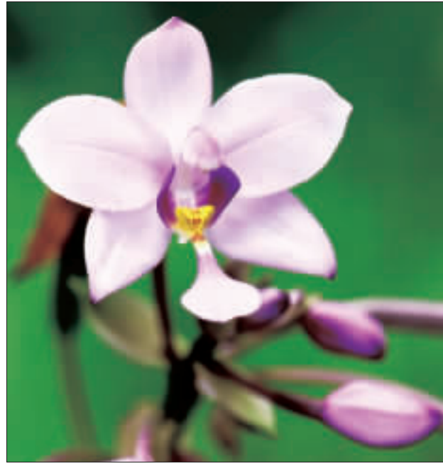
特有生物研究保育中心企劃拍攝瀕絕植物紀錄片「絕處逢生：讓瀕絕植物回家」，記錄帶瀕絕植物的紫苞舌蘭回蘭嶼行動，勇奪美國國際金動章國際影片競賽3項卓越大獎。

些微調整，大考中心特別請命題老師提升試題的易讀性，不要使用大艱澀的文字，在試題文字量上，命題的頁數和去年相同，但印製成試卷時，特別採用寬鬆的排版，避免文字過於密集，方便考生閱讀，圖表也都變大，以利考生從中擷取資訊。 【中央社記者許秩維、陳至中台北26日電】學測今天第2天考試，第1科考數學，試題結合跑道長度、公投案等生活情境。台北市高中數學科教師團表示，今年數學試題沒有太複雜的計算，是近年最簡單。 【中央社記者許秩維台北26日電】學測今天第2科考國文，貼近生活經驗，包括對中小學禁食含糖飲料的想法，作文題目「溫暖的心」除了談包容理解，也可思考如何不濫用善意，如近期長榮空服員受辱事件。 【中央社記者盧大城台東縣26日電】108學年度大學入學學科能力測驗最後一堂自然科測驗，台東考生普遍認為，題目偏難、偏活，由於申請入學管道採取「備選4」的方式，有些社會組考生乾脆提早放棄。