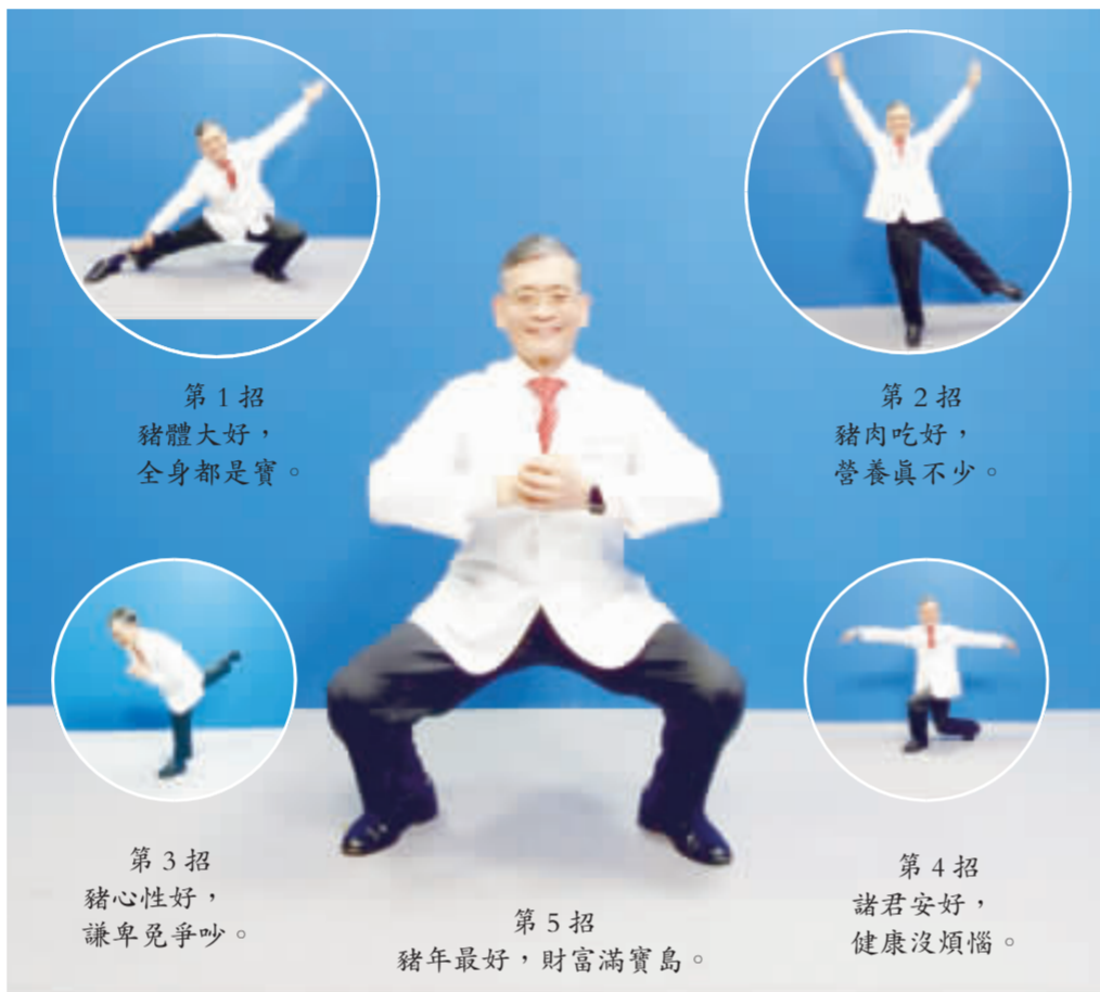
第1招 豬體大好，全身都是寶。 第2招 豬肉吃得好，營養真不少。 第3招 豬心性好，謙卑免爭吵。 第4招 諸君安好，健康沒煩惱。 第5招 豬年最好，財富滿寶島。

癌症患者福音，健保署開會達成共識，將3款免疫療法藥物納入健保，可治療8種癌症，將耗資新台幣8億元，預計可治療800名無藥可醫的癌症患者，最快6月底上路。 衛生福利部中央健康保險署召開藥物共擬會議，決議通過將3款癌症免疫檢查點抑制劑(ICI)納入健保給付。 健保署醫審及藥材組組長戴雪詠說，根據食藥署核准的適應症，這3款免疫療法藥物一共可治療8種癌症，包括黑色素瘤、非小細胞肺癌、典型未分化淋巴瘤、泌尿道上皮癌、頭頸部鱗狀細胞癌、腎細胞癌、肝癌與胃癌。 戴雪詠說，免疫療法藥物今年共編列約8億元預算，在經費有限的狀況下，不可能給付所有的癌症患者，因此僅限於已無其他藥物可使用的患者，並且透過生物檢測確有病變對免疫療法藥物有良好反應者，將於2月共擬會議確認。 她表示，除了確認給付規定外，健保署也將進一步和藥廠協商藥品給付價格，雙方達成共識後，才會正式納入健保給付，最快6月底以前將開放病人使用，以治療800名患者為目標。 戴雪詠強調，免疫療法藥物並非萬靈丹，並不是對每個癌症患者有效，使用後也有可能產生嚴重副作用，在某些癌症的治療效果上，也不會比現有健保給付的標靶藥物效果來得好。 以最早用於治療黑色素瘤的免疫療法藥物為例，約有2成患者有較好治療效果。 健保署去年通過可治療黑色素瘤的一種免疫療法藥物納入健保給付，目前廠商議價仍在進行中。(中央社)