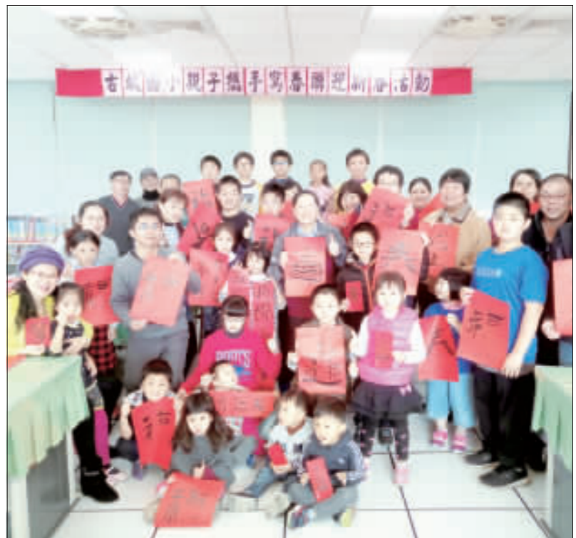
古城國小在農曆年前邀請書法家到校指導學生寫春聯，家裡的年節氣氛自己來布置。