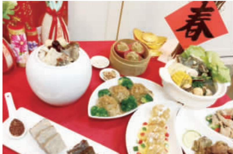
傳統常見年菜一頓恐吃進2600大卡熱量，春節連吃9天恐胖22公斤。