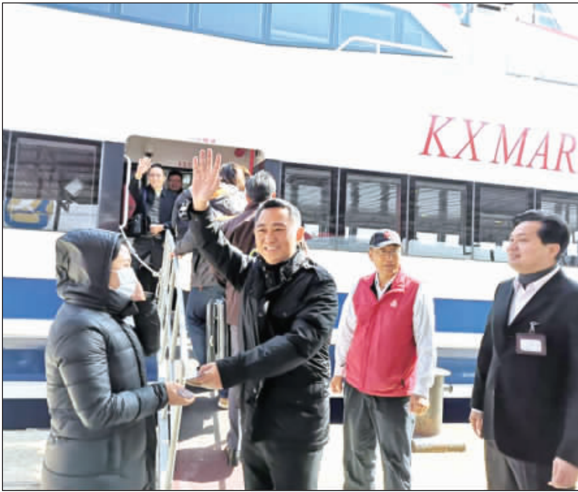
縣長楊鎮渚率團出訪福建，希望能在民生、經濟、環保、交通等方面，和對岸達成一定的共識，幫助金門發展。

表達祝賀之意，她表示，近年來福建與金門，尤其是廈門與金門彼此的融合發展相當穩健，且小三通相當順暢，人員往來密度也不斷提升，且交流活絡，經濟交流同樣穩健成長；而歷經二十多年的金廈通水終於在去年八月正式開通，還成為當時的十大要聞之一。 王玲強調，金門、廈門甚至是福建省不僅是一家人，更是一個中，日前中共總書記習近平發表的「新四通」，她也樂見楊鎮渚在第一時間發表看法，並提出如何推動的政策主張。 而在稍後的餐會中，王玲提及高雄市的水果貨櫃已運抵平潭一事，楊鎮渚則表示，高雄市的動作快讓他備感壓力，不過他認為有壓力是好的，是推動向前進的動力。 楊鎮渚此次大陸的訪問行程，將先後拜會福建省台港澳辦、福建省政府、福建省文化及旅遊廳、泉州市政府、廈門市政府等單位人員，這也是楊鎮渚就任以來，首次的大陸拜會行程，此次行程將於三十日結束後經小三通返金。