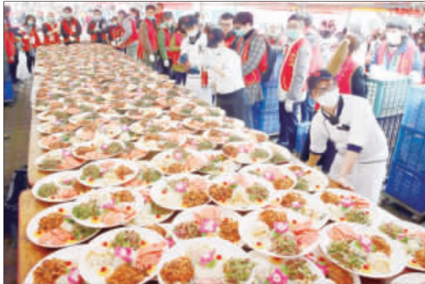
台北場席開2200桌。

【中央社卡利卡薩26日電】委內瑞拉總統馬杜羅，對歐盟要求其在8日舉行新總統選舉的呼籲，予以強烈拒斥。馬杜羅在週五表示，他將繼續履行總統職責，並呼籲國民團結。 馬杜羅在週五表示，他將繼續履行總統職責，並呼籲國民團結。他表示，他已經與國民達成協議，將在未來舉行新選舉。他強調，他將繼續履行總統職責，並呼籲國民團結。 馬杜羅在週五表示，他將繼續履行總統職責，並呼籲國民團結。他表示，他已經與國民達成協議，將在未來舉行新選舉。他強調，他將繼續履行總統職責，並呼籲國民團結。