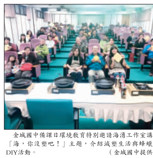
金城國中備課日環境教育特別邀請海湧工作室講授「海，你沒望吧！」主題，介紹減塑生活與蜂蠟布DIY活動。

記者李培江／綜合報導 金城國中備課日環境教育特別邀請海湧工作室講授「海，你沒望吧！」主題，介紹減塑生活與蜂蠟布DIY活動。