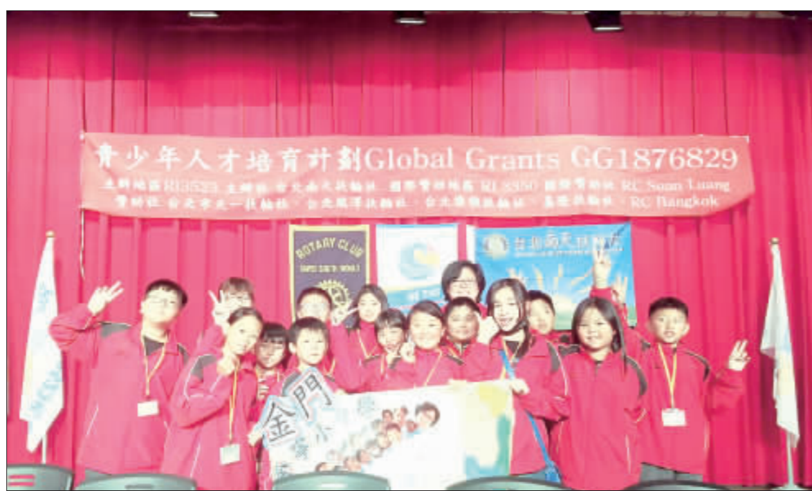
金寧中小學有14位學生和2位老師到台北與名人楷模會談。

分與奮。 由台灣讀寫教育研究學會主辦，國際扶輪全球獎助金計畫、中華文化永續發展基金會、趣·讀冊、小魯文化、親子天下、步步出版和幼獅文化合辦的《築夢·逐夢之旅》青少年人才培育計畫。從九月贈書「聯絡簿」與班級共讀、教學回饋，終於來到階段二「達人約」活動。只要有收到贈書的班級都能參加甄選活動，參加楷模見面會。為期四