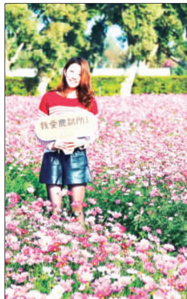
迎春總動員，金門縣政府規劃一系列年節活動，希望藉由豬年的來到，帶給「豬事吉祥」的金門島全體鄉親和訪客不一樣的感受。