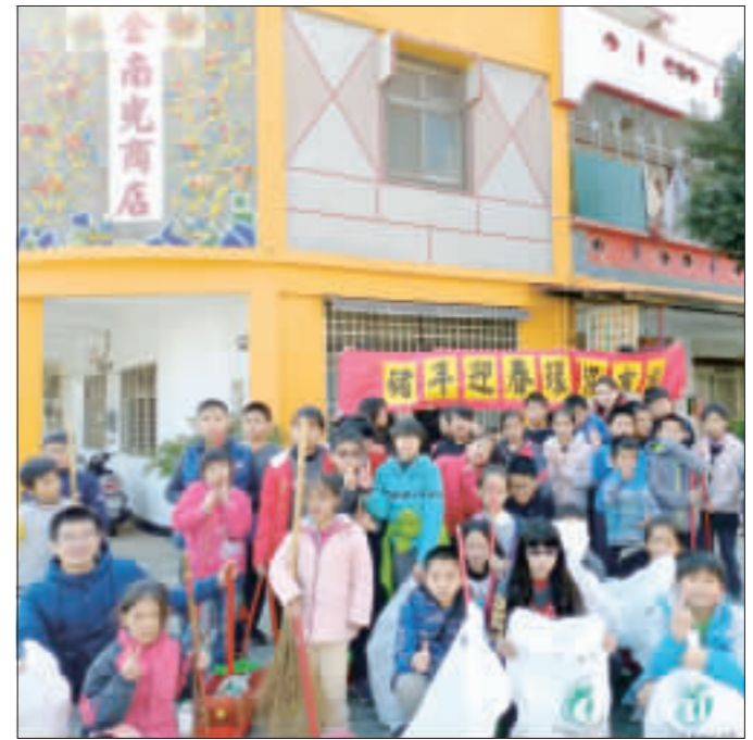
古城國小響應國家清潔週活動，動員全校師生整理社區環境，煥然一新迎新年。