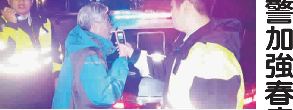
金湖分局執行「加強春節期間安全維護工作」，成果豐碩。

記者陳冠霖／金湖報導 金湖分局自28日起執行「加強春節期間安全維護工作」，首日即查獲2起酒駕、4起闖紅燈、1起嚴重超速，並受理執行舉發外出居住安全維護8件，可說是成果豐碩。 金門縣警察局為讓地區民衆過一個順遂、平安的春節，自1月28日22時起至2月11日24時止，展開為期15天的「加強春節期間安全維護工作」，加強重要節日、安全維護工作，加強春節期間安全維護工作，加強春節期間安全維護工作。