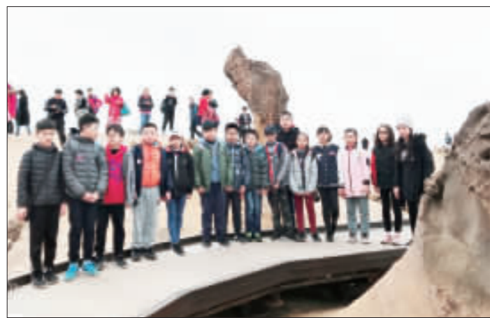
古城國小應屆畢業生赴北台灣畢業旅行，安排人文、生態、自然的旅遊景點，令他們有個難忘的回憶。(古城國小提供)