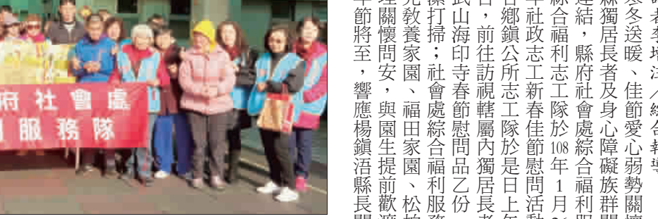
年節將至，社會處綜合福利服務隊志工前往金門縣私立展光教養家園慰問，贈送白米及食用油等慰問品。

記者李增江／綜合報導 寒冬送暖、佳節愛心，金門縣政府為表對本縣獨居長者及身心障礙族群關懷之意及志願服務經驗連結，縣府社會處綜合福利服務隊與五鄉鎮公所綜合福利志工隊於108年1月26日上午9時同步辦理108年社政志工新春佳節慰問活動。 各鄉鎮公所志工隊於是日上午9時在所在鄉鎮公所集合，前往訪視轄內獨居長者表達關懷問安，轉贈大武山海印寺春節慰問品乙份，並協助長輩居家環境清潔打掃；社會處綜合福利服務隊則前往金門縣私立展光教養家園、福田家園、松柏園老人長期照顧中心辦理關懷問安，與團生提前歡慶新春佳節。