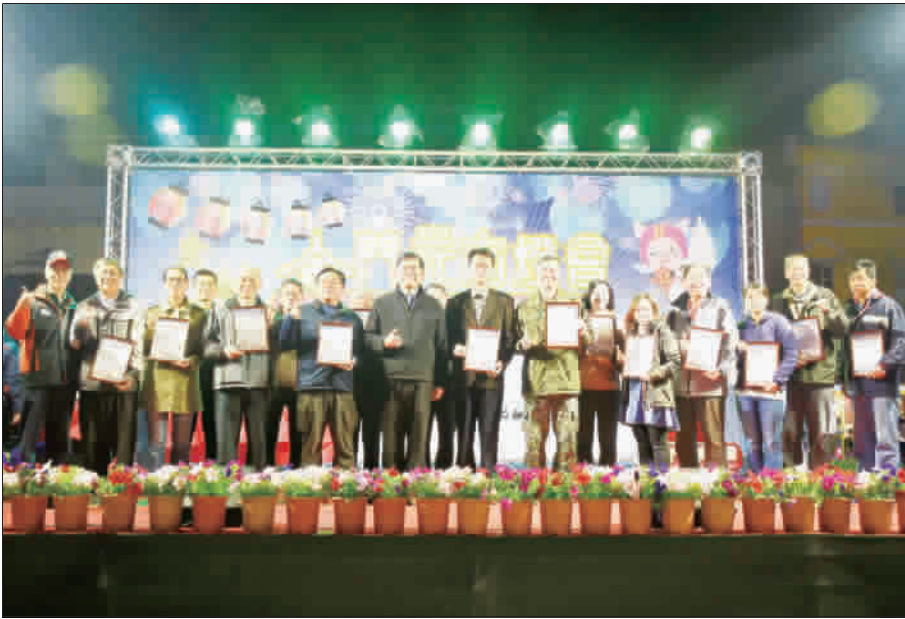
▲元宵花燈比賽頒獎，機關組獲獎者合影。