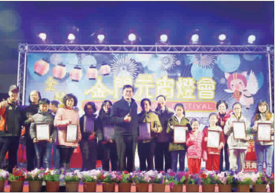
▲學校團體組獲獎者合影。