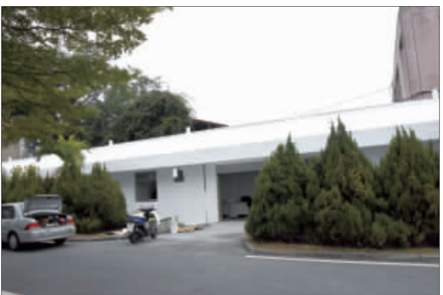
左、右：位於金城鎮民族路的縣立體育館將封館整修，在此過渡期間，體育館除已在體育館後方廣場搭建臨時健身房與舞蹈教室，並將移至金城國中體育館後方的處所進行辦公，以方便民眾運動使用及洽公。