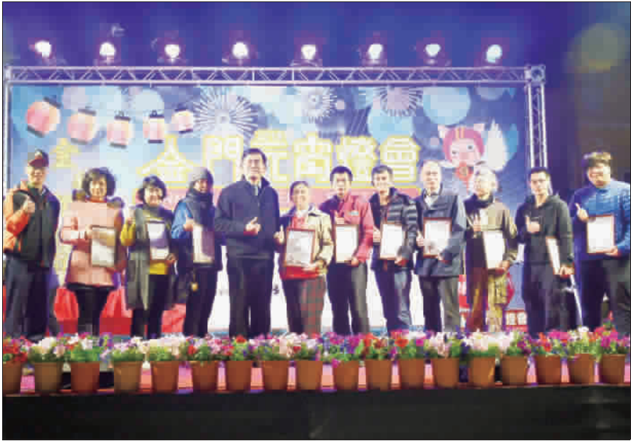
▲社會組獲獎者合影。